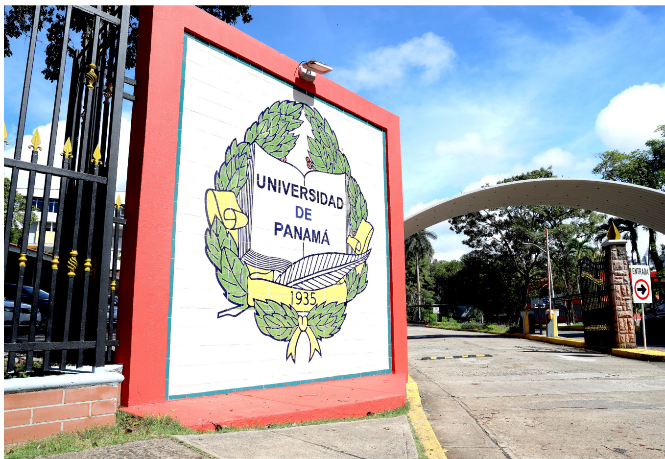
Campaña electoral universitaria.

Participarán 16 facultades que renovarán a sus autoridades : Administración de Empresas y Contabilidad, Administración Pública, Arquitectura y Diseño, Bellas Artes, Ciencias