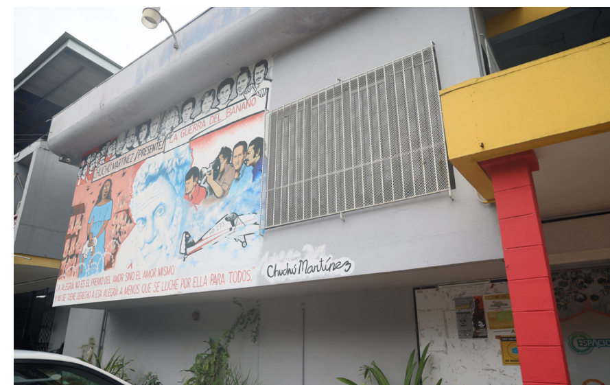
Instalaciones del Grupo Experimental de Cine Universitario.

El taller contará con la participación del cineasta belga-ecuatoriano