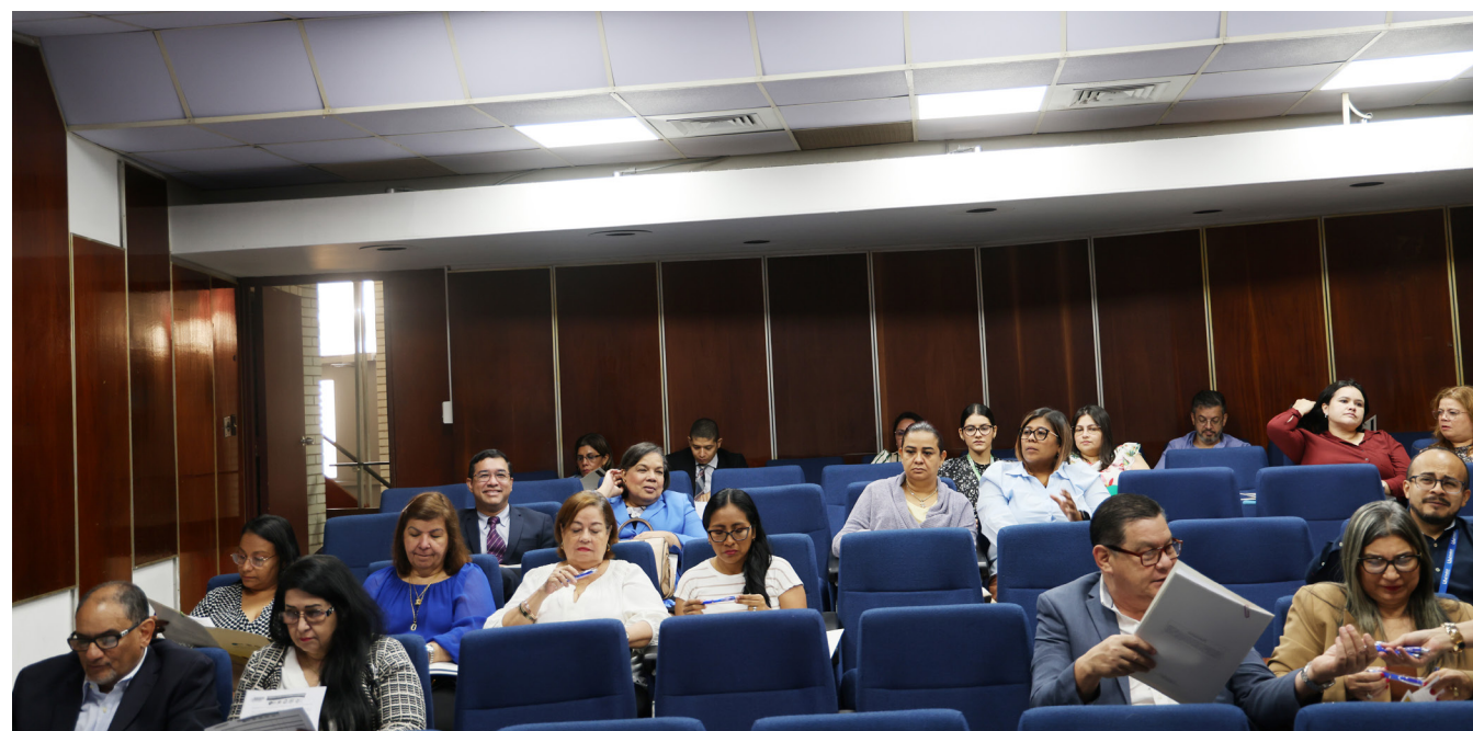
Participaron especialistas de las 33 universidades particulares en el auditorio del campus Harmodio Arias Madrid.