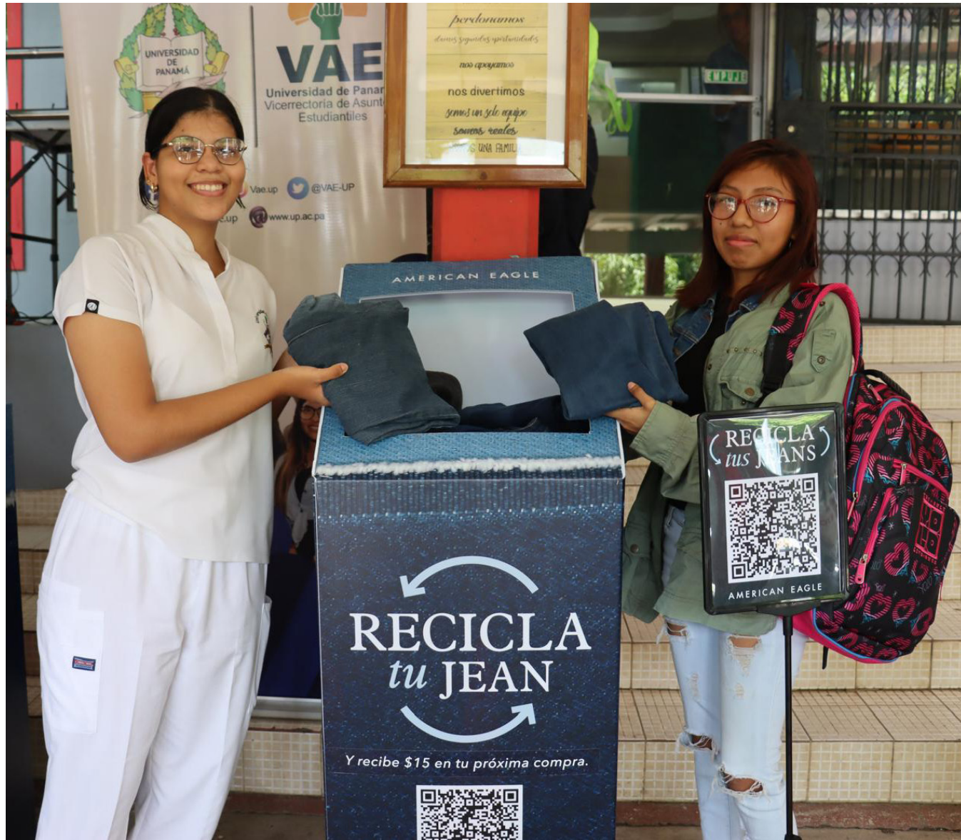
Estudiantes donan jeans destinados a convertirse en maletas para escuelas multimodales en la provincia de Coclé.

En la actividad se ofertaron mazas artesanales de harina y maíz, dulces, bebidas, comidas caseras y manualidades, creadas por artesanos panameños.