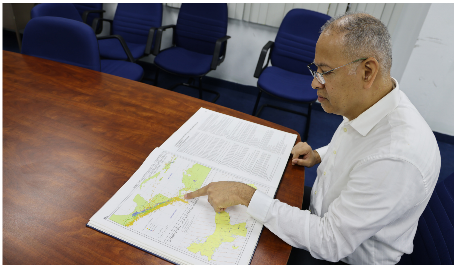
El director del IGC muestra el mapa con datos sobre la sismicidad en Centroamérica.