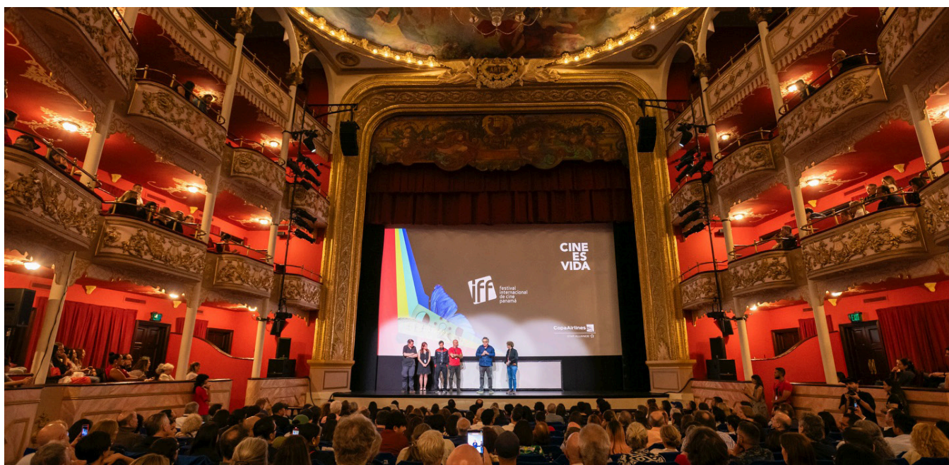
La Gala de Clausura en el Teatro Nacional.