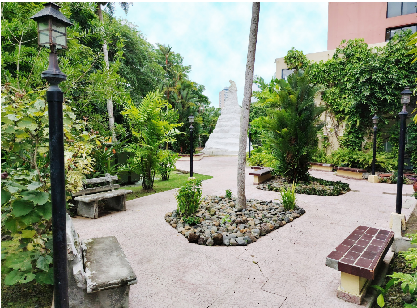
Plaza de la Bandera en la Colina de la UP.

El OEU reafirmó su compromiso de conducir un proceso confiable, transparente y abierto a toda la comunidad universitaria, en estricto cumplimiento de la normativa vigente.