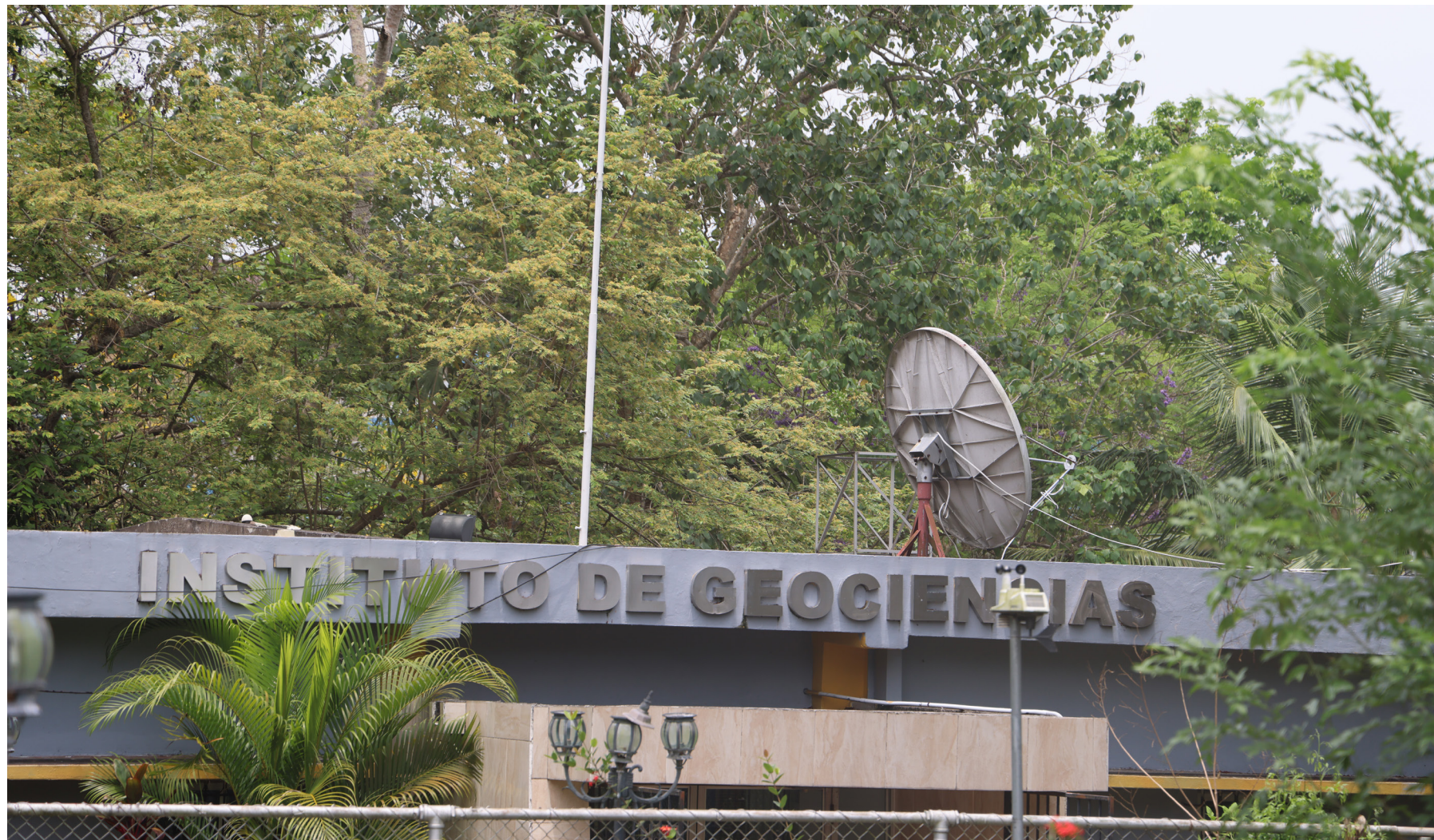
El IGC es la única entidad en el país que posee los registros de los movimientos sísmicos.

y actividades a desarrollar en 2026, anunció el desarrollo de 2 investigaciones que llevará adelante con universidades españolas .