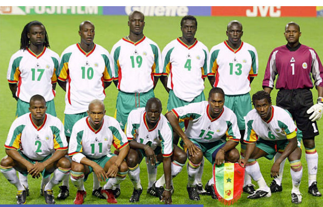
Selección de Senegal

Los países anfitriones desembolsaron una cifra récord,