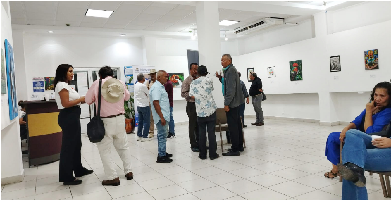
Exposición colectiva presentada en la Galería Manuel E. Amador.