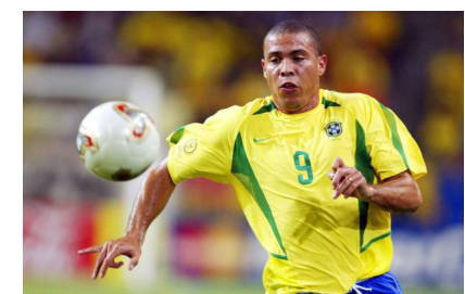
Ronaldo Nazário. "el Fenómeno"

Corea del Sur, por su parte, se convirtió en el primer equipo asiático en alcanzar las semifinales, aunque su travesía estuvo marcada por una polémica arbitral que aún hoy genera debate en los círculos futbolísticos.