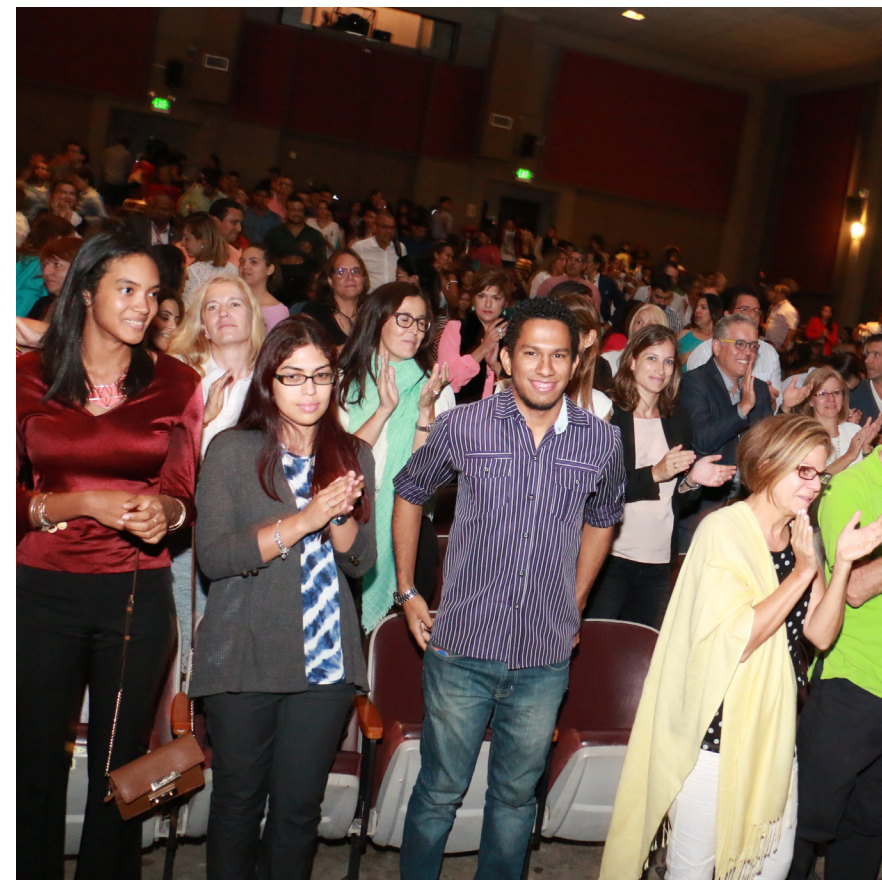
Promociones especiales para los asistentes.