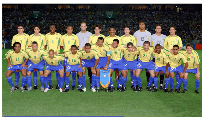
Selección de Brasil