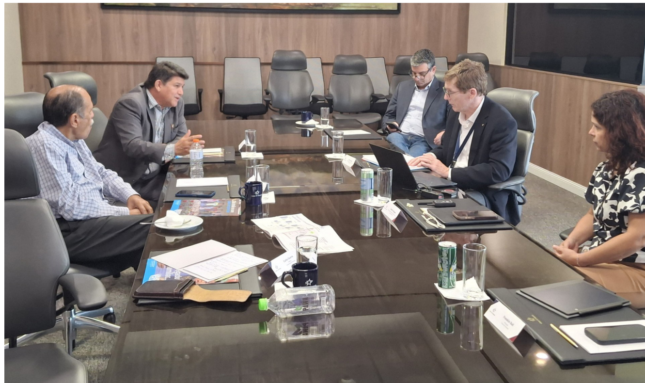
Representantes de la UP y la ACP.

La representación académica de la Casa de Méndez Pereira sostuvo que el apoyo de la universidad ayudaría en la búsqueda de soluciones a los