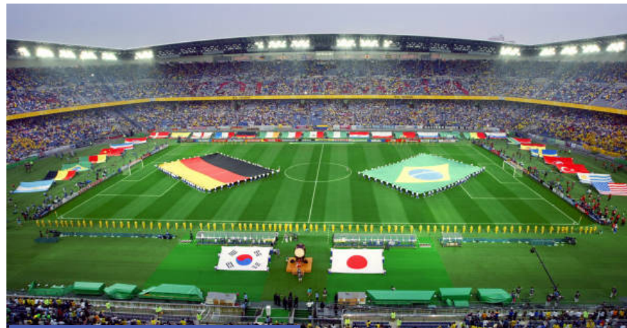
Estadio Internacional Yokohama

Más allá de los gastos de organización, el torneo