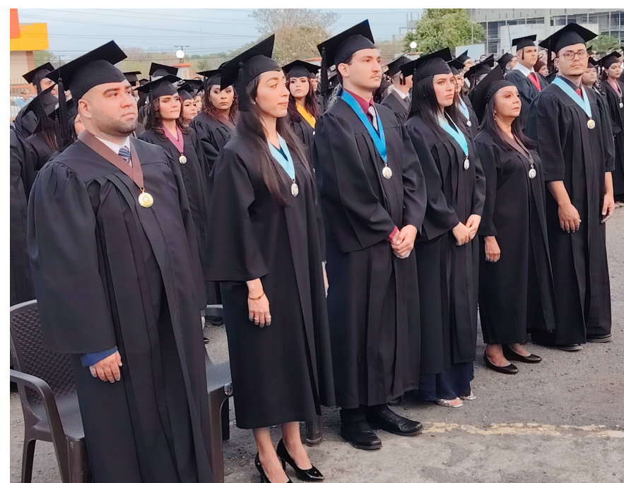
Primeros puestos del Cruls.

de las licenciaturas en Ciencias de la Enfermería e Ingeniería Agrónoma.