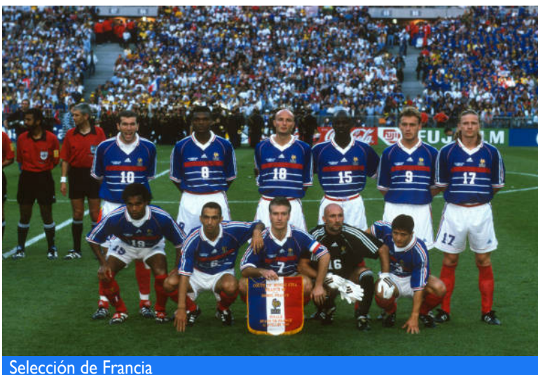
Selección de Francia

Francia 1998 no solo significó la expansión del formato a 32 selecciones, sino que inauguró una nueva era en la relación entre el deporte, la sociedad y el mercado. Aquel torneo, celebrado entre el 10 de junio y el 12 de julio, dejó cifras récord, una lección de identidad nacional y un misterio médico que aún resuena en la memoria del deporte rey.