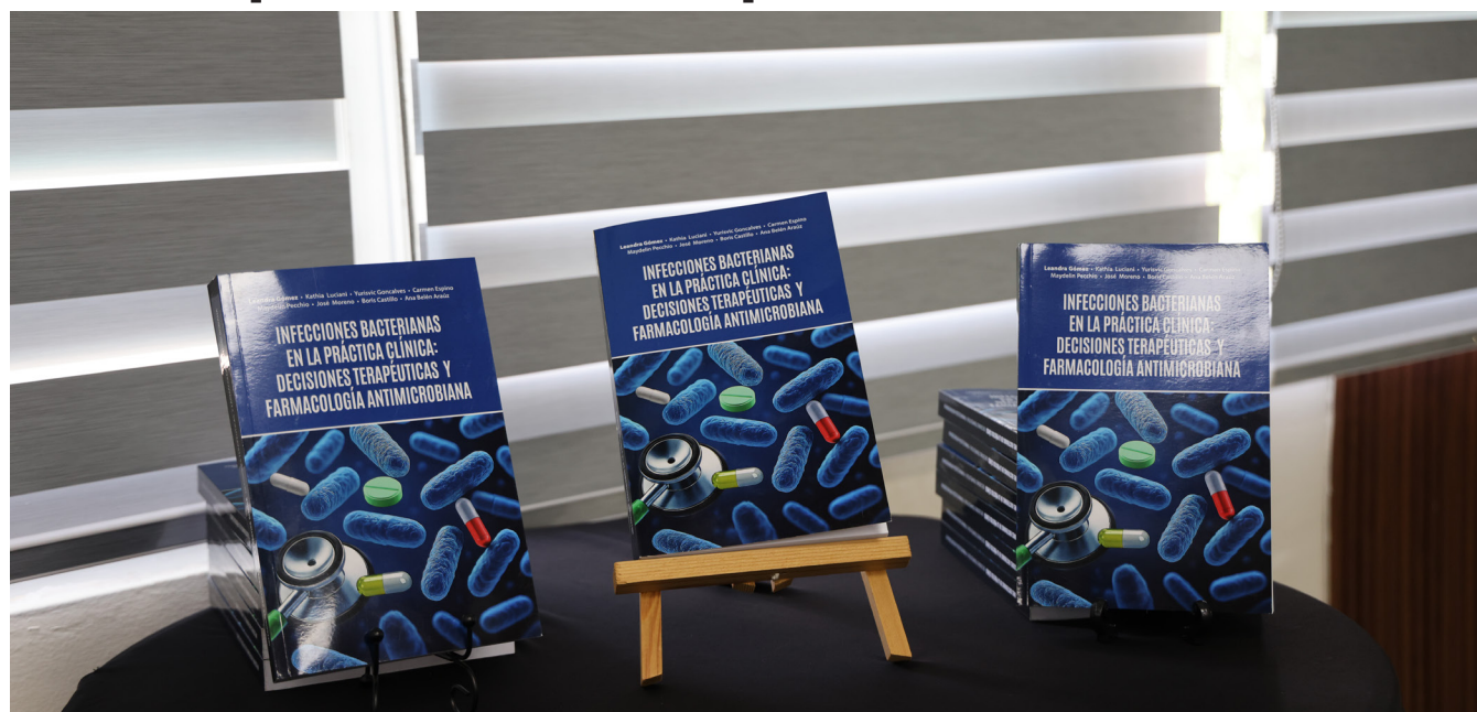
Obra publicada de la Facultad de Medicina se incorpora como bibliografía indispensable en el ejercicio docente y la práctica clínica.