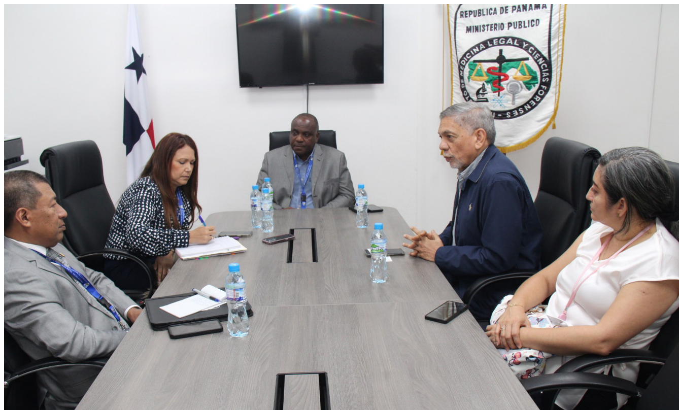
Encuentro entre directivos del IEA y el Instituto de Ciencias Forenses.

Como resultado del encuentro, se planteó avanzar en la suscripción de un Acuerdo Específico, en el marco del convenio vigente entre el IMELCF y la Universidad de Panamá, con el fin de desarrollar una agenda de cooperación técnica que incluya el intercambio de analistas especializados, programas de capacitación avanzada, la transferencia de metodologías analíticas y el fortalecimiento de