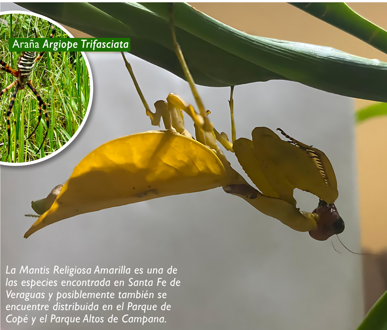
La Mantis Religiosa Amarilla es una de las especies encontrada en Santa Fe de Veraguas y posiblemente también se encuentre distribuida en el Parque de Copé y el Parque Altos de Campana.