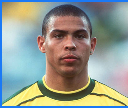
Ronaldo Nazário, "El Fenómeno"

La canción oficial del Mundial de Francia 1998 es "La Copa de la Vida" (o «The Cup of Life»), interpretada por el artista puertorriqueño Ricky Martin. Como parte de la ya instaurada forma de hacer show, desde EE. UU 1994. Fue tan impactante que la canción se convirtió rápidamente en número 1 en muchos países, luego 6 meses después se presentó en los Grammy. Aún sigue siendo una de las canciones con mayor impacto en el mundo de la música.