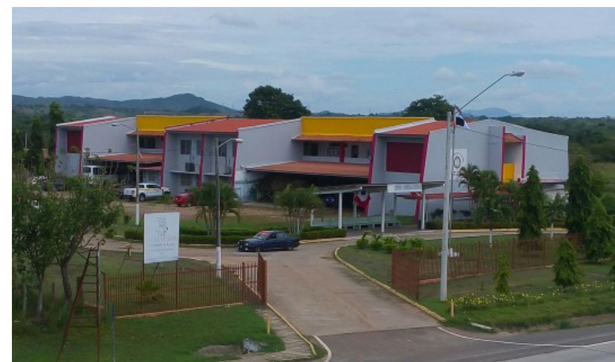
Extensión Universitaria de Aguadulce.

Un evento sin fronteras. Lo que marcó un hito para la Extensión Universitaria de Aguadulce, organizadora del evento, fue su asombrosa convocatoria bajo