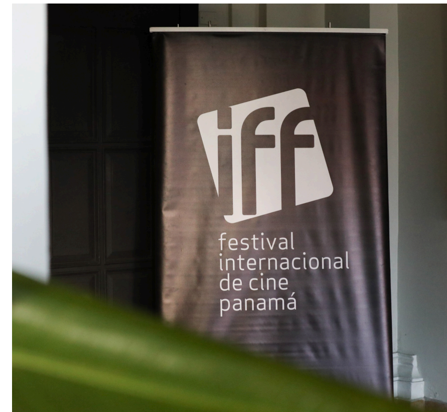
Festival Internacional de Cine Panamá.

Entre las novedades de esta edición, resalta la incorporación de la Ciudad de las Artes como un espacio estratégico para proyecciones, paneles de industria y talleres. Asimismo, la programación incluirá secciones como Perspectiva Panamá , Historias de Centroamérica y el Caribe , y Portal Iberoamericano , con especial énfasis en siete producciones panameñas realizadas con el apoyo del Fondo Cine de Panamá.