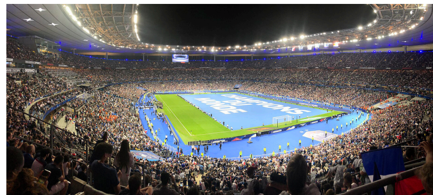
Stade de France

Francia 1998 es recordado como el Mundial que consolidó la globalización del fútbol. Fue el torneo donde los contratos millonarios con marcas deportivas comenzaron a rivalizar con la tradición de las federaciones, Adidas: (Proveedor oficial del balón y socio principal). Coca-Cola. Mc Donald's. Canon. Philips. Snickers.