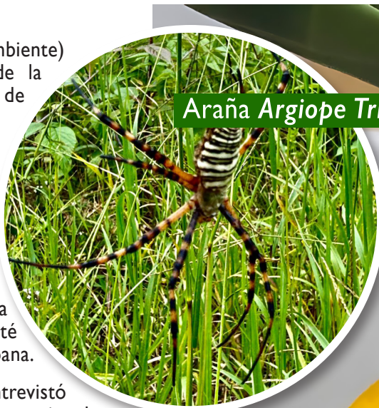
Araña Argiope Trifasciata

El estudio ha permitido identificar una interesante colección de insectos y arácnidos, entre ellos la araña Argiope Trifasciata (conocida como araña de jardín bandeada, araña tigre o araña tejedora de orbes rayada) cuya distribución se encuentra identificada en partes bajas, pero esta especie también se ha encontrado en la parte alta del Volcán Barú.