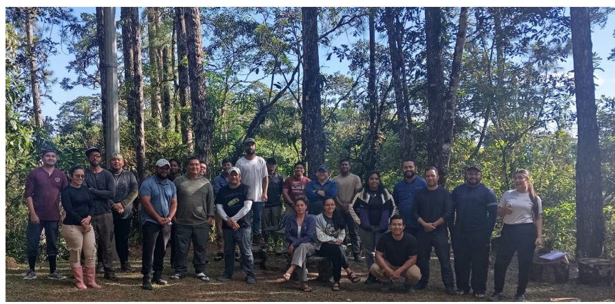
Investigadores de la UP, Unachi, Instituto Conmemorativo Gorgas, Stri y del Mida que trabajan en el proyecto Monitoreo de la Biodiversidad.