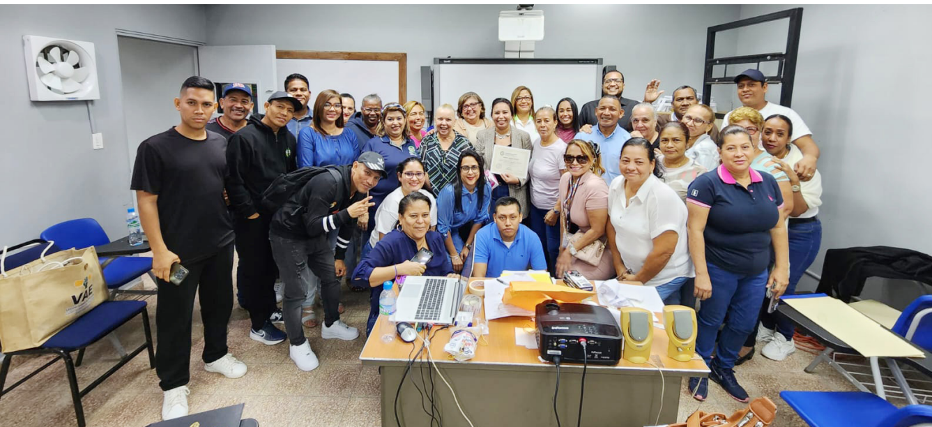
Participantes del Seminario "Comunicación y Colaboración en Equipos".