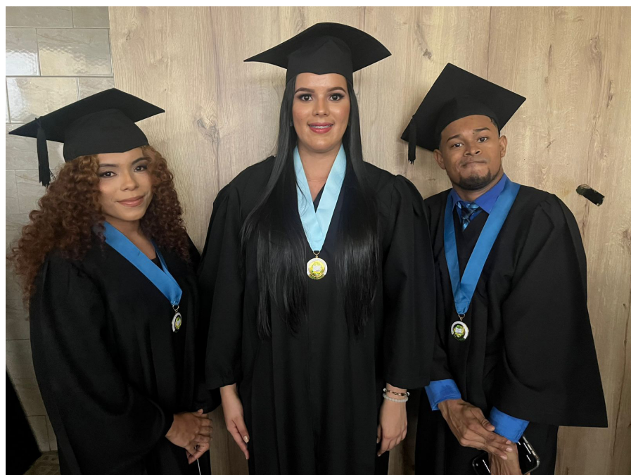
Estudiantes que ocuparon los 3 primeros puestos de honor.