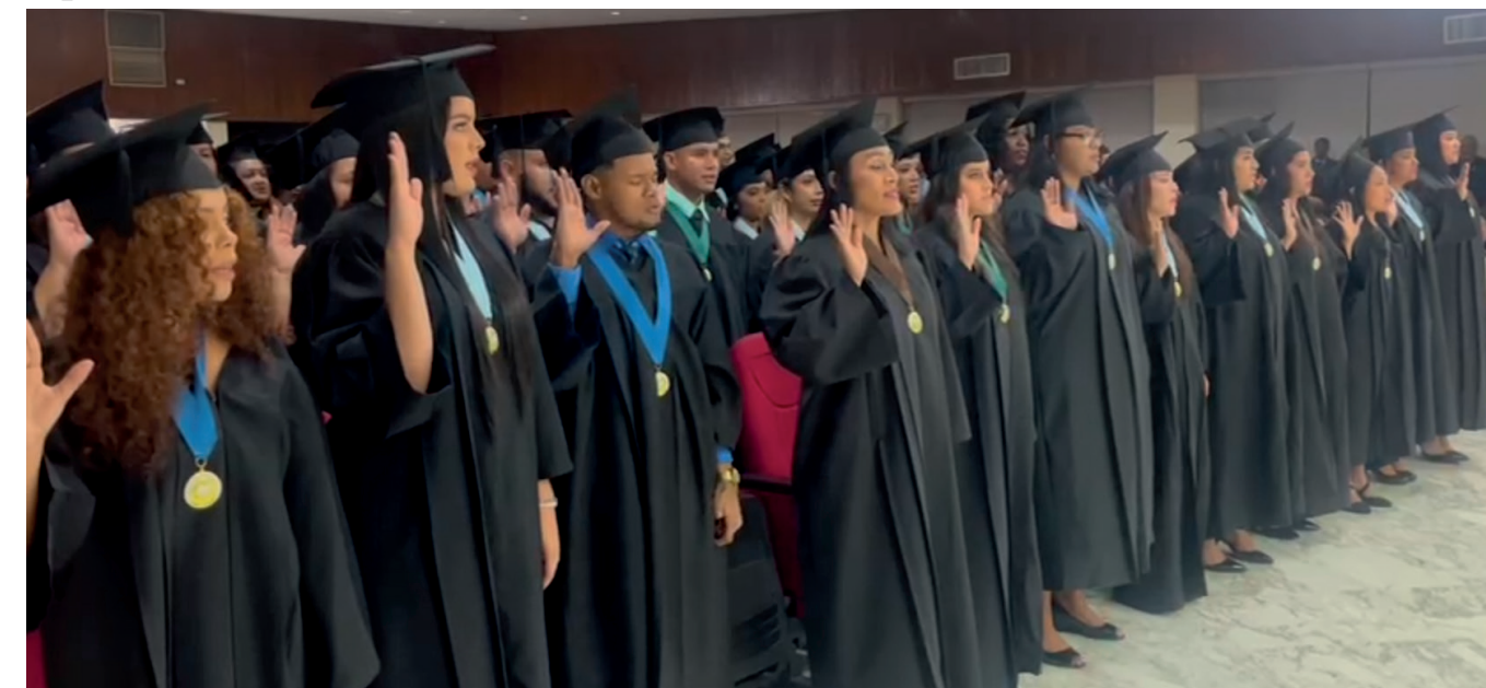
Juramentación de la Promoción 2024-2025 del CRU de Panamá Este.