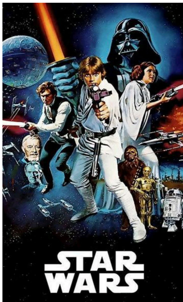
Cartelera de la película Star Wars

Star Wars obtuvo 6 premios Oscar y un premio especial al mérito para Ben Burtt por su trabajo en la edición de sonido, además, nominada en los premios Globo de Oro en las categorías de «mejor película dramática», «mejor director», «mejor banda sonora» y «mejor actor de reparto».