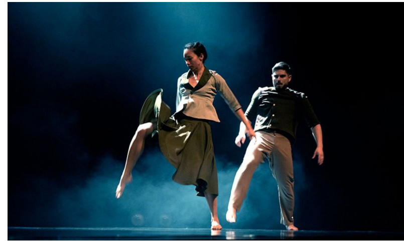
Presentación de danza.

El acto contó con la participación de autoridades, profesores y estudiantes.