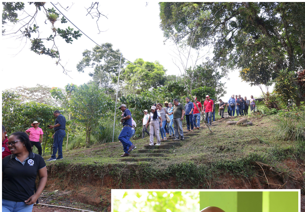
Profesores participan de la actividad de Zafra de Café en Ciricito Arriba.

El renombrado programa persigue, durante 5 años, robustecer didácticamente a la población capireña.