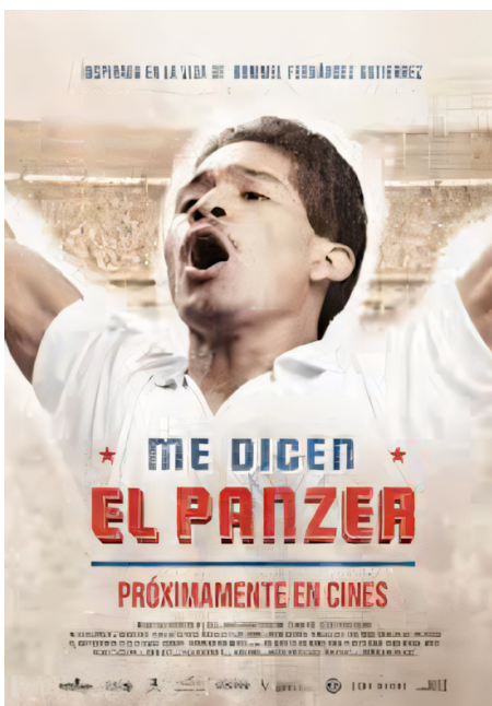
Cartelera de la película Me dicen El Panzer.

Rommel Fernández Gutiérrez, futbolista de la selección nacional, más allá de sus cifras, reconocidas por clubes del fútbol español, se convirtió en un ídolo. Esto, tras su entrega, sencillez, humildad, carisma y cariño mostrados en los oncenos donde disputaba el balón. El 6 de mayo de 1993, luego de un lamentable accidente de tránsito, lo transformó en mito.