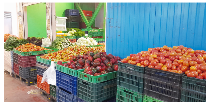
Los productos deben cultivarse libres de agentes químicos.

Expresa que por la falta de controles se continúan comercializando productos que son restringidos en el país . Indica que, corregir este problema es un paso positivo para alcanzar el concepto de “Una Sola Salud”.