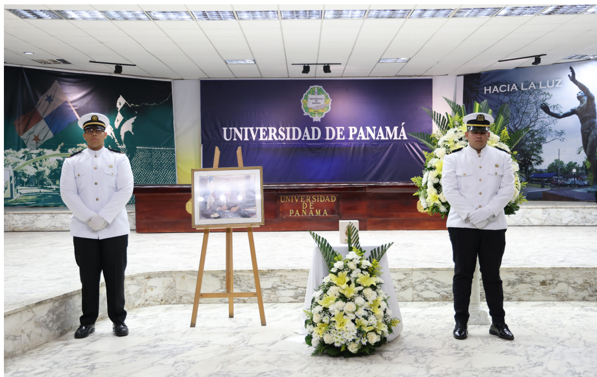
Homenaje en el claustro del Paraninfo Universitario.

El acto contó con la participación de familiares, autoridades universitarias, administrativos, estudiantes, invitados y amigos.