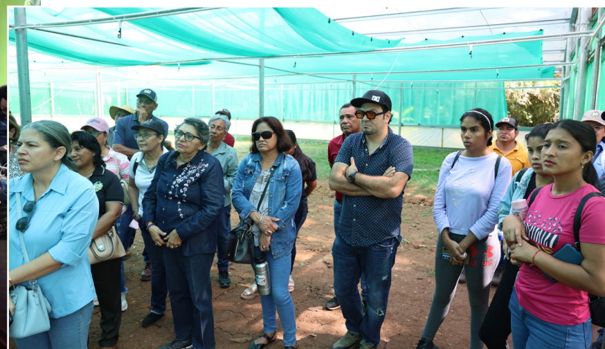
Participación de los docentes durante la exposición del proceso de siembra del café.