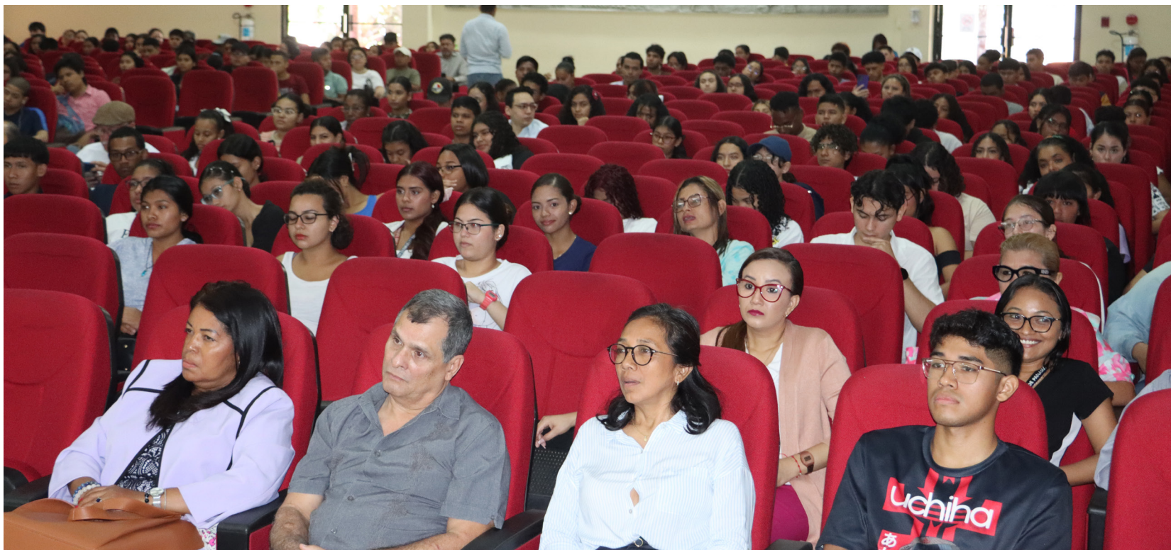
Universitarios en jornada por defensa del Canal.

En torno al balance histórico del expansionismo estadounidense, destacó el papel de los trabajadores panameños y antillanos durante la