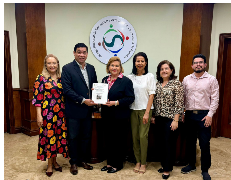
Entrega de informe anual.

Asimismo, el quinto proyecto relacionado con el diseño de un programa de educación continua para profesores, administrativos y estudiantes de la carrera , 2 proyectos relacionados con la infraestructura física y la dotación de tecnología. Y, el octavo proyecto, Fortalecimiento de los vínculos de la carrera con organismos nacionales e internacionales.