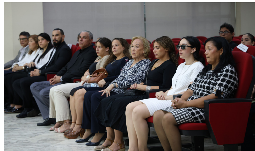
Familiares, autoridades universitarias, profesores, estudiantes, administrativos e invitados.

Destacó que, como dirigente estudiantil en la secundaria, durante la lucha contra la presencia de bases estadounidenses en Panamá, y como presidente de la Unión Universitaria de la Universidad de Panamá, participó en la llamada Operación Soberanía del 2 de mayo de 1958. Explicó que junto a otros 20 estudiantes universitarios ingresaron a la Zona del Canal a sembrar 75 banderas en diferentes puntos como acto simbólico de la soberanía que reclamaba el pueblo panameño para ese entonces. Pág. 2