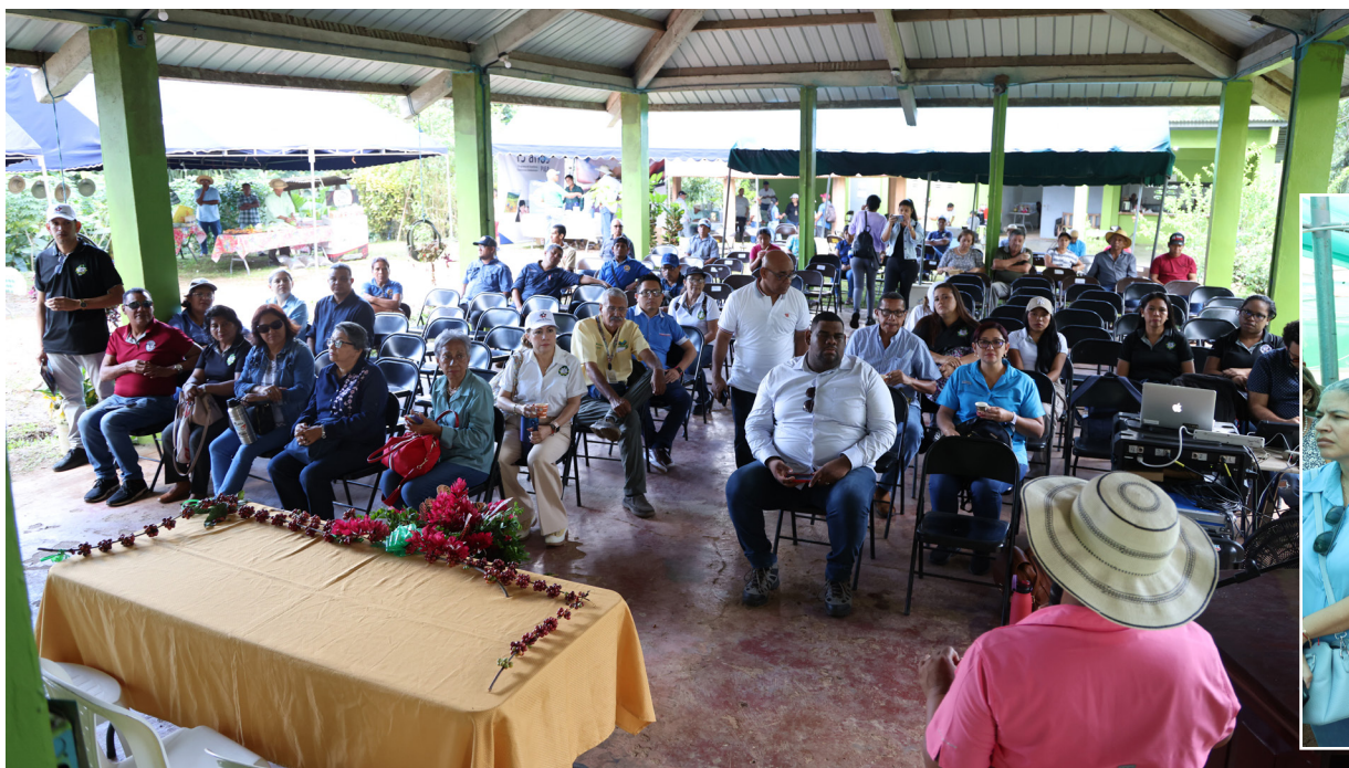
Productores de café dictaron charla sobre el referido grano a los docentes del CRU de Panamá Oeste.

como Coclé, Colón, Veraguas, Herrera, Los Santos, Bocas del Toro, Panamá Este y Darién .