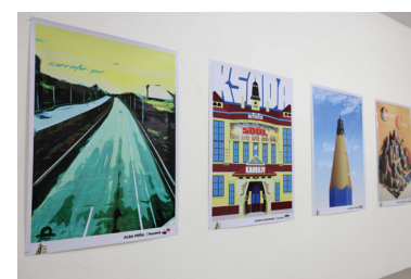
Muestra de Carteles en la Galería Manuel Amador.

El evento forma parte de las actividades culturales que la galería y la Escuela Internacional de Verano organizan durante este período. El horario de la exposición se desarrolla de 9:00 de la mañana a 7:00 de la noche .