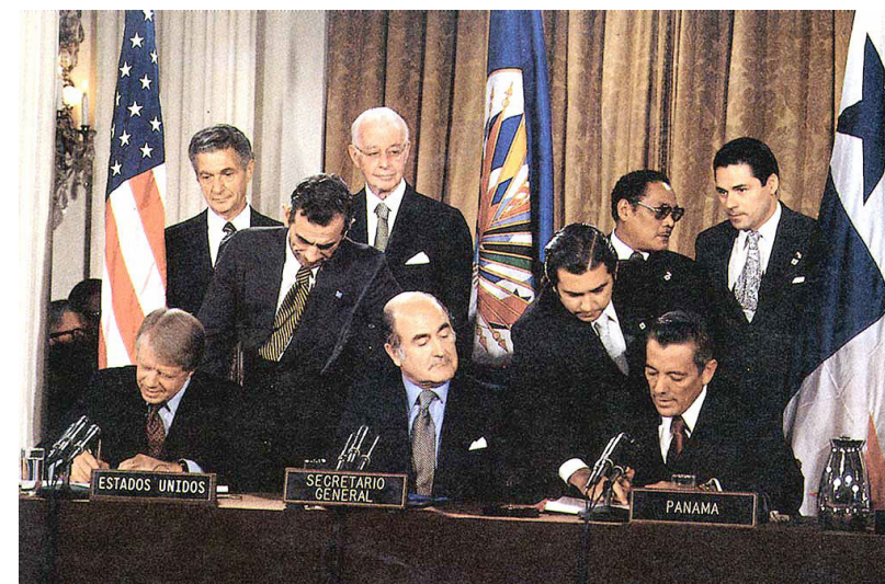
Acto protocolar de la firma del Tratado del Canal de Panamá.