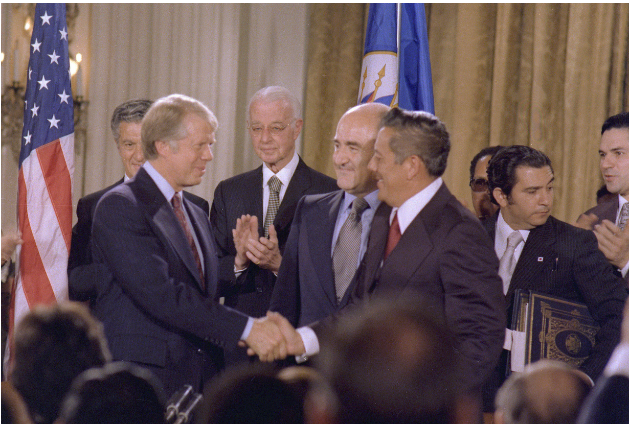
El presidente Jimmy Carter y general Omar Torrijos Herrera tras el acuerdo suscrito.