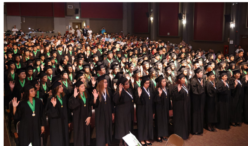
Juramento de graduandos.