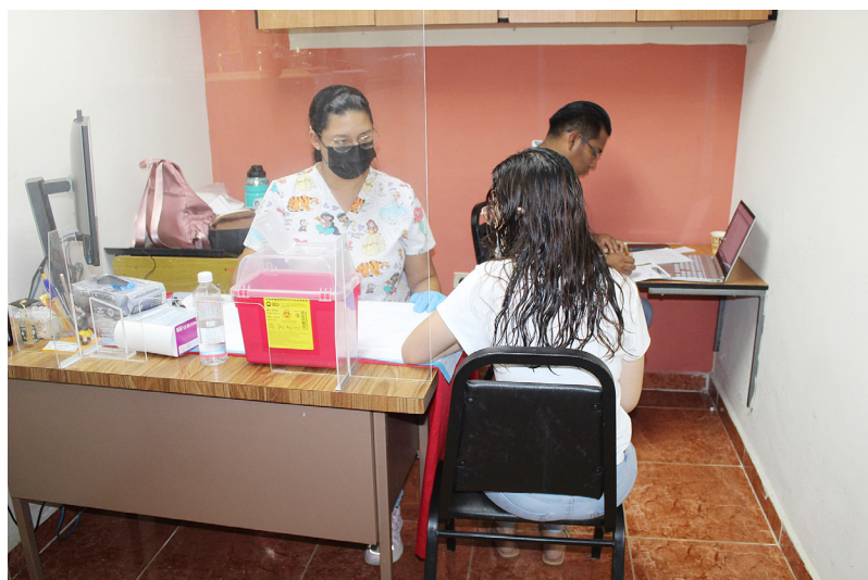
Público se realiza pruebas de VIH.