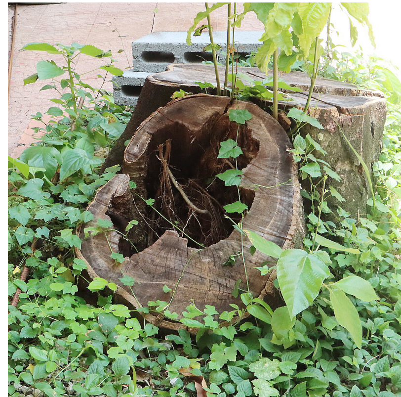
Muestra del tronco de un árbol de mamón que fue talado por estar podrido en su interior.