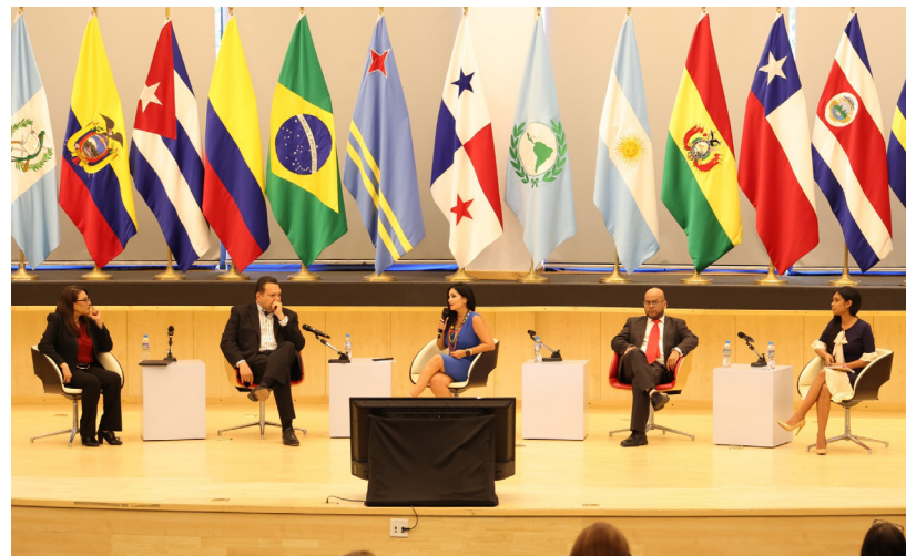
Mesa Redonda sobre ética periodística.