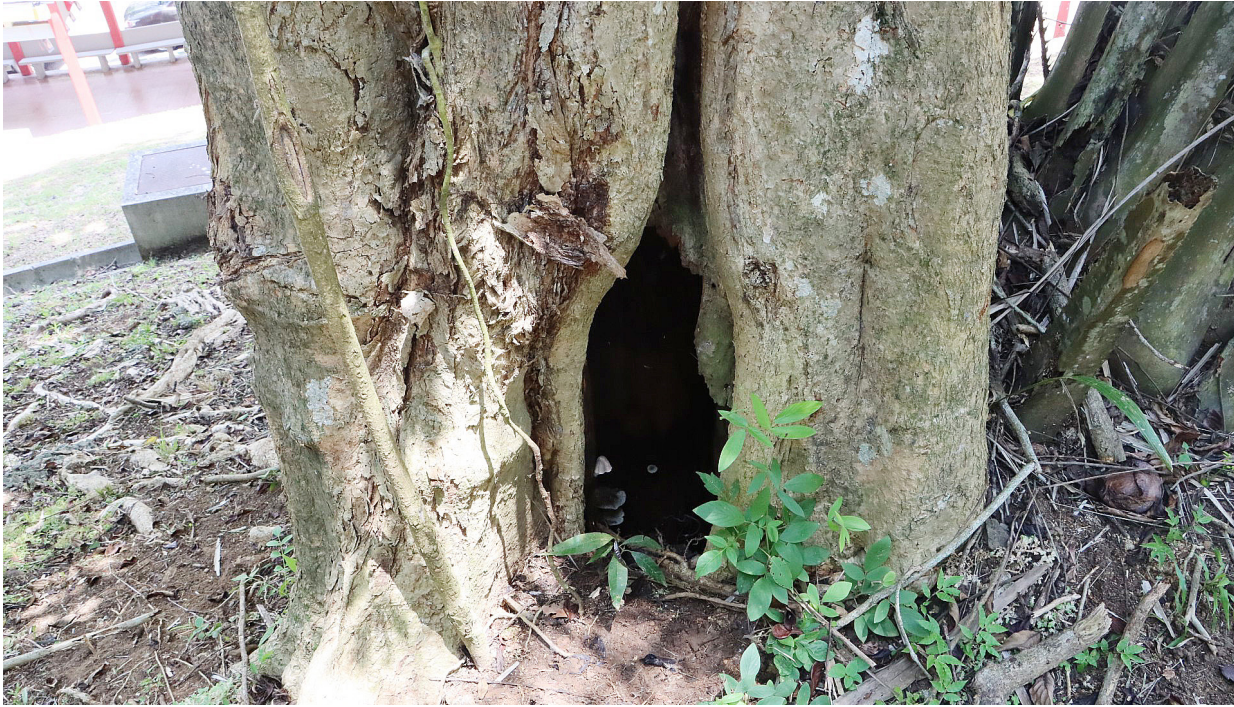
Este árbol muestra en su base una grieta. Es una de las especies enfermas que se observa en el campus.