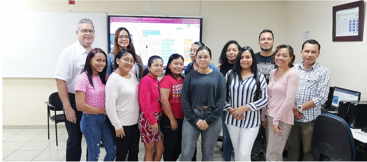
Miembros del Club de IOT, Robótica y la Innovación del Crusam.