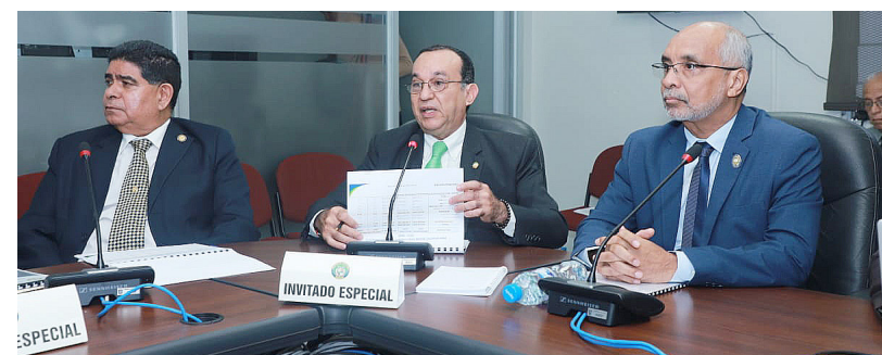
El Dr. Eduardo Flores Castro y autoridades de la UP durante la visita a la Comisión de Presupuesto de la Asamblea Nacional.

En el actual período 2023, el presupuesto asignado a la UP fue de 343 millones de dólares.