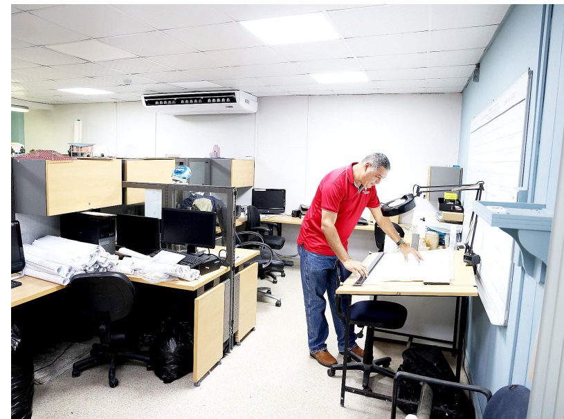
Taller de Dibujo de la DIA.