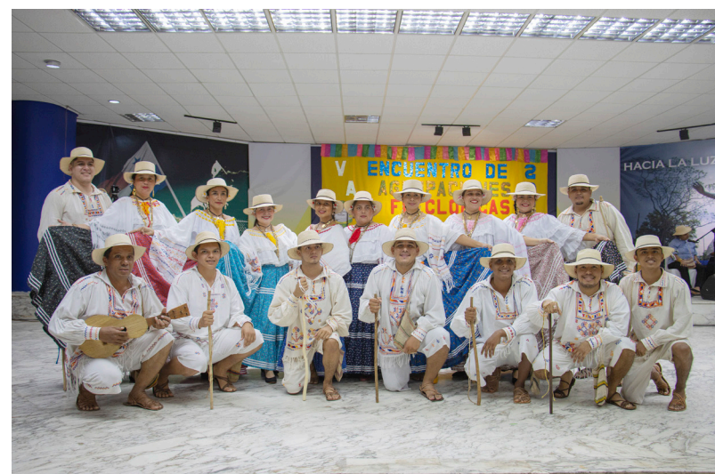
Agrupación de la Extensión Universitaria de Océ, ganadores del primer lugar.