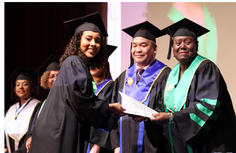
Entrega del diploma al primer puesto.