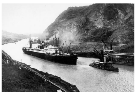
1914, año que acorta la distancia en el mundo.

operación, el cauce podría ahondarse paulatinamente para construir un canal a nivel.