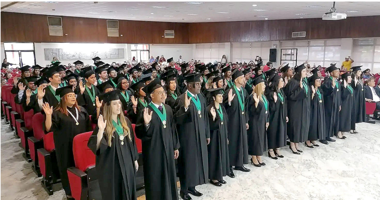
Juramentación de los graduandos.