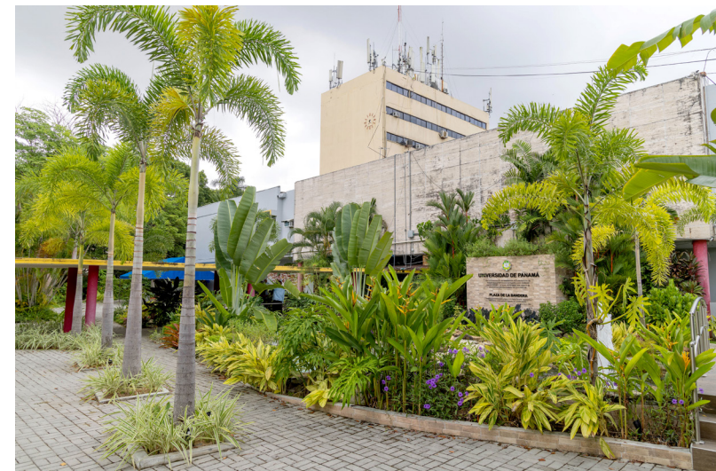
Plaza de La Bandera (colina).