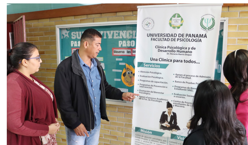
Servidores públicos de la Clínica Psicológica brindan información al público sobre los servicios que brinda esta unidad.

En el período 2020-2021 el proyecto de investigación fue avalado por la decana de la Facultad de Psicología.