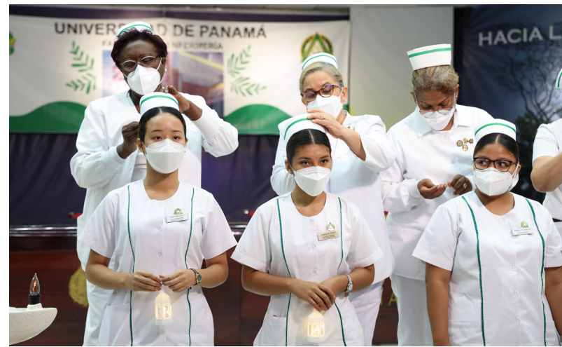
Autoridades de la Facultad de Enfermería imponen cofias y pines a estudiantes.