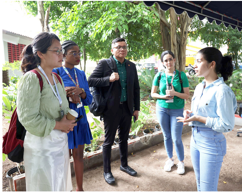
Primer grupo de visitantes en el Jardín Internacional de Cícadas.

Actualmente, el Herbario alberga 155 mil especímenes de plantas, algas y hongos , recolectadas a lo largo y ancho del país.