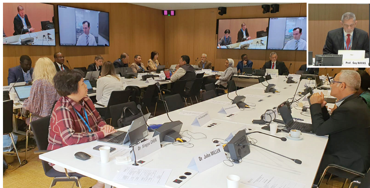
Primer día de Reunión de Consulta de la OMS con participación de la industria farmacéutica, junio 2023, Ginebra, Suiza.