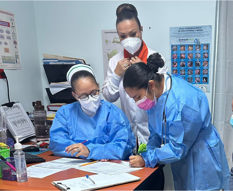
Estudiante de Enfermería llena el formulario de una paciente para realizar prueba de Papanicolaou.