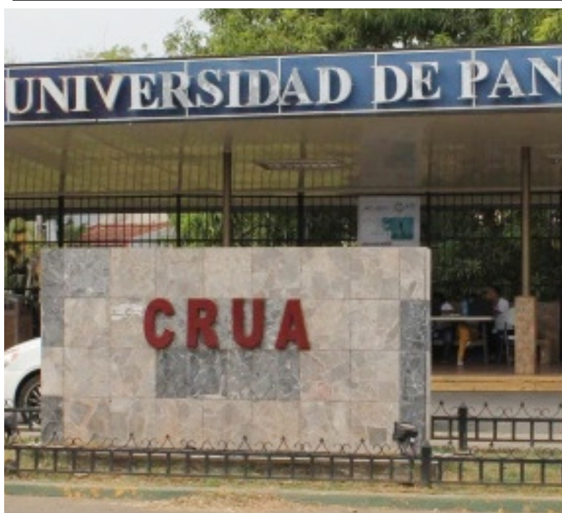
CRU de Azuero debate sobre la problemática de la CSS.