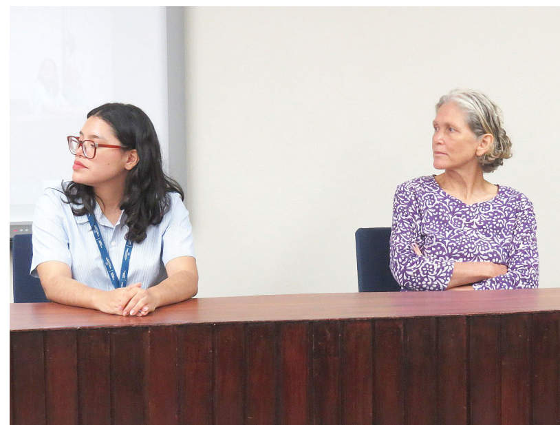
Expositoras disertaron sobre el cambio climático.

Argumentó que la actividad obedece a la Resolución de Gabinete 48 de 30 de mayo de 2023, que declara el Estado de Emergencia Ambiental para toda la República de Panamá. Y esto frente al pronóstico de la Administración Nacional Oceánica y Atmosférica (NOAA) sobre el hecho de que se aproxima una situación de El Niño moderado para finales de este año o inicios del próximo.