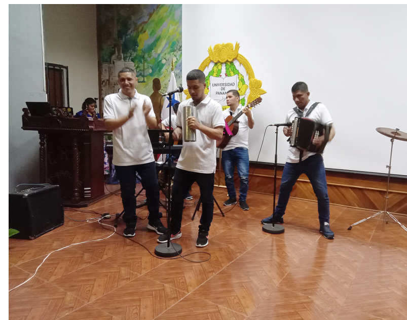
Grupo musical "Libert Art".