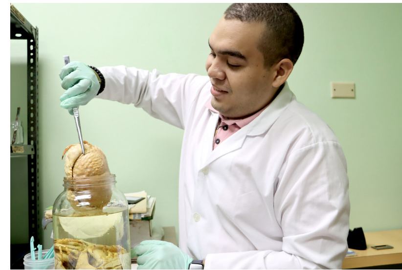
Esta unidad es considerada como Museo Húmedo porque los especímenes están conservados en alcohol.