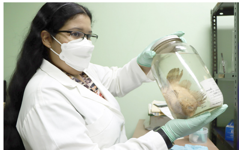
Estudiante muestra un espécimen (pez) que reposa en el Museo.