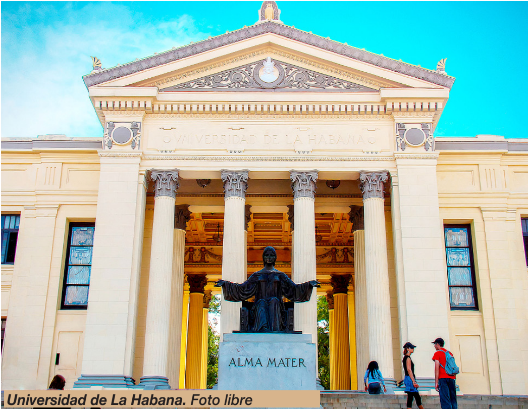
Universidad de La Habana. Foto libre