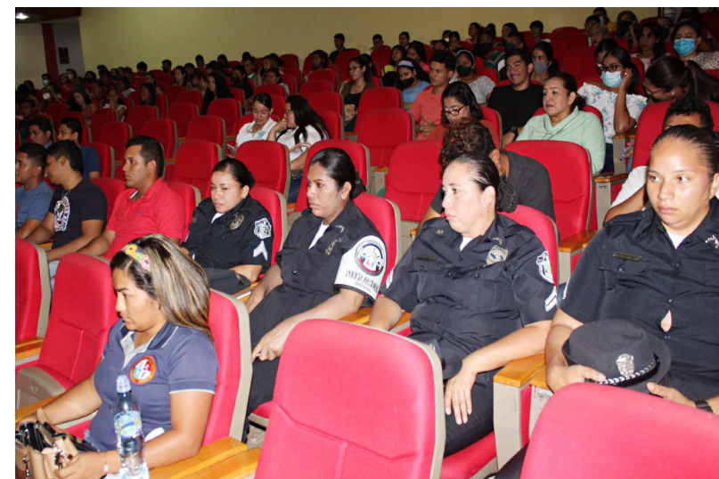
Estudiantes e invitados especiales.

Agregó que, a pesar de que la mitad de la población panameña es mujer, todavía en el ámbito público prevalece la figura masculina; sin embargo, la mujer tiene mucho que exigir y aportar. Recalcó que en la vida cotidiana el hombre y la mujer son diferentes.