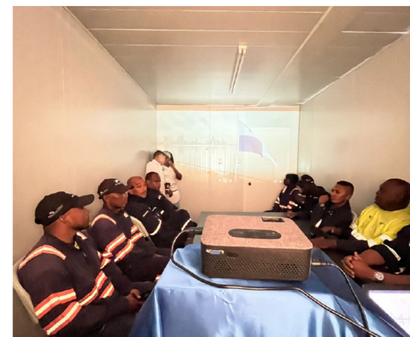
Participantes al seminario sobre Responsabilidad Social Corporativa.