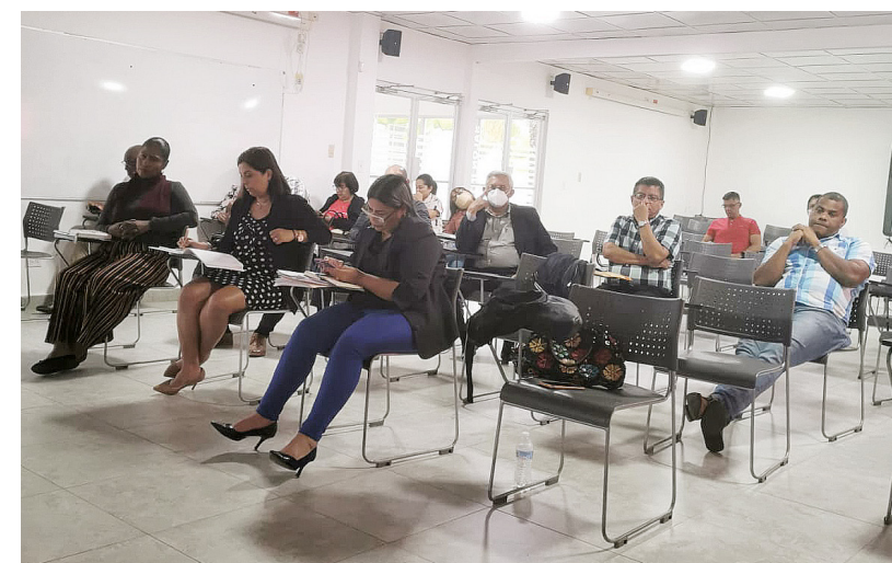
Reunión para coordinar Banco de Datos para el período académico 2023.