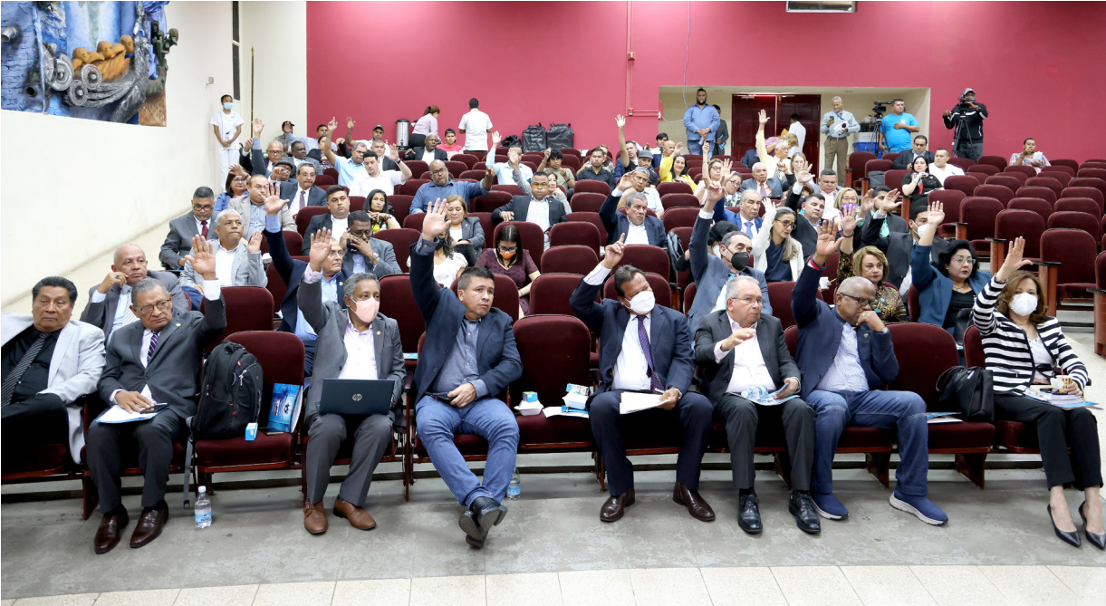
Miembros del CGU aprueban otorgar Doctorado Honoris Causa a la rectora de la Universidad de La Habana.