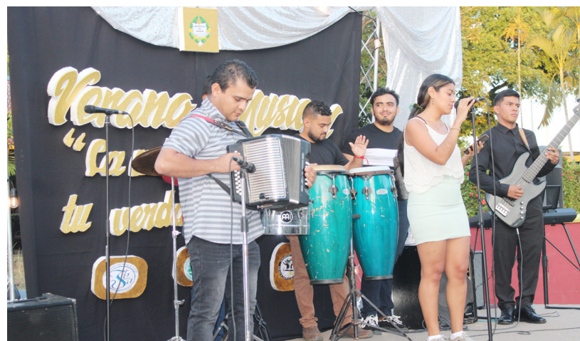
Estudiantes participaron de la clausura de los cursos de verano.