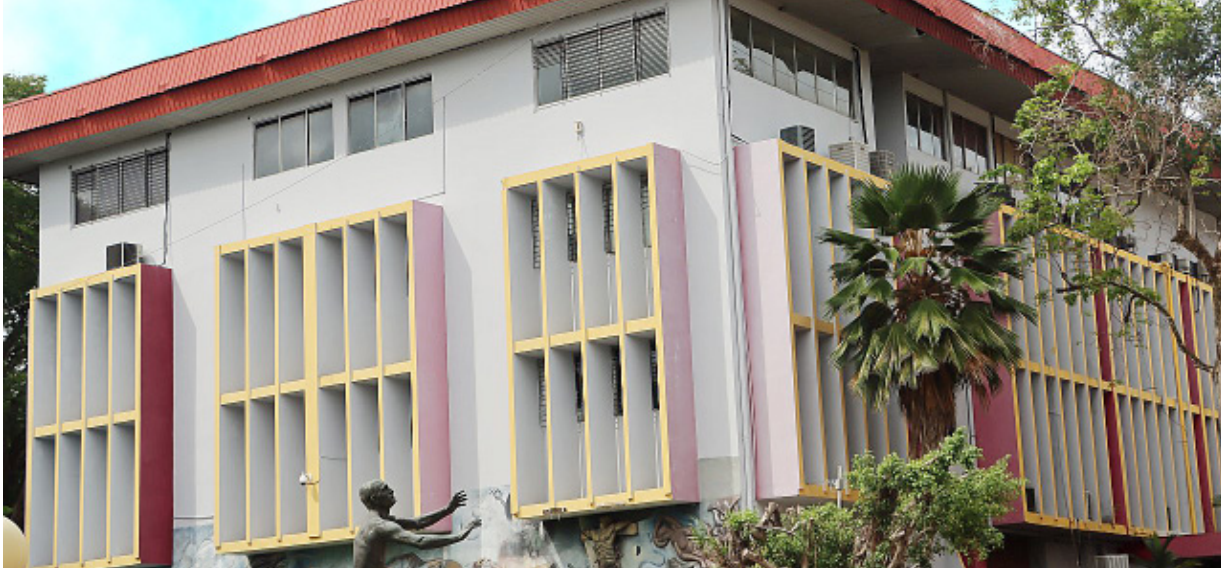
Cada año la matrícula en la UP se incrementa, se espera que en 2023, 100 mil asistan a las aulas de clase.