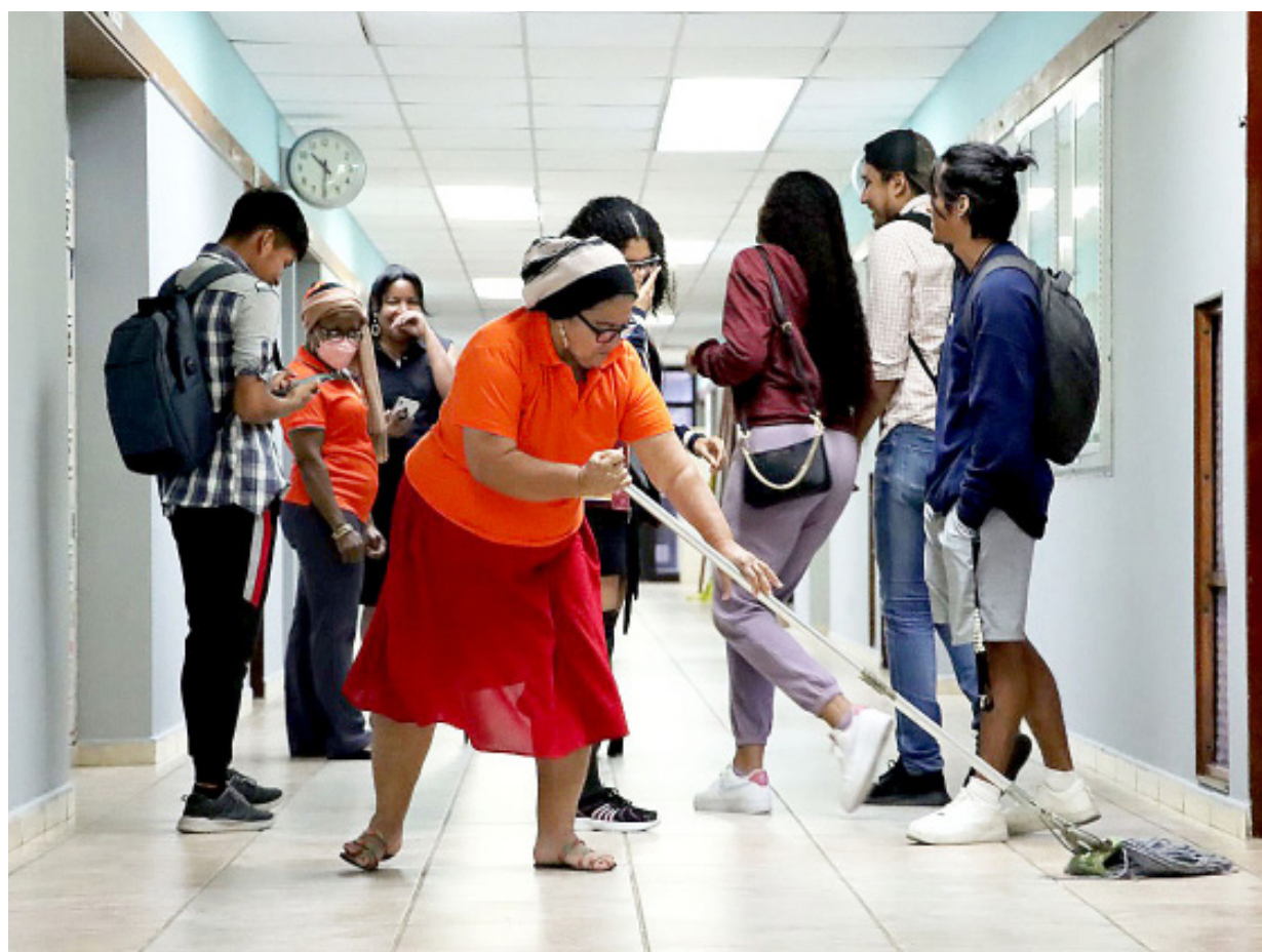
En sus inicios en la UP se desempeñó como trabajadora manual.

“Hay que prepararse en la vida, no importa la edad, hay que tener metas, es muy importante que les echen ganas a sus estudios, si son personas adultas, no les pongan barrera a sus sueños, terminenlos”.