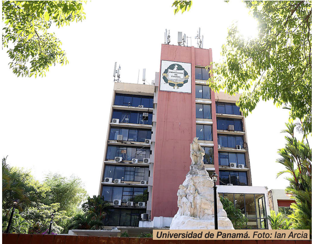
Universidad de Panamá.

Este año por primera vez representantes de más de una docena de países participarán en el evento académico