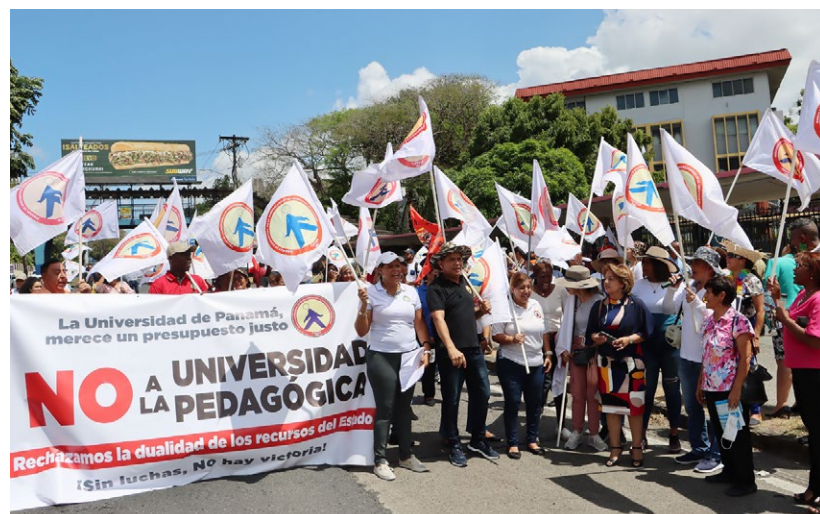
Manifestantes se mantienen alerta ante un posible madrugonazo carnavalero.

La decana argumentó que seguirán con las acciones de calle porque no solo afecta a los Campus Octavio Méndez Pereira y Harmodio Arias Madrid, también a la Facultad en sus 3 modalidades, sobre todo, el Centro Regional Universitario de Veraguas, la Extensión de Soná y más de 24 Programas Anexos . Recordó que en todas las provincias está representada la Facultad de Ciencias de la Educación.