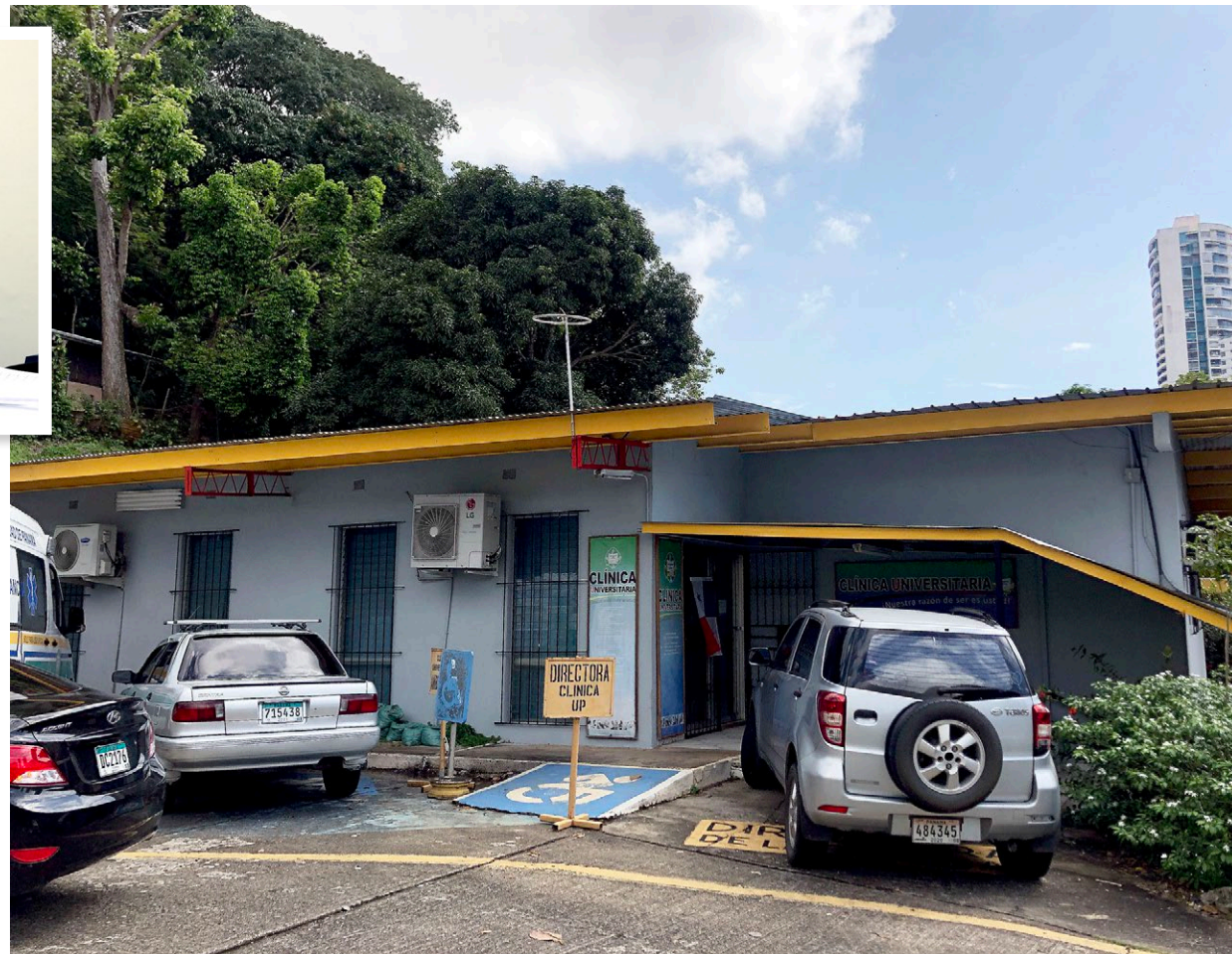
La Clínica Universitaria brinda los servicios de odontología, laboratorio, enfermería y medicina general.