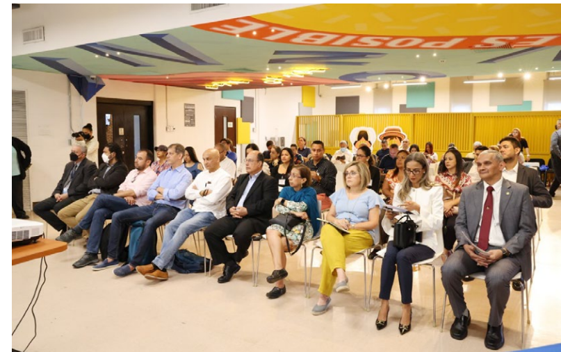
Representantes de las diferentes universidades quienes participaron de la sensibilización.