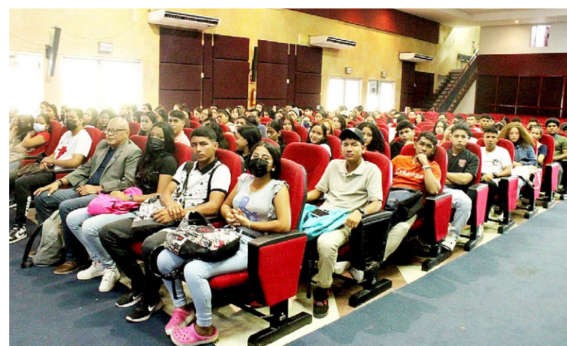
Estudiantes de primer ingreso del Crua inician curso propedéutico.

Su participación les permitirá conocer cómo un equipo de profesionales triunfó en el desempeño de sus emprendimientos y las estrategias que ellos pueden aplicar para el éxito de su carrera profesional.