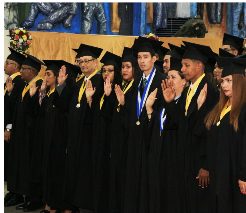
Juramentación de los nuevos profesionales de la Facultad de Economía.