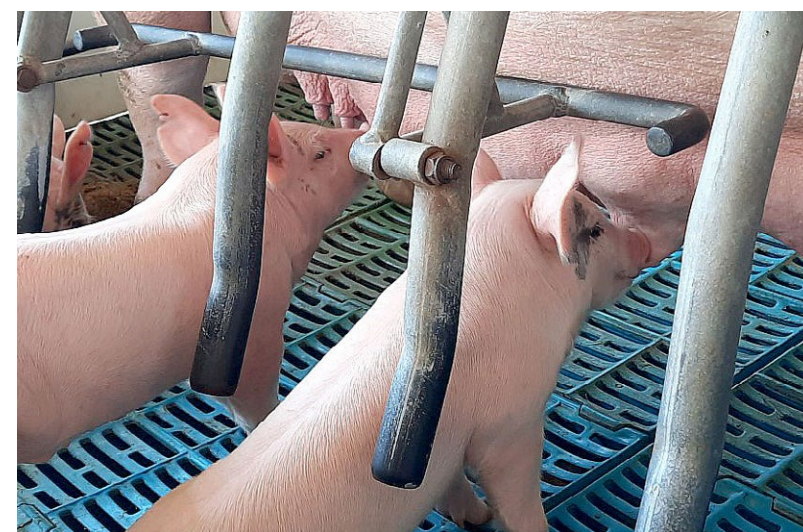
Producción porcina destacada en la ganancia de peso, y la abundante producción de semen.