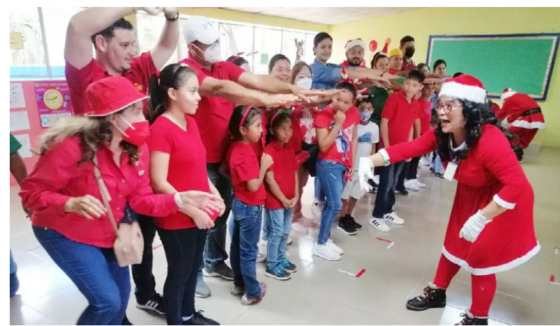
Niños de la Escuela de Valle Rico junto a administrativos del Crua.

La liga fue organizada por la coordinación de Desarrollo Estudiantil y el Club de Estudiantes "Renovación Estudiantil Universitaria" (REU).