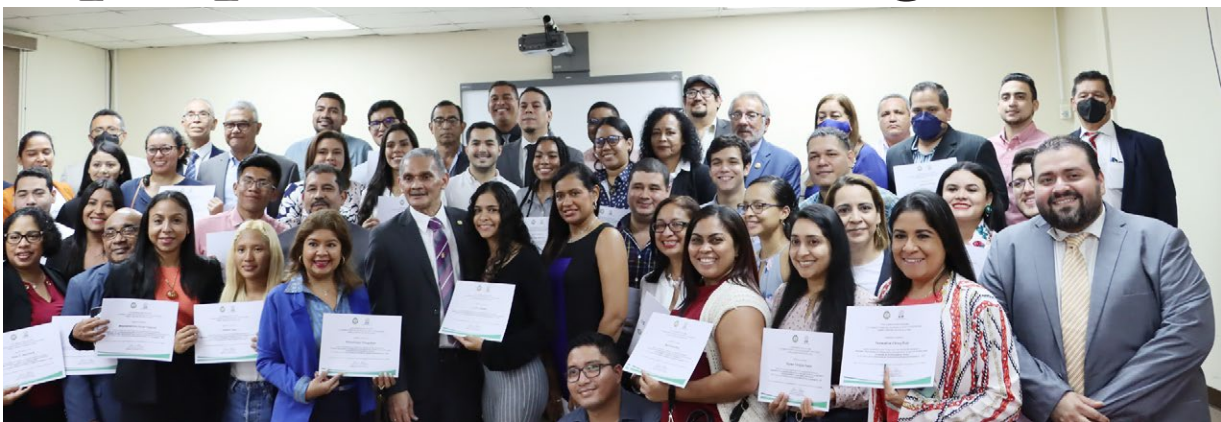
Los proponentes recibieron un certificado como reconocimiento tras la aprobación de sus proyectos de investigación.