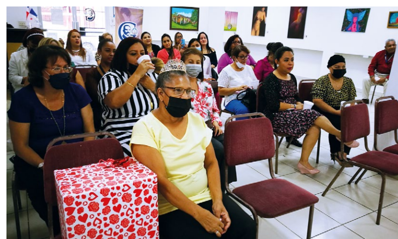
Madres participan de homenaje en su día.

Roquebert sostuvo que es necesario conformar otros grupos de investigación que aporten al desarrollo de la Primera Casa de Estudios Superiores.