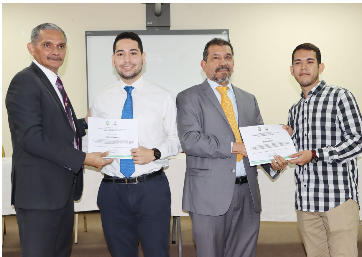
Premiación de los proyectos de la VIP 2022.

En relación con los centros regionales universitarios, las direcciones laboran en la edición de la Revista Científica Centros. El Centro Regional Universitario de Colón trabaja en la Jornada Científica Virtual de Psicología 2020, con fondo de autogestión por un monto de $2 mil 600.00 . Además, el de la Revista Colón Ciencias, Tecnología y Negocios.