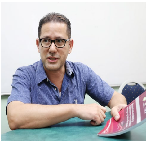
El grupo está dedicado a la investigación y divulgación de los problemas sociales de los pueblos.