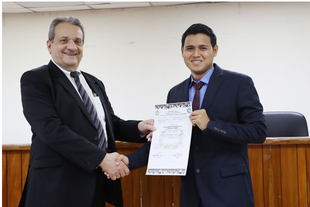
El Organismo Electoral Universitario es el encargado de organizar las elecciones en la UP para elegir a sus autoridades.

Manifestó que 2023 será un año intenso; habrá elecciones para elegir a profesores y estudiantes ante el Consejo General Universitario (CGU). También, se darán elecciones para elegir a los representantes administrativos ante los órganos de gobierno universitario.