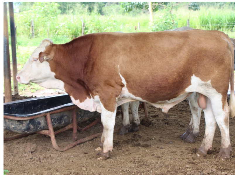
Raza utilizada para hacerla resistente al clima del país.

La investigación demostró que mediante la nutrición el porcino produce mayor cantidad de semen.