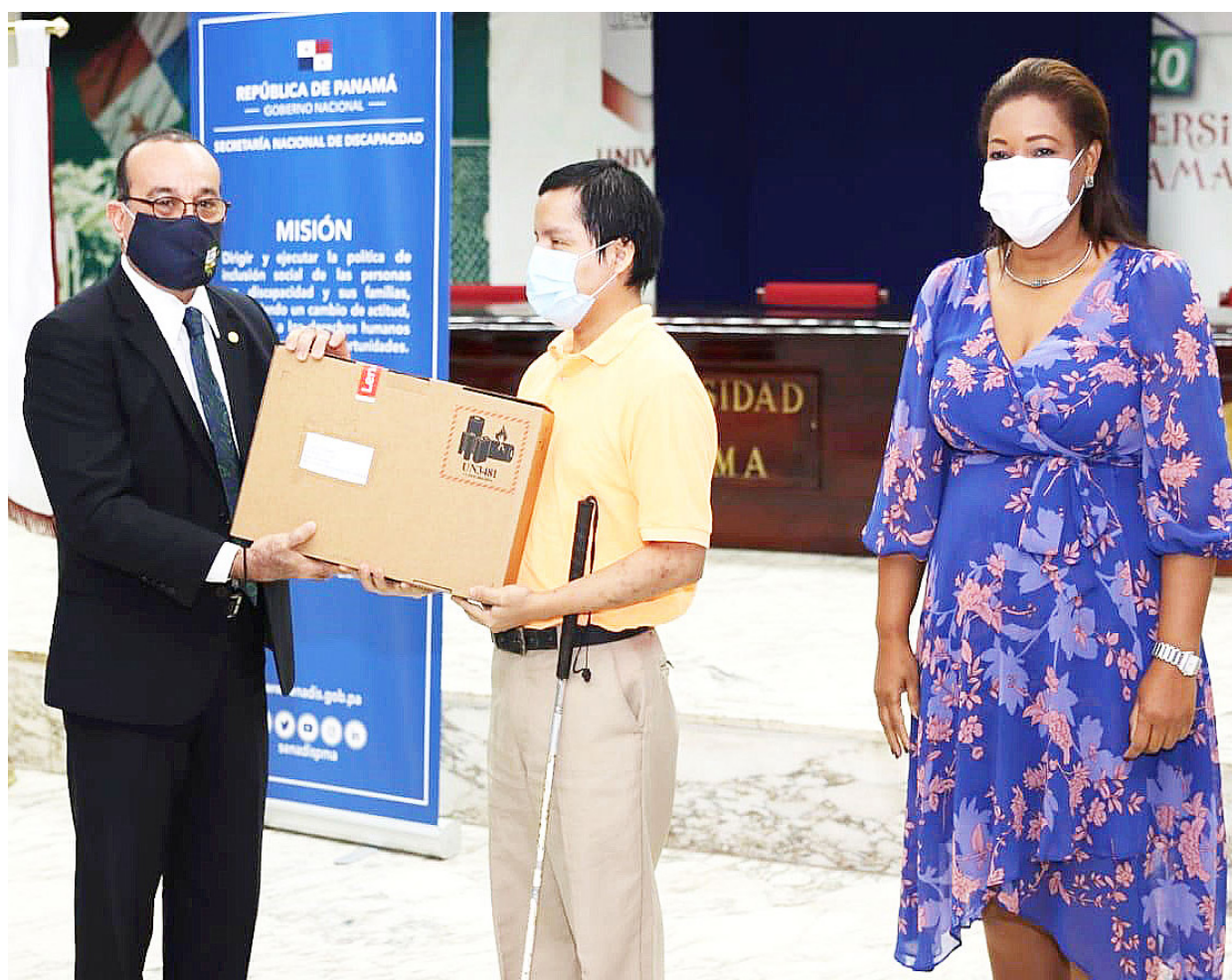
Rector de la UP entrega computadora portátil a estudiante donado por la Senadis.

En cuanto al Estado, la Senadis brinda apoyo a las personas con discapacidad; el despacho de la Primera Dama ofrece respaldo educativo mediante la donación de computadoras y tabletas y el Ministerio de Desarrollo Social (MIDES) brinda apoyo económico -Ángel Guardián-.