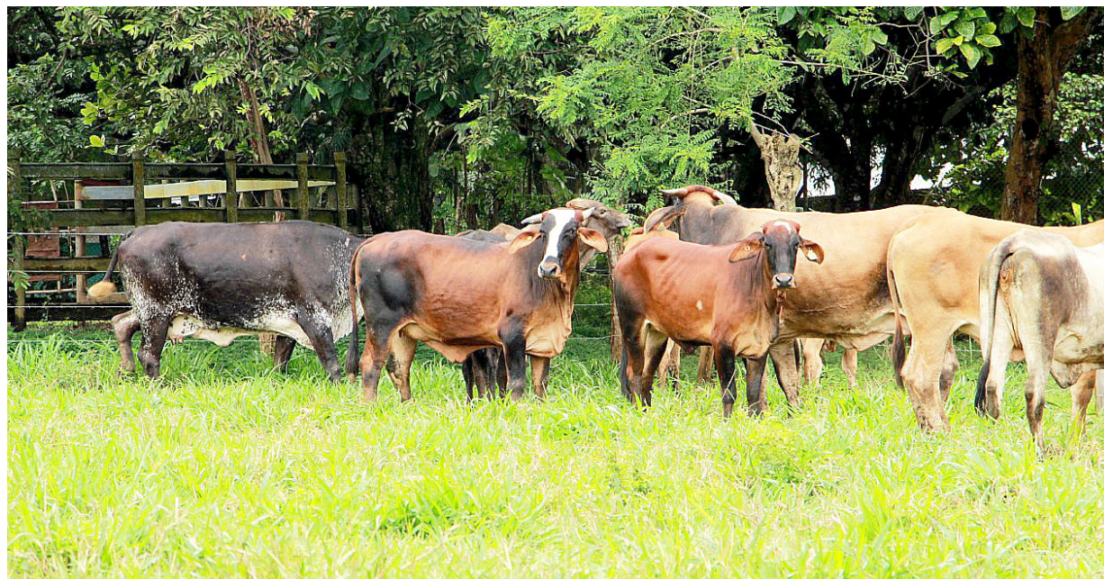
Ganado mejorado mediante genética para producción de leche y carne.