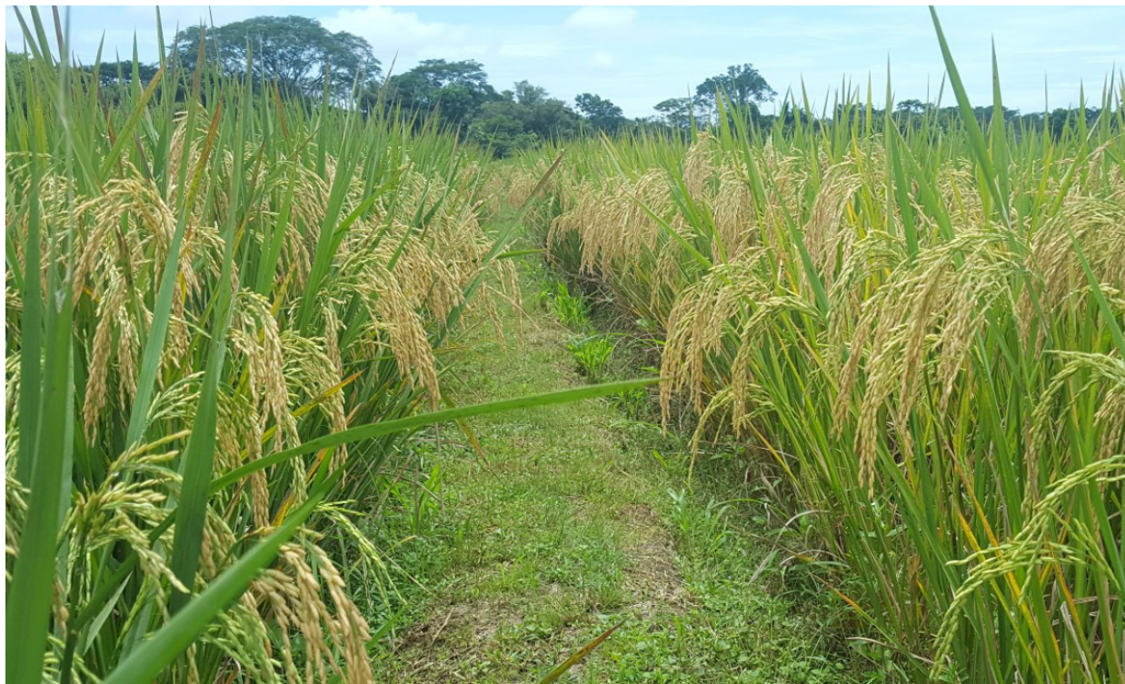
La investigación busca mejorar que la semilla sea resistente a los insectos.