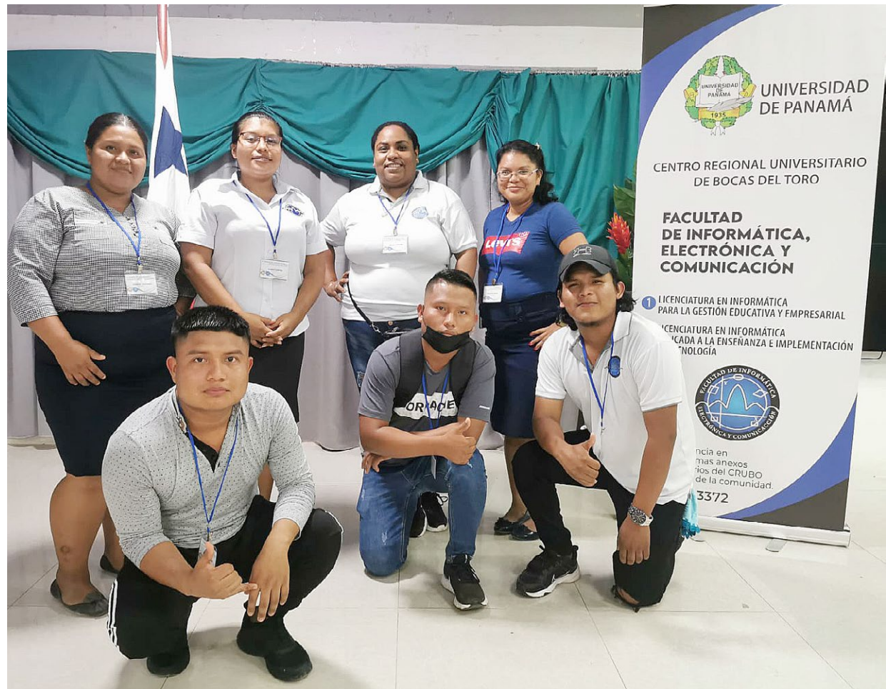
Estudiantes de la Fiec del Centro Regional Universitario de Bocas del Toro.