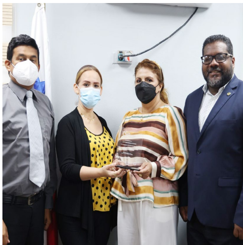
UP tuvo una destacada participación durante la actividad por lo que se hizo acreedora a este reconocimiento.

El contralor Gerardo Solís señaló que para este proyecto se creó la plataforma informática denominada Control Social en los Gobiernos, que proporcionará 2 tipos de reportes electrónicos: inversión pública y seguimiento de suministros, que se ejecutarán en los municipios y juntas comunales con la veeduría social de jóvenes universitarios.