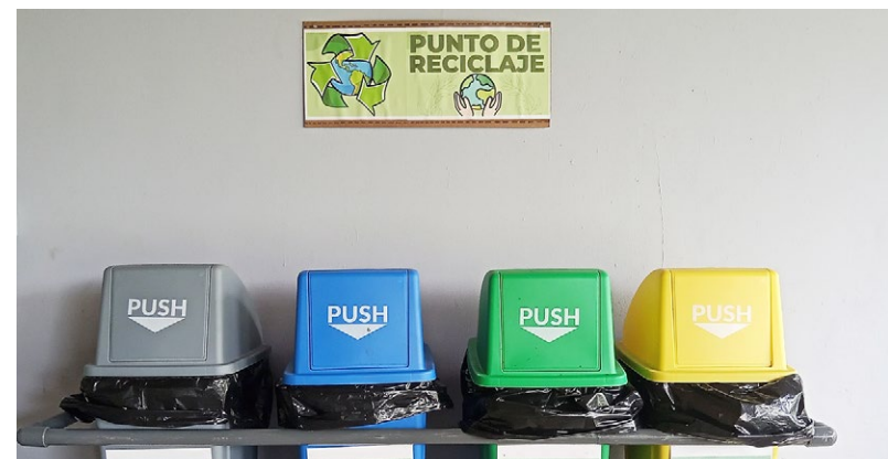
Recipientes para el reciclaje de la basura.

"Ser agentes de cambio es responsabilidad y compromiso de todos".