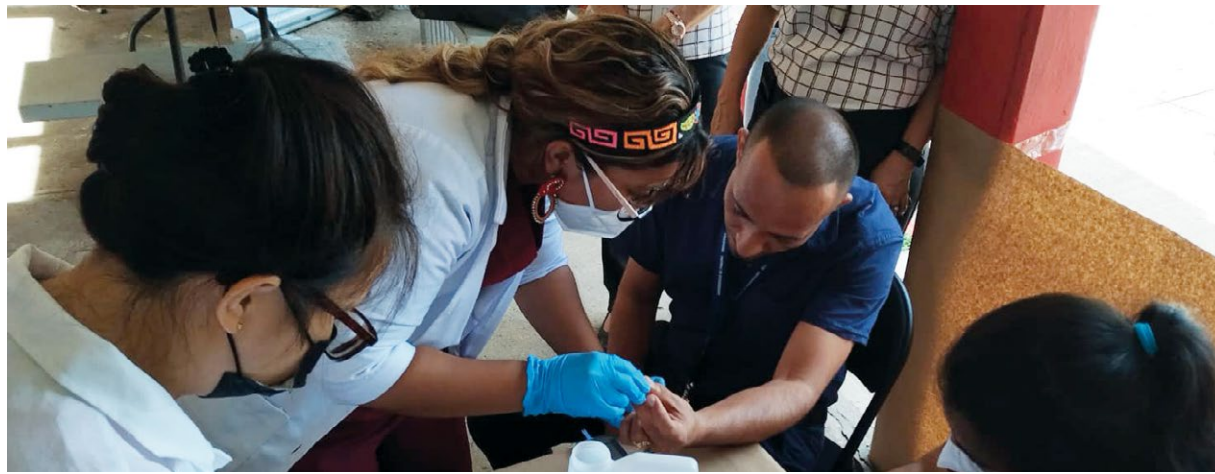
Atención de salud y venta de productos en la marquesina de la VAE.