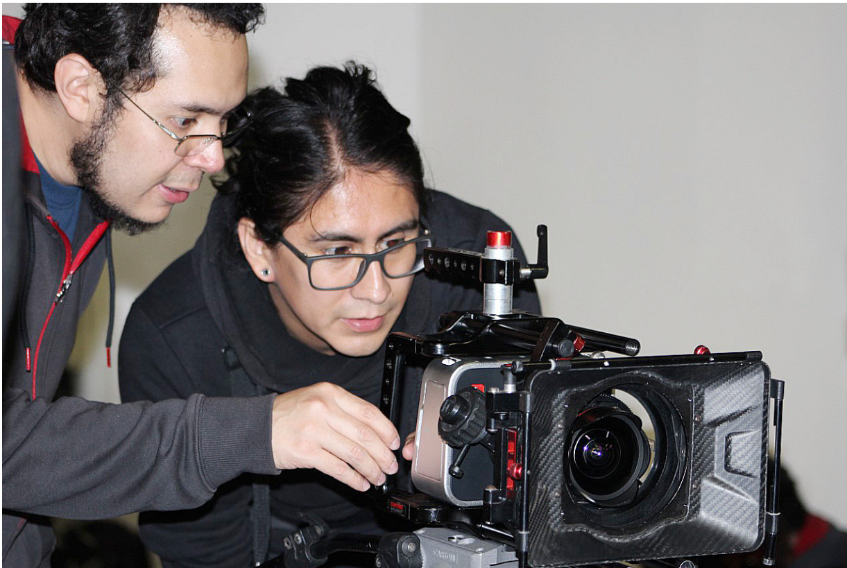
Taller de cinematografía dictado en el Estudio Multiuso del GECU.