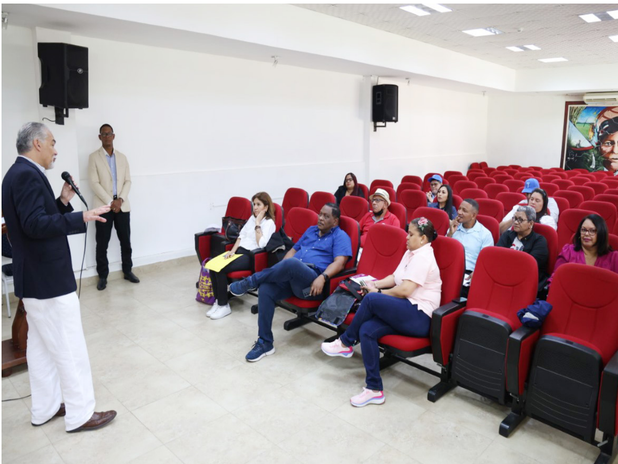
Los periodistas recibieron capacitación sobre las "Políticas de redacción y estructuración de textos informativos del Semanario La Universidad".