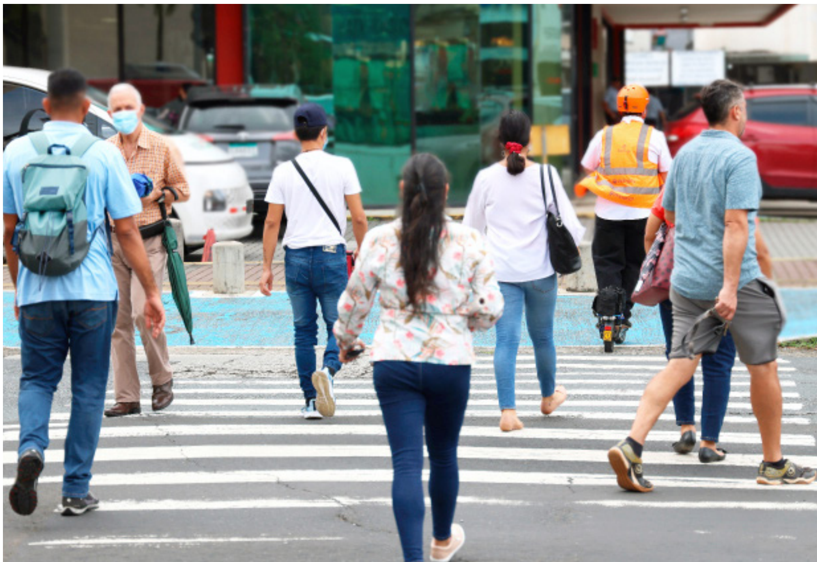
Solo el año pasado se revisaron aproximadamente 300 protocolos de investigación en la Universidad de Panamá.