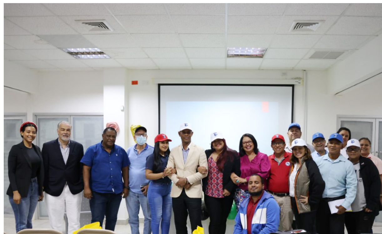
Miembros del Semanario La Universidad y enlaces de comunicación de los centros regionales universitarios conmemoraron el Día del Periodista.