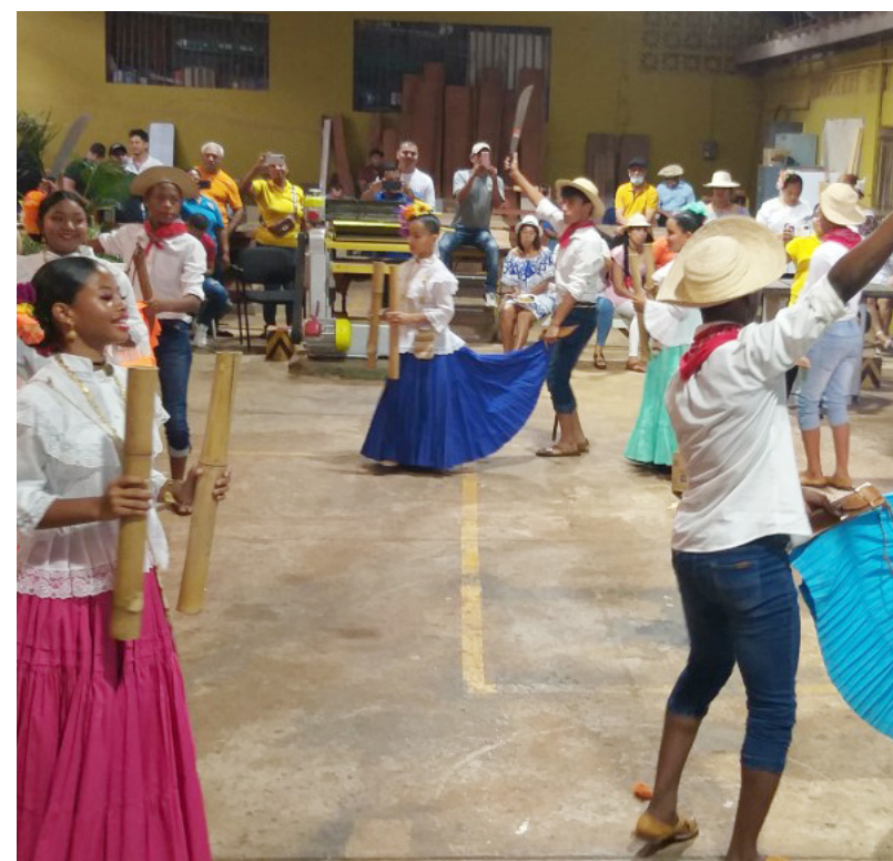
Presentación del Colegio Centro Educativo Marie Poussepin.

Link para inscripciones: https://forms.gle/xVeoYAK3GfQuyRoCA