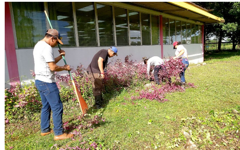
Estudiantes del IPT Abel Tapiero Miranda realizan práctica en la FCA.