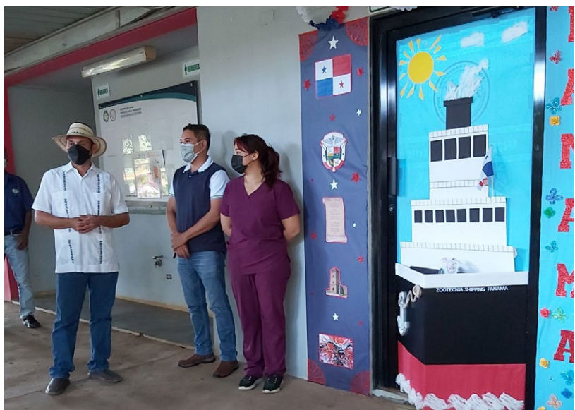
Primer Lugar, Departamento de Zootecnia.