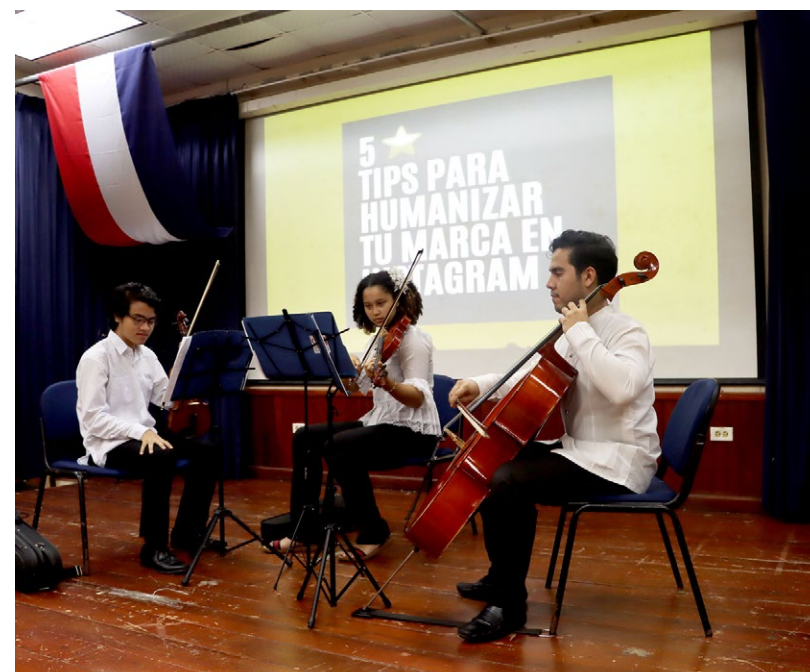
Orquesta de Cámara del Istmo.

Explicó que los estudiantes imaginan a la facultad como una totuma (vasija hecha de calabazo), que por muy alto o separado que se intente poner un objeto, este rueda al fondo y se mezcla con los otros. En la facultad estudian jóvenes con grandes habilidades y destrezas, que se han reunido para trabajar con un solo fin, el concepto de la totuma, argumentó.