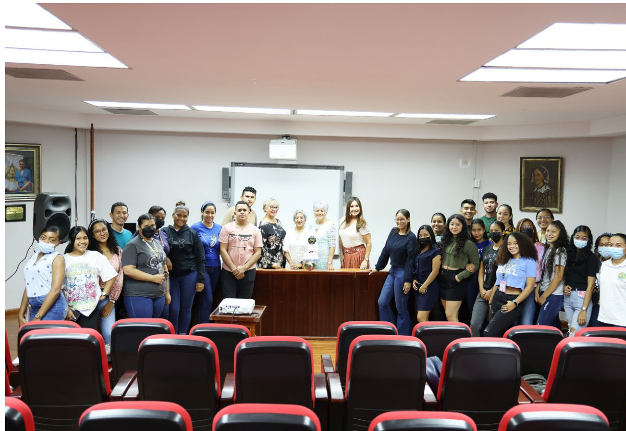
Miembros de la Red ENSI y estudiantes de Enfermería.

la Facultad de Enfermería de la Universidad de Panamá, el Departamento Materno Infantil y estudiante de la maestría en Pediatría.