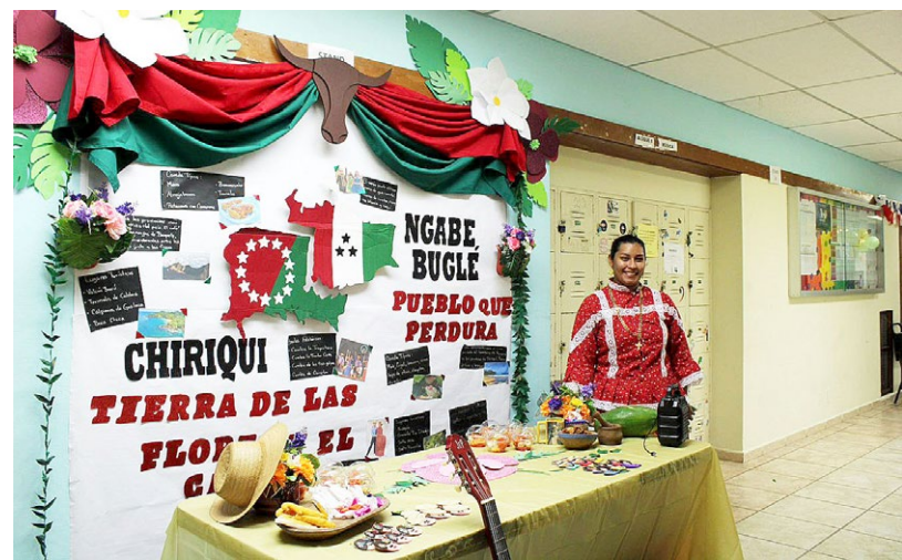
Distintas representaciones folclóricas de todo el país fueron expuestas por los estudiantes resaltando las tradiciones.