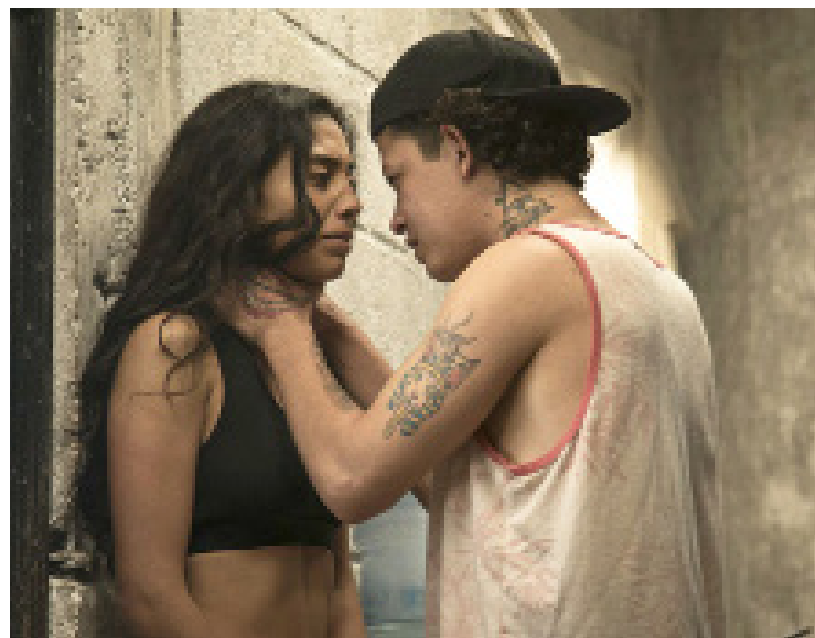
Escena del largometraje.