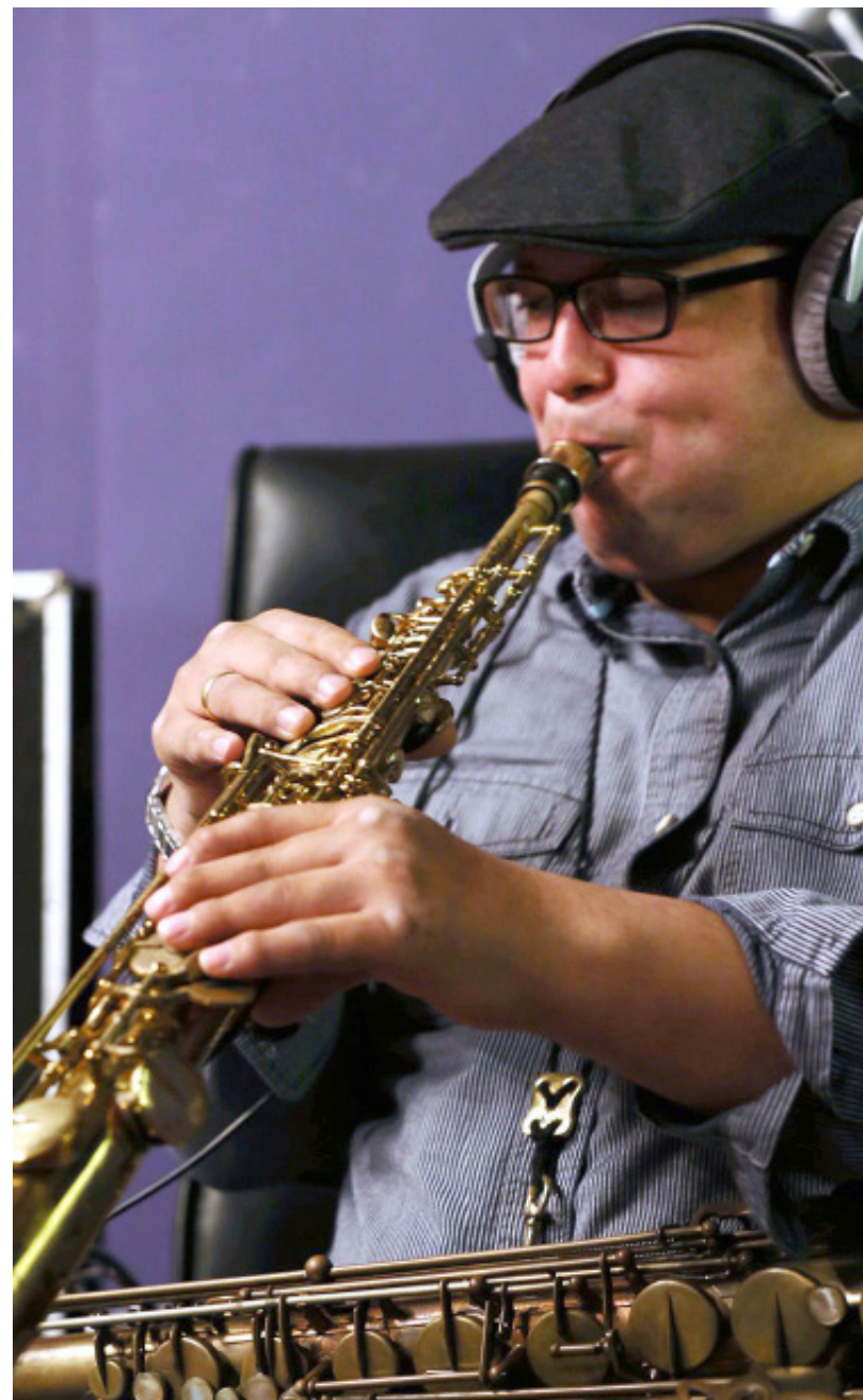
La programación incluye talleres de música.

Para mayor información comunicarse al 6667-1379 o escribir a cine.universitario@up.ac.pa Facebook, Twitter, Instagram: @IcaroPanama / www.icaropanama.com