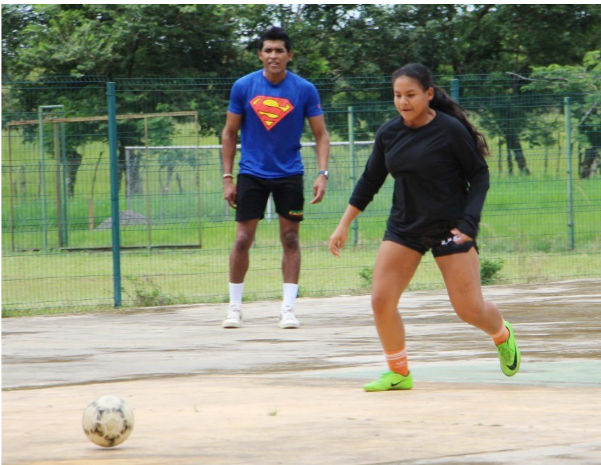
Encuentro de futsal en la FCA, sede Chiriquí.