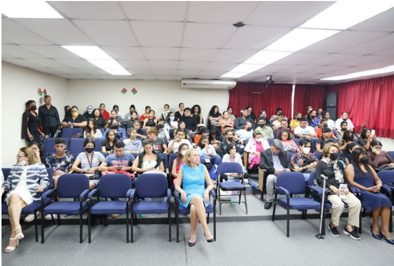
Autoridades universitarias, docentes, estudiantes, administrativos e invitados especiales.