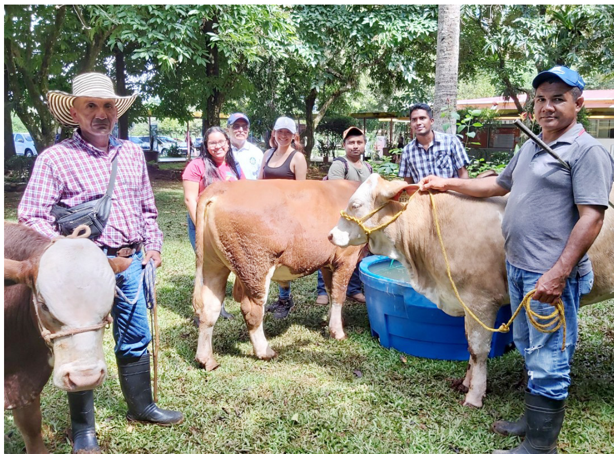
Lote genético de la FCA.

En la Feria de Azuero por ser más comercial, se lleva excelente calidad genética, se hace una subasta, pero todo se vende.