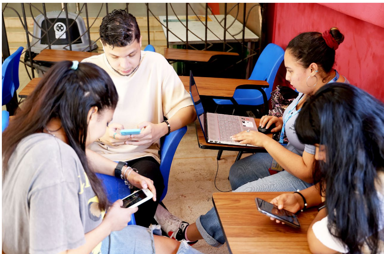
Influencia de las tecnologías en los jóvenes.

No es extraño que los jóvenes expresen un vacío en el conocimiento de su historia real, porque le impusieron la historia de los vencedores, pero no la de los vencidos.