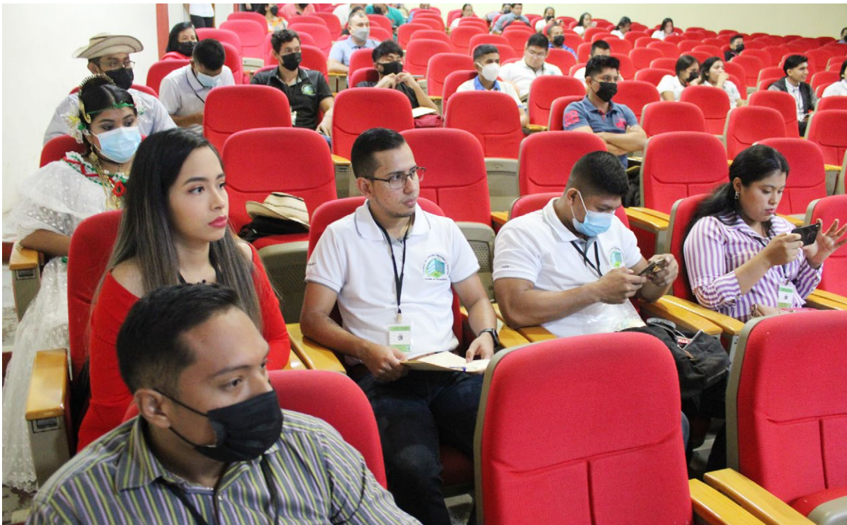
Estudiantes de la Escuela de Matemática del CRU de Veraguas.