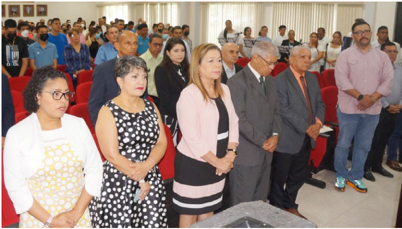
Familia del CRU de Los Santos celebró con misa de acción de gracias 36 años de fundación.