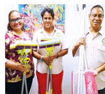
Personal de la Dirección de Cultura recibe implementos de limpieza.