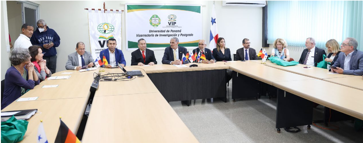
Autoridades universitarias intercambian impresiones con representantes del Gupo Baviera de Alemania.