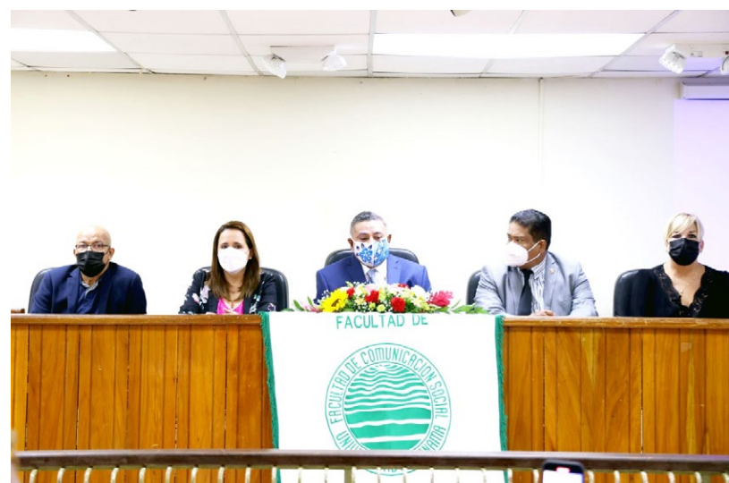
Apertura del Programa de Doctorado en Comunicación Social.

También, a los padrinos del doctorado en Comunicación Social y a todos los estudiantes, docentes y administrativos que durante 5 años le dieron su respaldo.