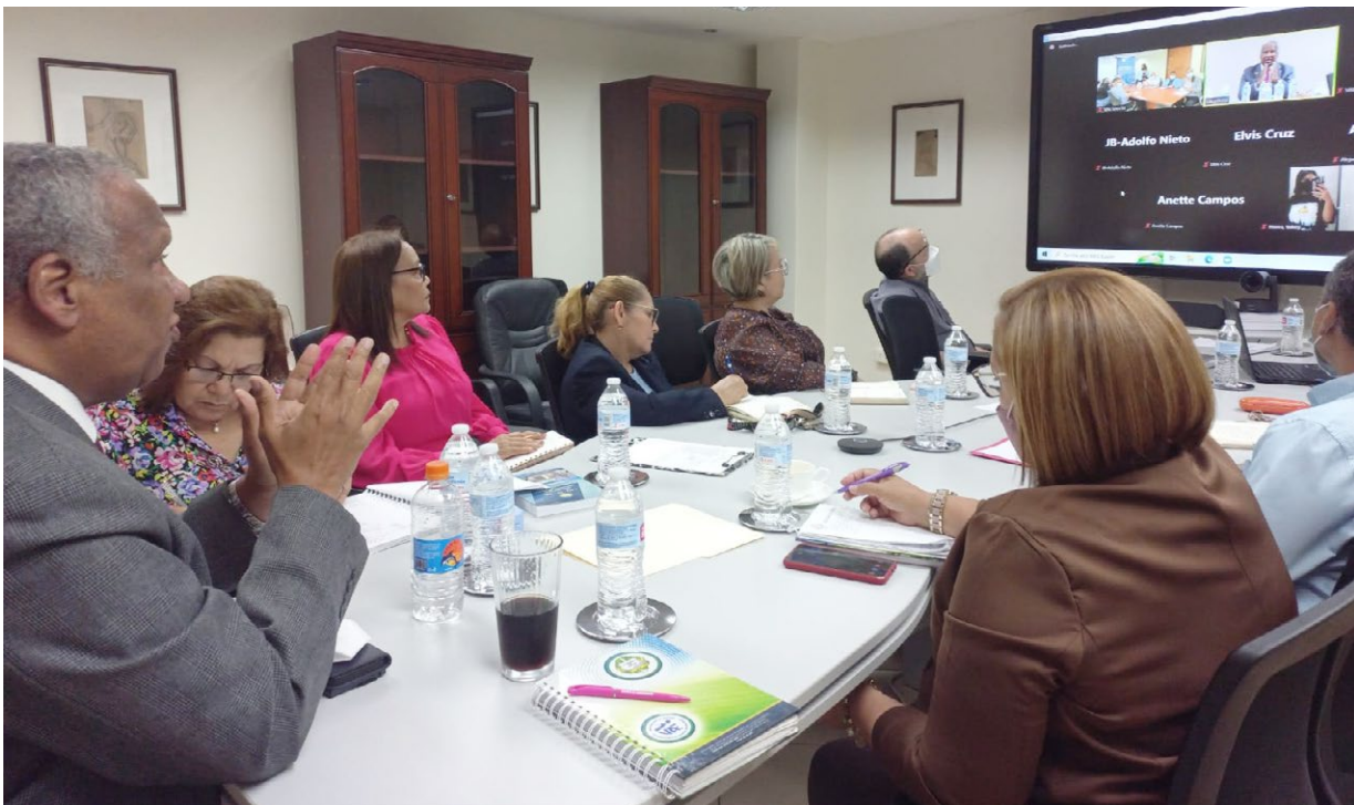
Autoridades y administrativos participan en conversatorio "La Reacreditación Institucional Una Meta Para Todos".