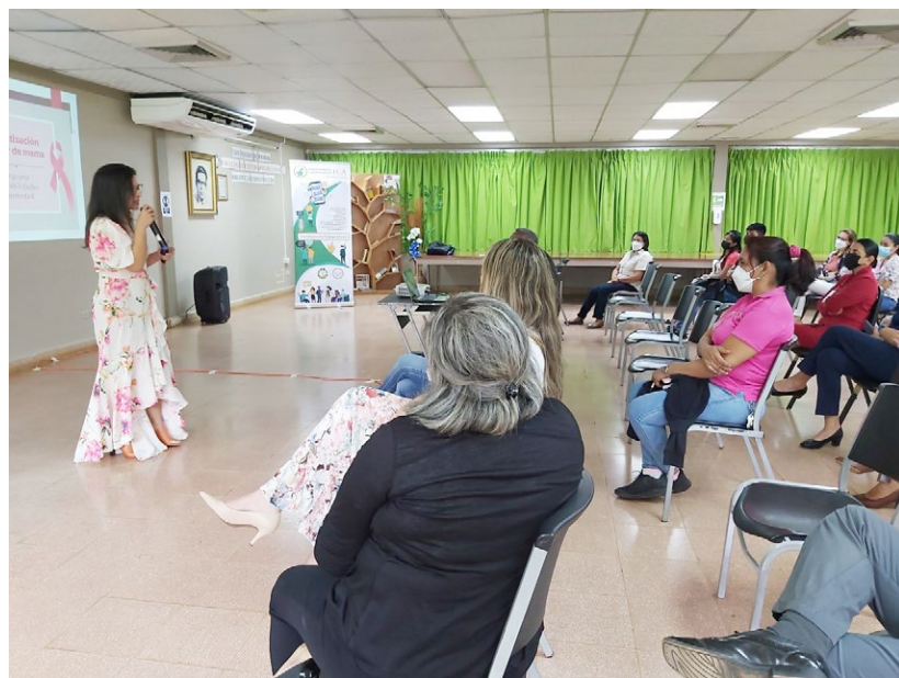
Funcionaria del Hospital Chiriquí en conversatorio en la FCA.