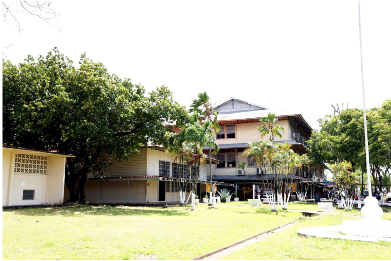
Instalaciones del Centro Regional Univeritario de Colón.