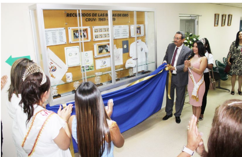
Develación de vitrina Cruv.