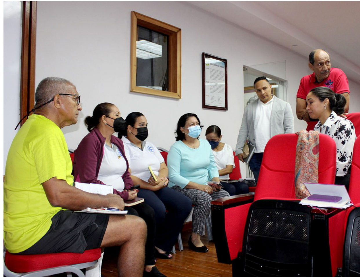
Público presente en el Conversatorio de Sensibilización.