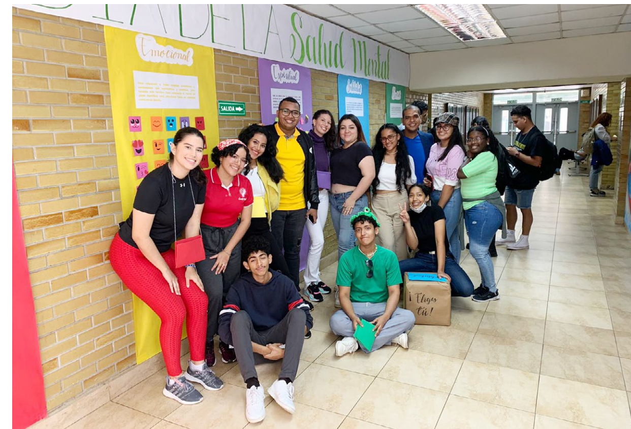
Estudiantes de Psicología promueven la salud mental en el campus Harmodio Arias Madrid.