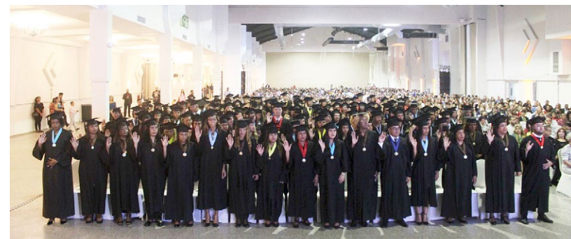
Nuevos egresados del Crusam hacen su juramentación como profesionales de diversas ramas del saber.