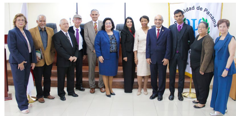
Autoridades y docentes de la Universidad de Panamá durante el evento realizado en la facultad.