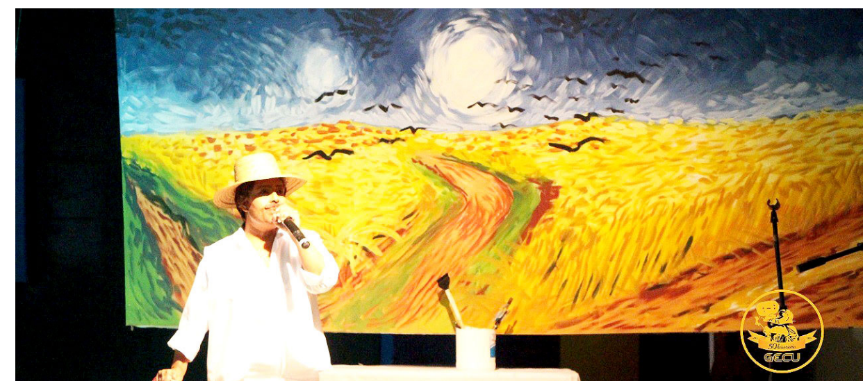
Actividad de celebración de 50 aniversario de GAMA.

El festival se presentará hasta el martes 1° de noviembre, en funciones gratuitas, principalmente en horarios de 5 y 7 p.m., con películas de largo y cortometraje de todos los países de Centroamérica y una selección de filmes invitados de Argentina, España y México. Incluirá actividades complementarias de formación y capacitación sin costo. Para mayor información llamar al 6667-1379 o escribir a cine.universitario@up.ac.pa Facebook, Twitter, Instagram: @IcaroPanama / www.icaropanama.com