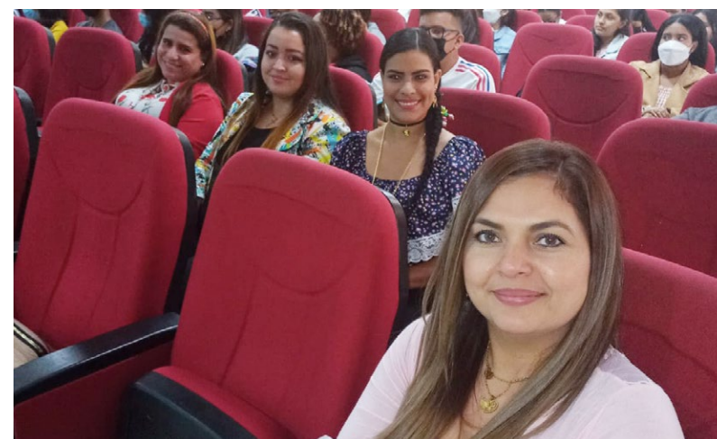
Estudiantes de las escuelas de turismo participaron de las actividades académicas y culturales.