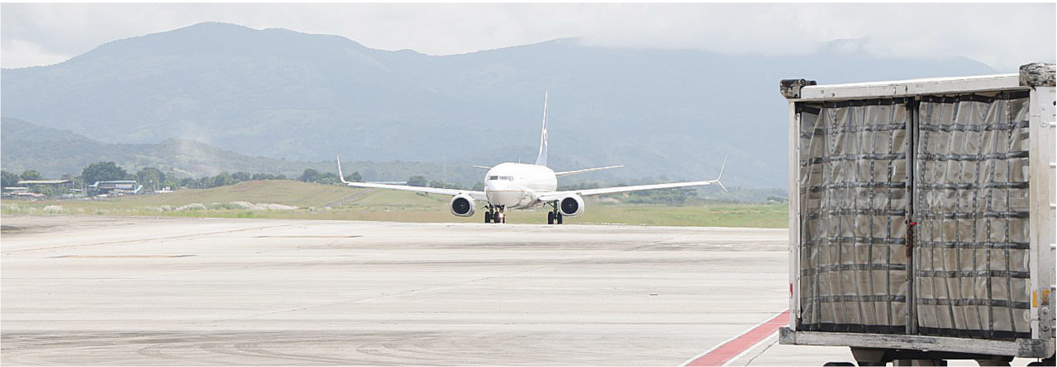
Avión en la pista del Aeropuerto Internacional de Tocumen.