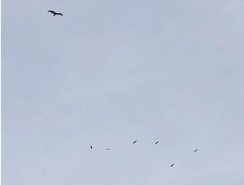
Aves de rapiña volando sobre la terminal de Tocumen.