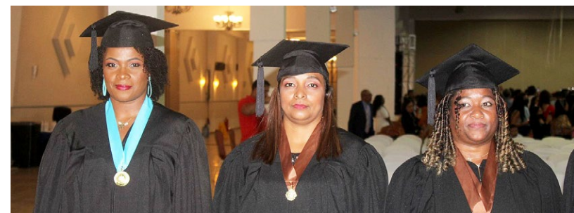
Estudiantes del Capítulo de Honor Sigma Lambda de la UP.