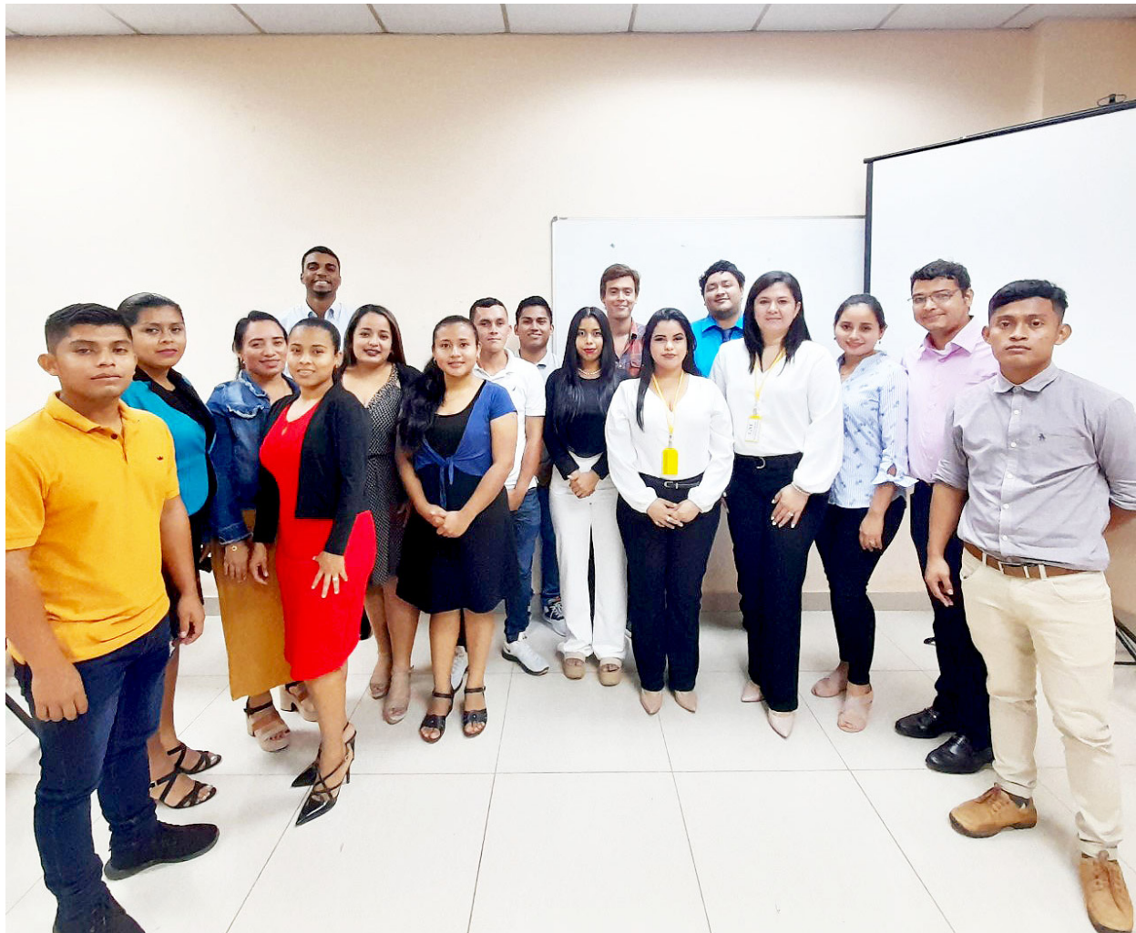
Grupo de estudiantes del Cruv.

En total presentaron 10 proyectos innovadores del sector servicios y producción. Entre algunos se mencionan: “Plan de negocios para la creación de un vivero forestal de plantas nativas maderables para preservar el ambiente,