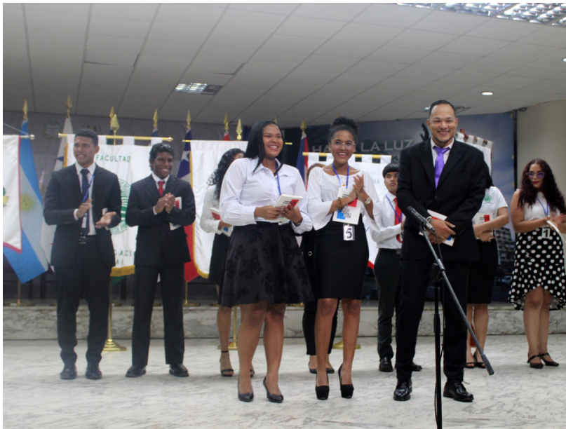
Ganadores del Concurso de Oratoria 2022, organizado por la VAE.