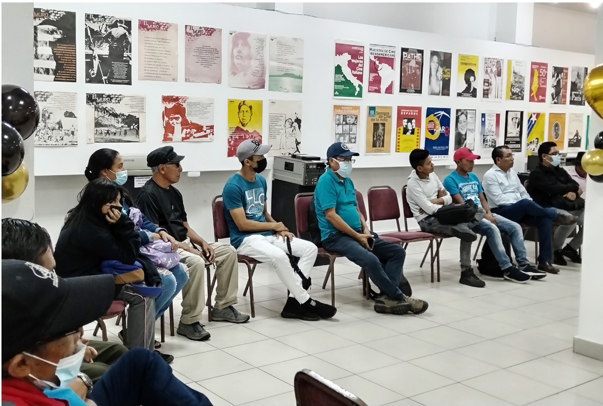
Grupos originarios celebran X aniversario de la Opinup.