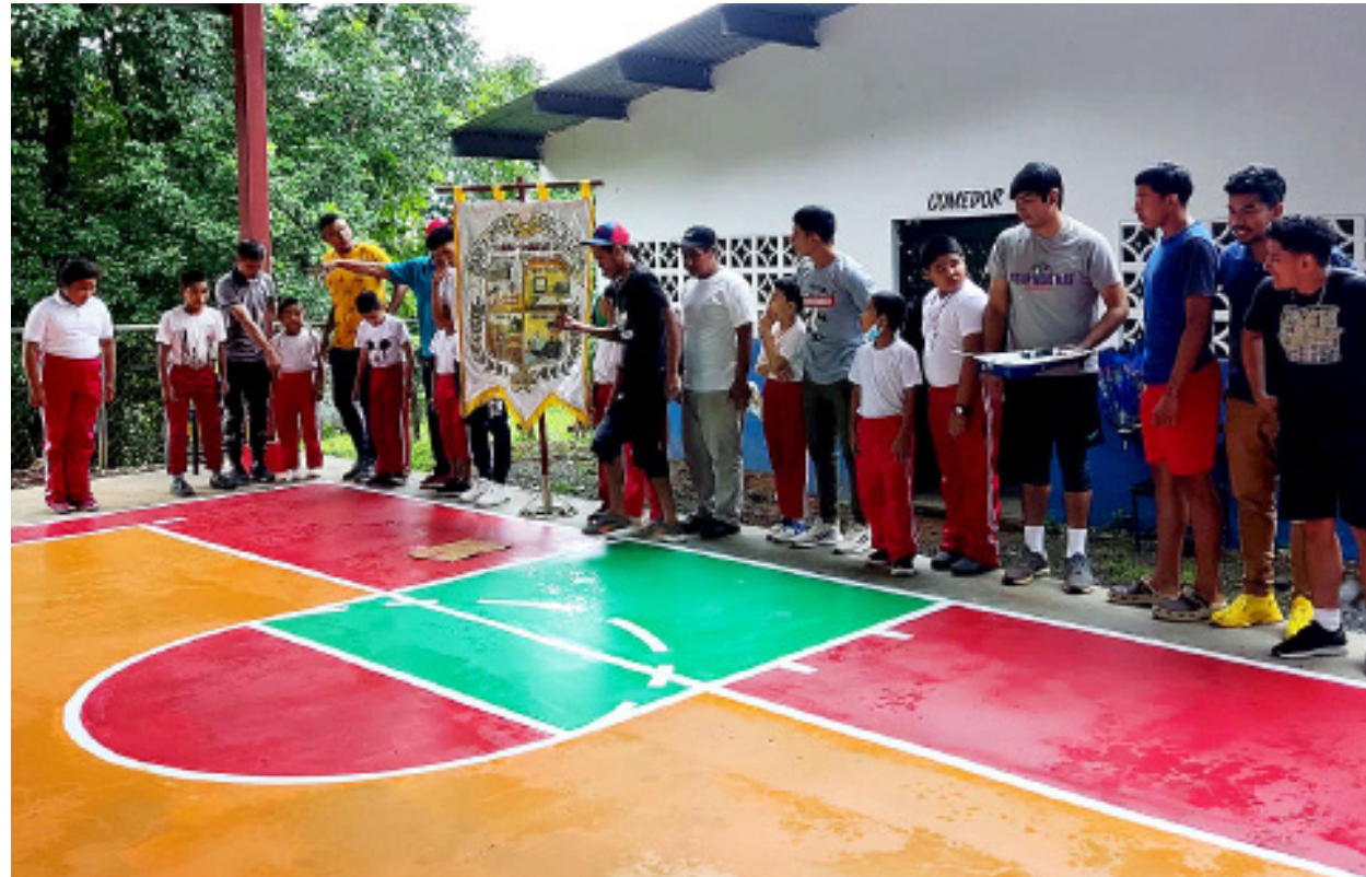
Estudiantes de la escuela asistida por el Cruv durante la referida actividad.