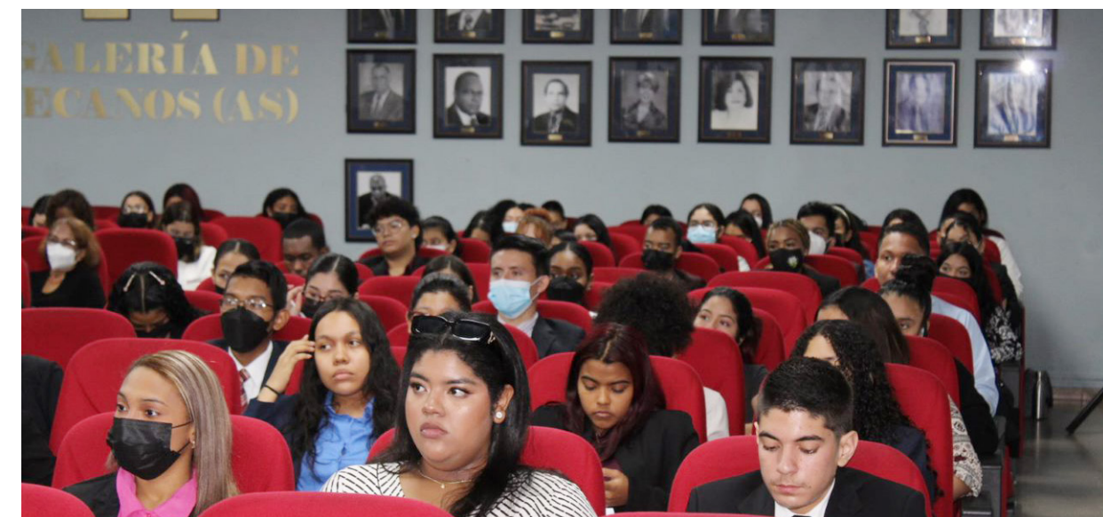
Estudiantes que asistieron al seminario taller para afianzar conocimientos teóricos.