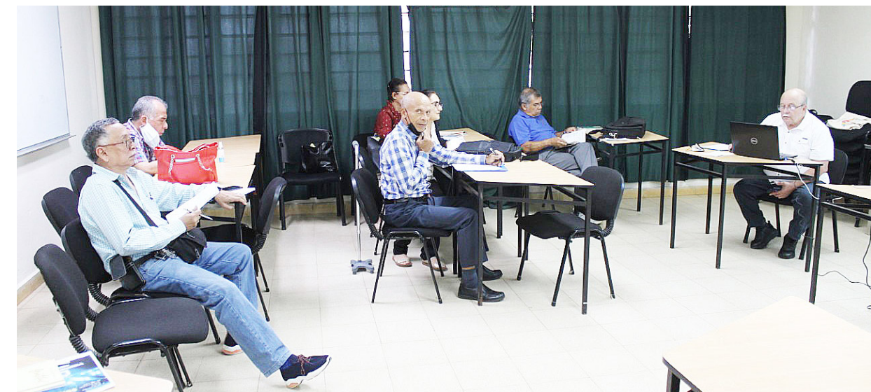
Mesa de trabajo de la Comisión Especial de Atención de la Cuenca Hidrográfica del Río Santa María Cruv.