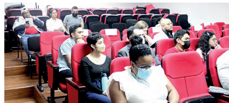
Participantes de reunión organizada por la VAE.