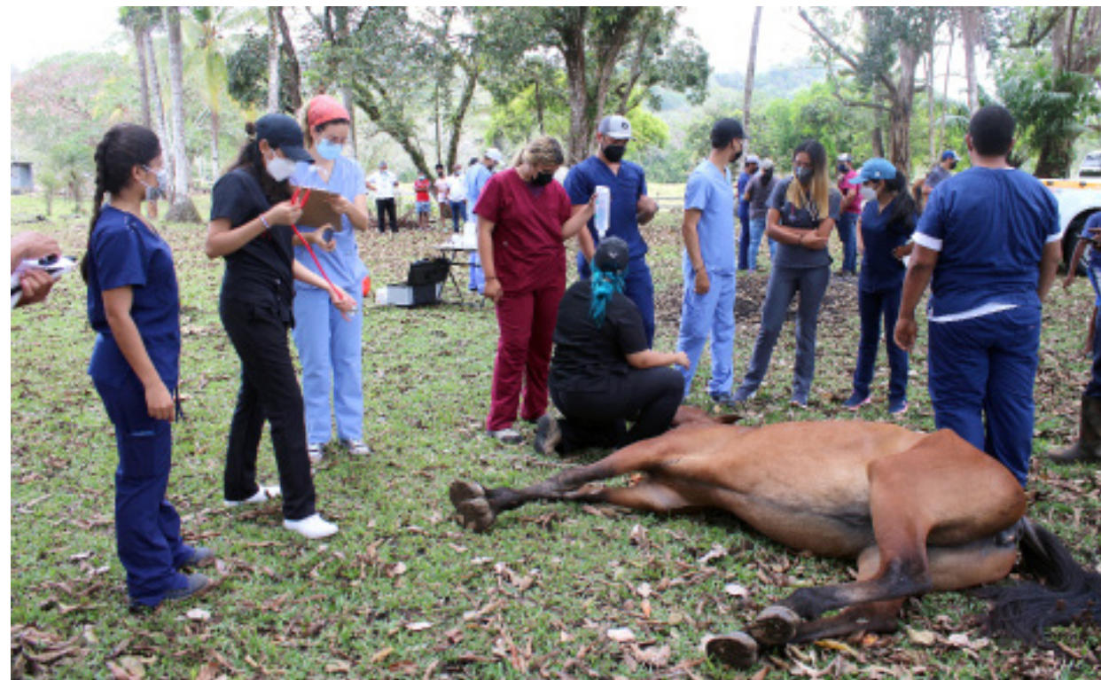
Estudiantes de la Facultad de Medicina Veterinaria aplican venoclisis a un equino durante un día de campo.