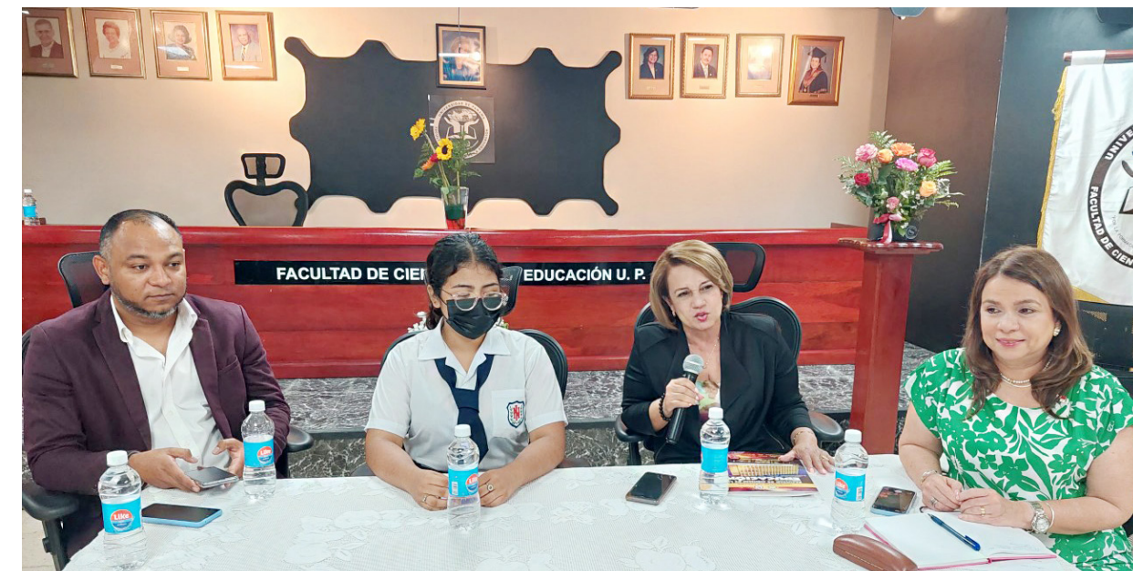
Autoridades del Meduca y de la Universidad de Panamá y dirigente estudiantil.