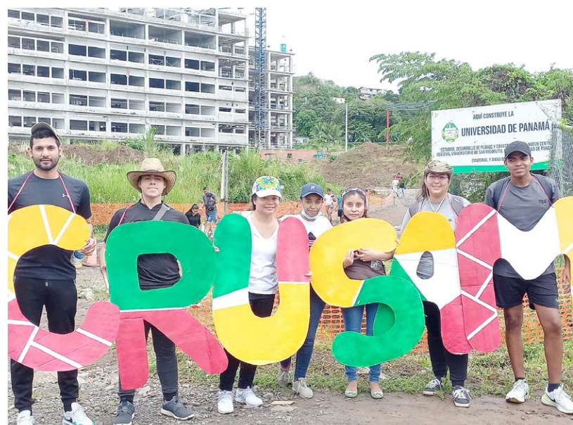
Estudiantes del Crusam participan de la caminata hacia la sede en construcción.