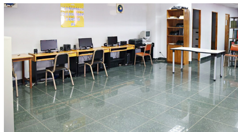
Sala Braille de la Biblioteca Interamericana Simón Bolívar.