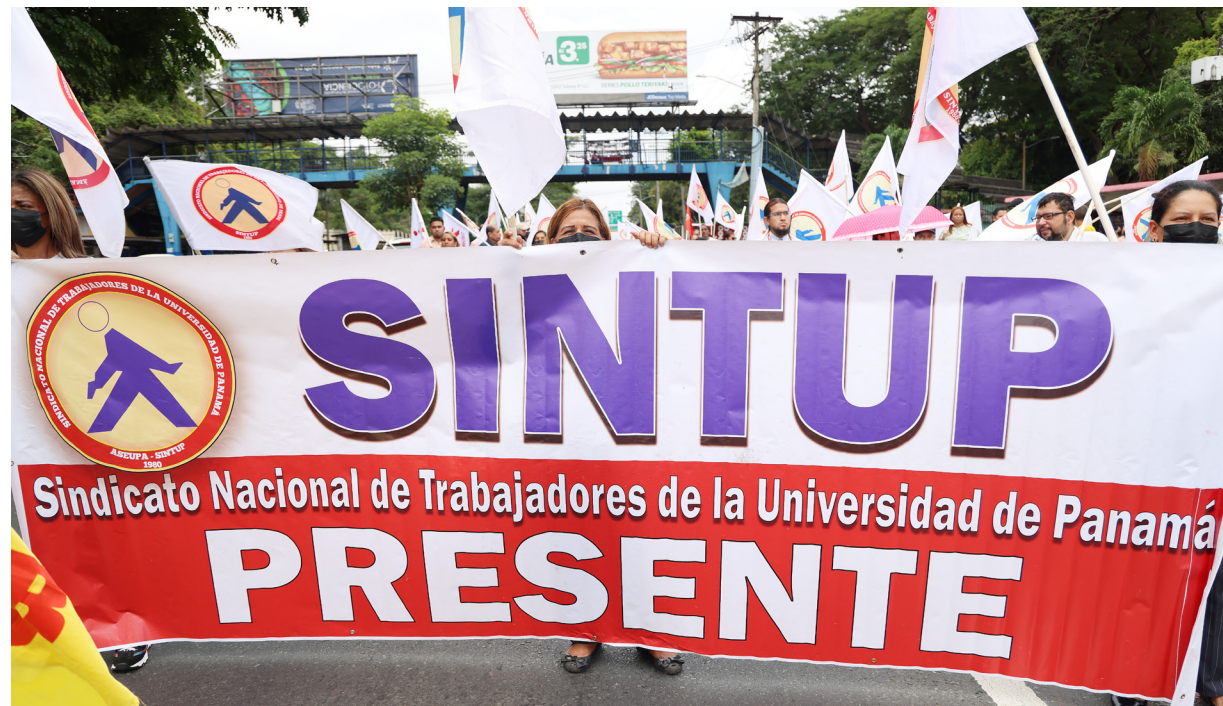
Manifestación en la vía Transistmica.