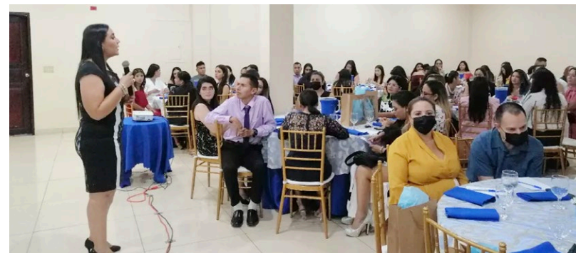
Autoridades del CRU de Azuero y expositoras.