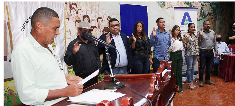
Juramentación de juntas de planificación municipal.