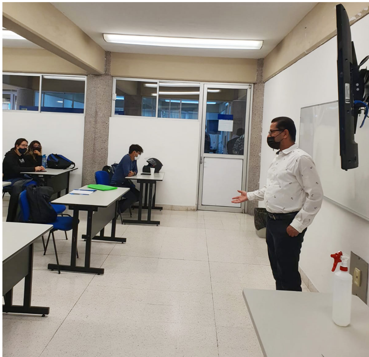
Presentación de la conferencia institucionalidad extractivistas en la Universidad Autónoma de San Luis Potosí.