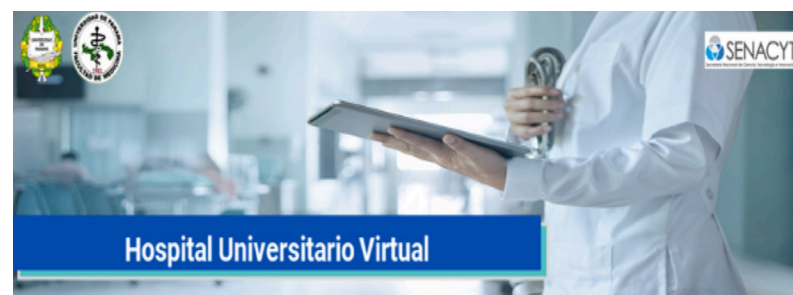
Página Virtual de la Facultad de Medicina.

separadas, lo cual facilitaría el extractivismo minero y energético y operaría de manera más responsable.