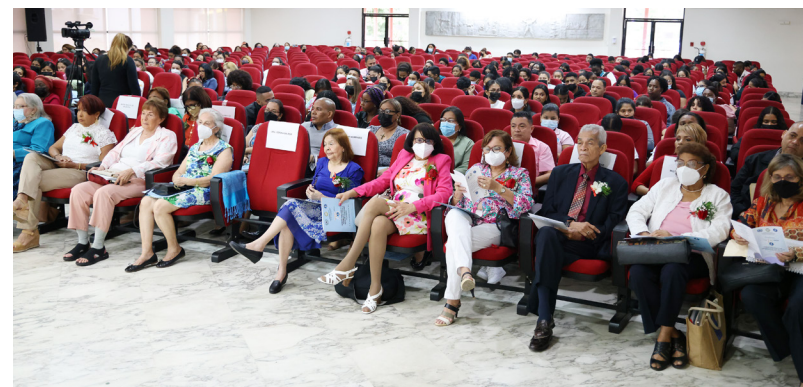
Galardonados, invitados especiales y asistentes a la inauguración del aniversario de la Escuela de Trabajo Social.

profesores que han dejado un legado, como directores del departamento y la escuela de Trabajo Social.