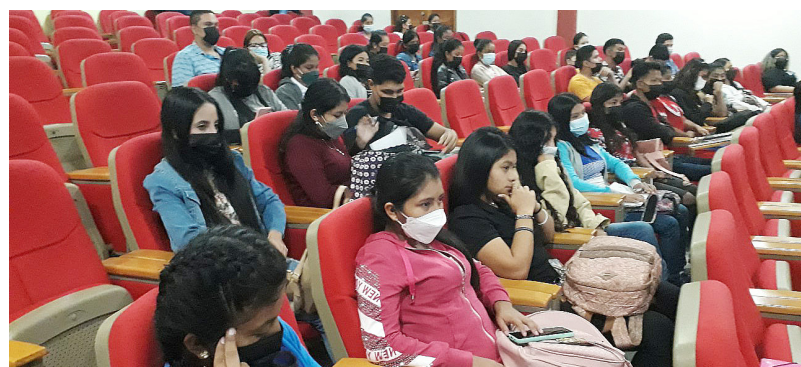
Asistencia al VI Festival Internacional de Cine Foro, Cruv.