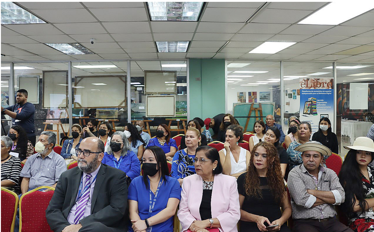
Asistentes al conversatorio en la sala RAI de la Biblioteca Interamericana Simón Bolívar.