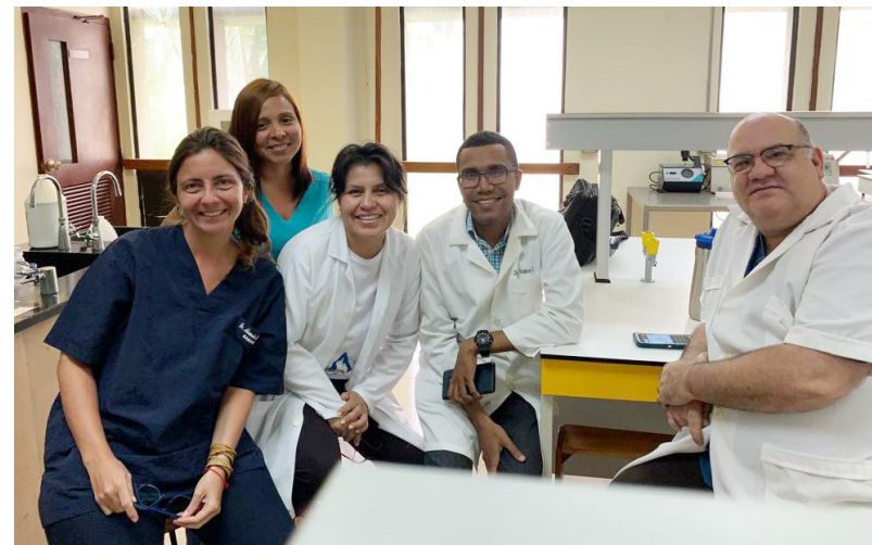
Miembros del Comité de Ética de la Investigación y el Bienestar de los Animales de la Universidad de Panamá.

Especies que invaden el país afectan el medioambiente y la salud