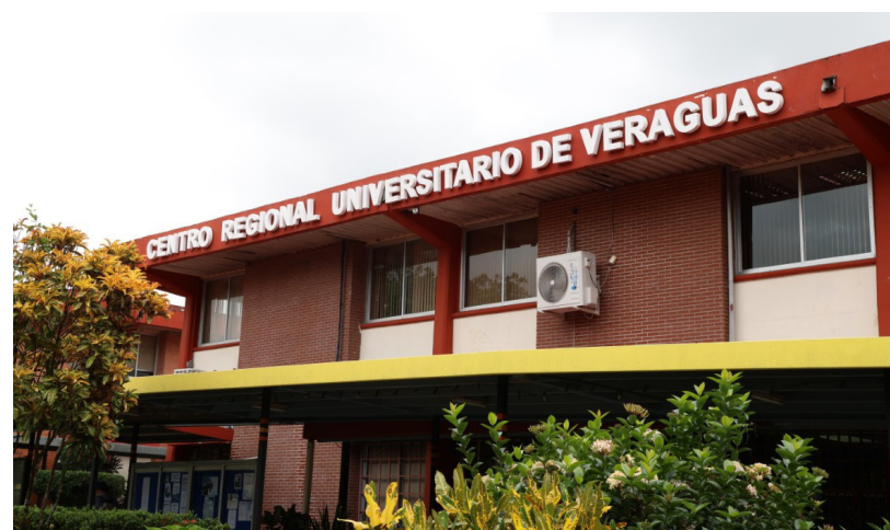
Centro Regional Universitario de Veraguas.

El proyecto inició en 2020 y terminó a mediados de 2022. Tiene una extensión de 215 páginas. Recibió apoyo mediante una beca de 2 mil 500 dólares , otorgada por la Vicerrectoría de Investigación y Postgrado.