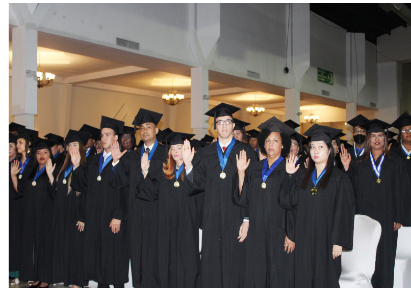
Juramentación de Fe por los nuevos profesionales.