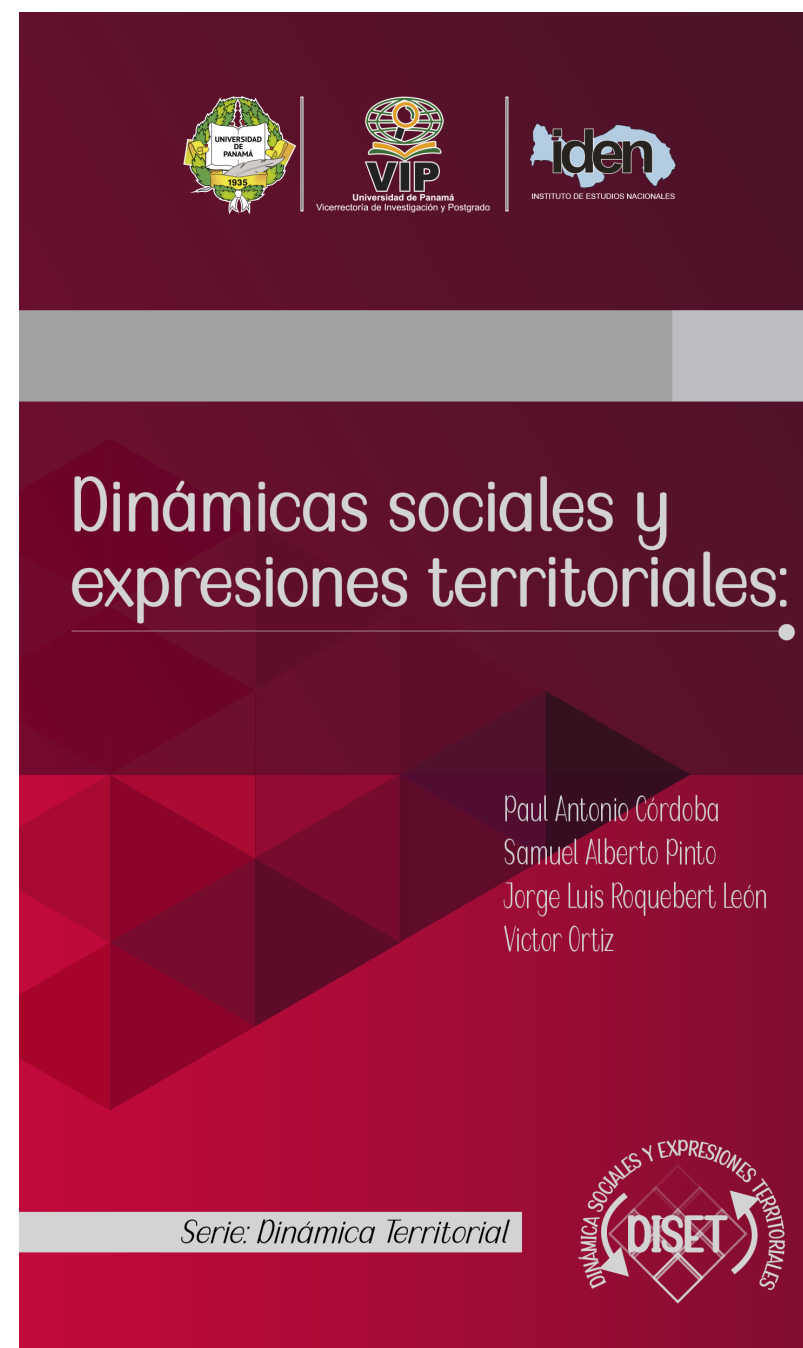
Portada del libro.

Participaron, el Centro de Capacitación, Investigación y Monitoreo de la Biodiversidad – COIBA (CCIMBIO) del Centro Regional Universitario de Veraguas y la Senacyt.