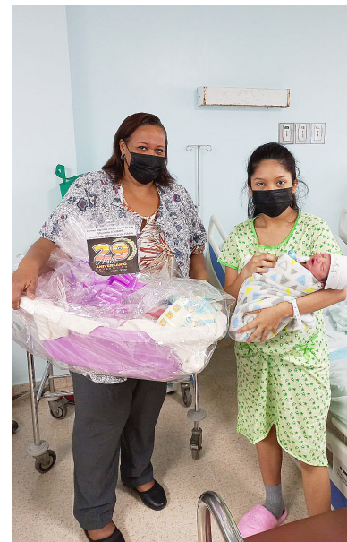
Madre de recién nacido recibe canastilla con productos para bebé.