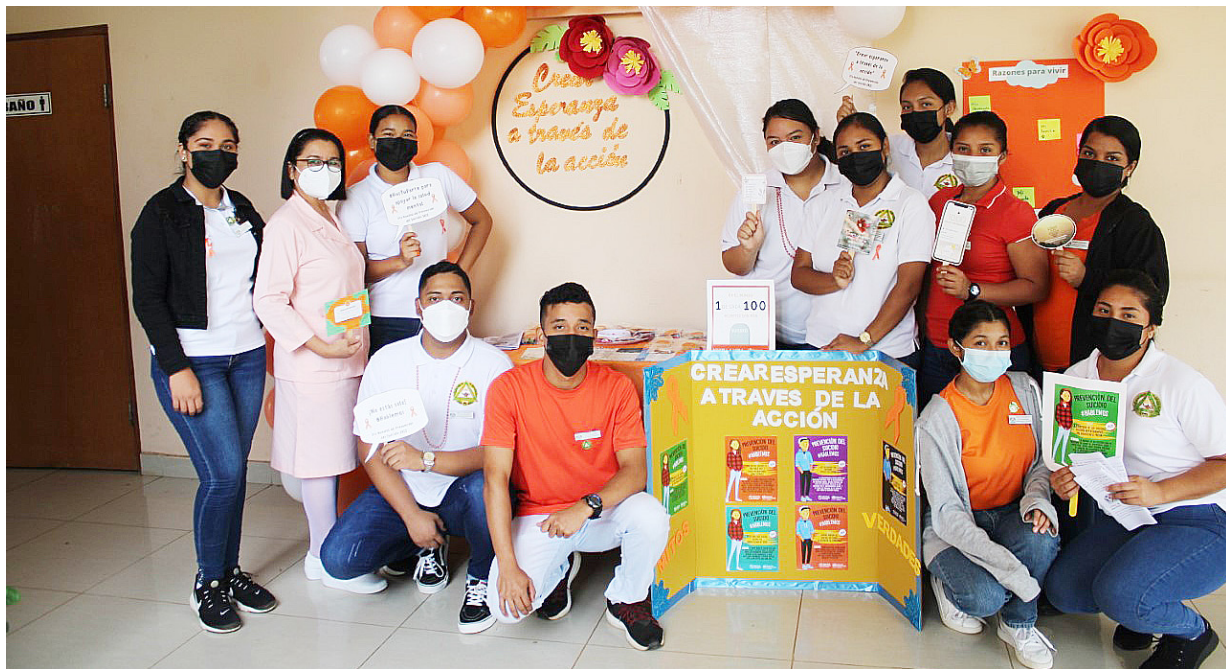
Grupo de estudiantes de tercer año de enfermería promocionan prevención del suicidio.