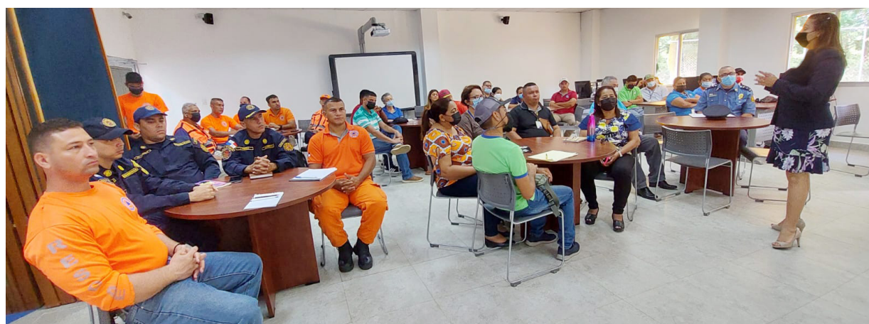
Participantes del Sistema de Protección Civil de Herrera y Los Santos, Benemérito Cuerpo de Bomberos de la Villa de Los Santos, CRU de Los Santos y Crua.