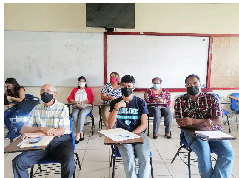
Jurados y comisión organizadora.