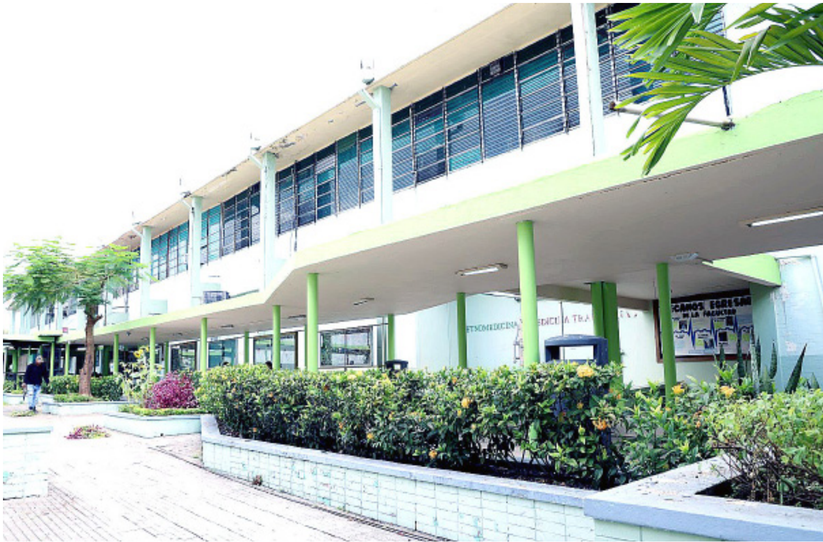
Marquesina renovada de la Facultad de Medicina.