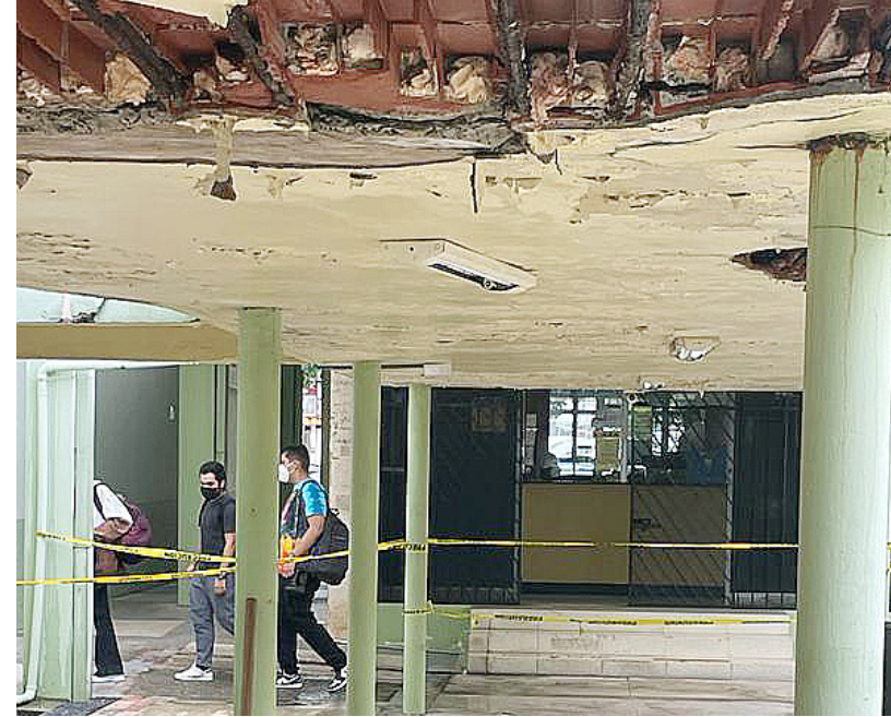
Condición previa a la reparación de la marquesina de la Facultad de Medicina.

Ante esta situación las autoridades superiores comprendieron que necesitaban una oficina funcional