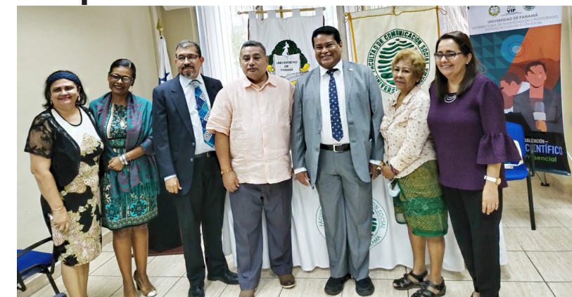
Autoridades universitarias participantes durante lanzamiento del curso en Periodismo Científico.