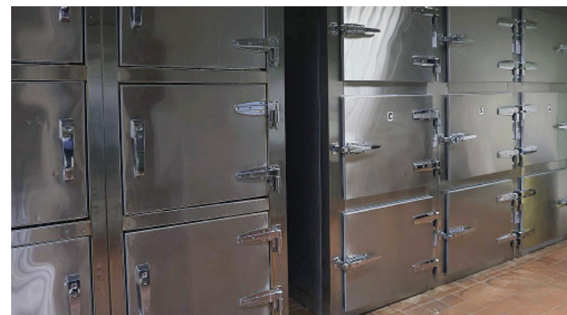
Área de las neveras donde se conservan los cuerpos que se mantienen en la morgue.