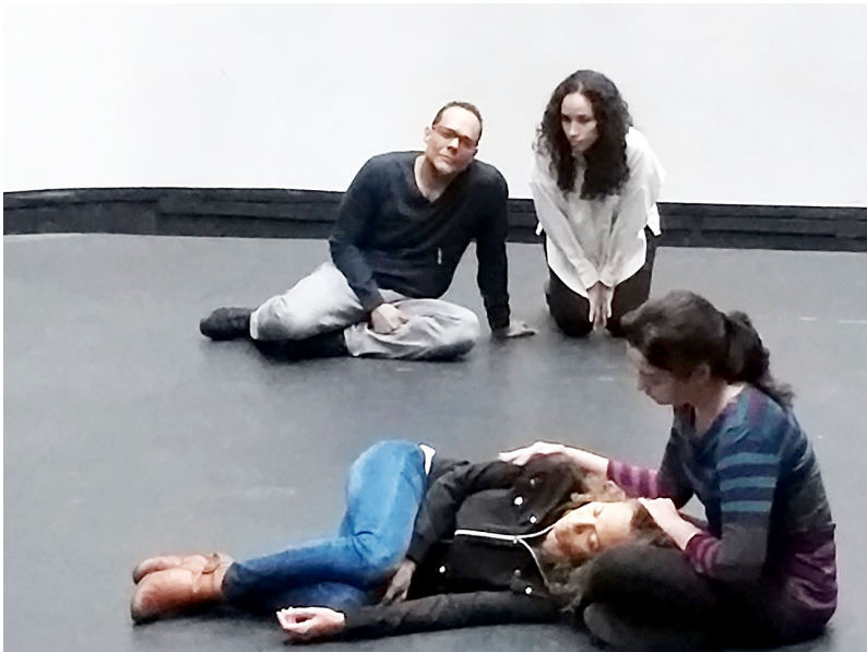
Talleres de teatro, cine y televisión.