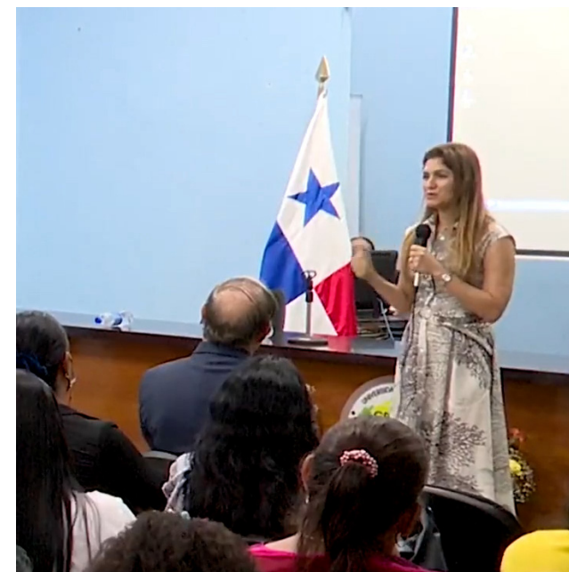
Erika Mouynes, canciller de la República.

La actividad se desarrolló en el marco de la celebración de los 29 años del Crusam.