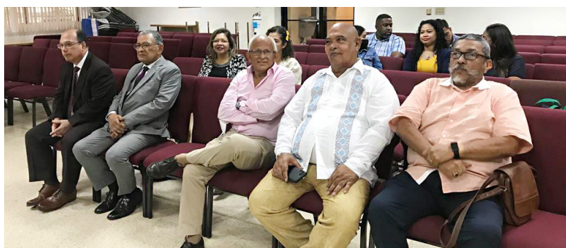
Profesores de la Escuela de Turismo Geográfico Ecológico y de Geografía.

Indicó que los estudiantes podrán desarrollar la capacidad teórica, investigativa, pedagógica, metodológica y con la responsabilidad social,