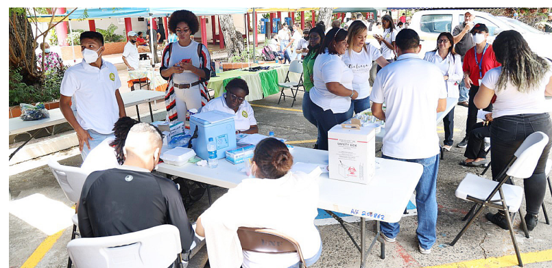
Participantes de la feria aprovechan los beneficios ofrecidos en materia de salubridad.