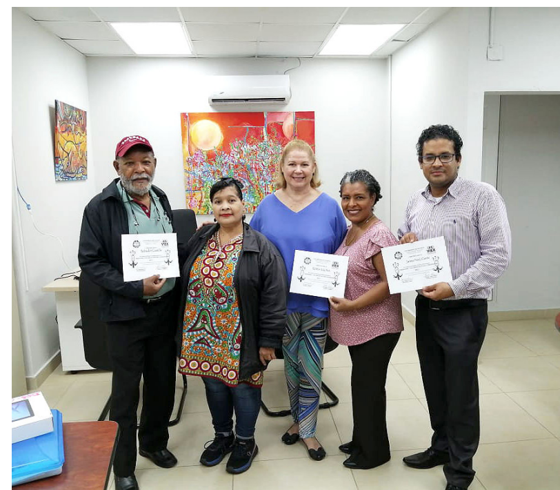
Participantes recibieron un certificado de culminación

El seminario tuvo lugar en la sede de la Galería de Arte Manuel E. Amador.