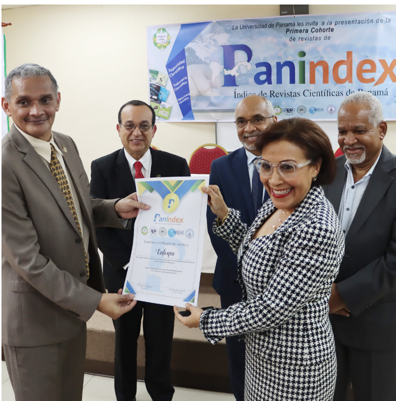
Entrega de certificación a editores de las Revistas Indexadas en Panindex.