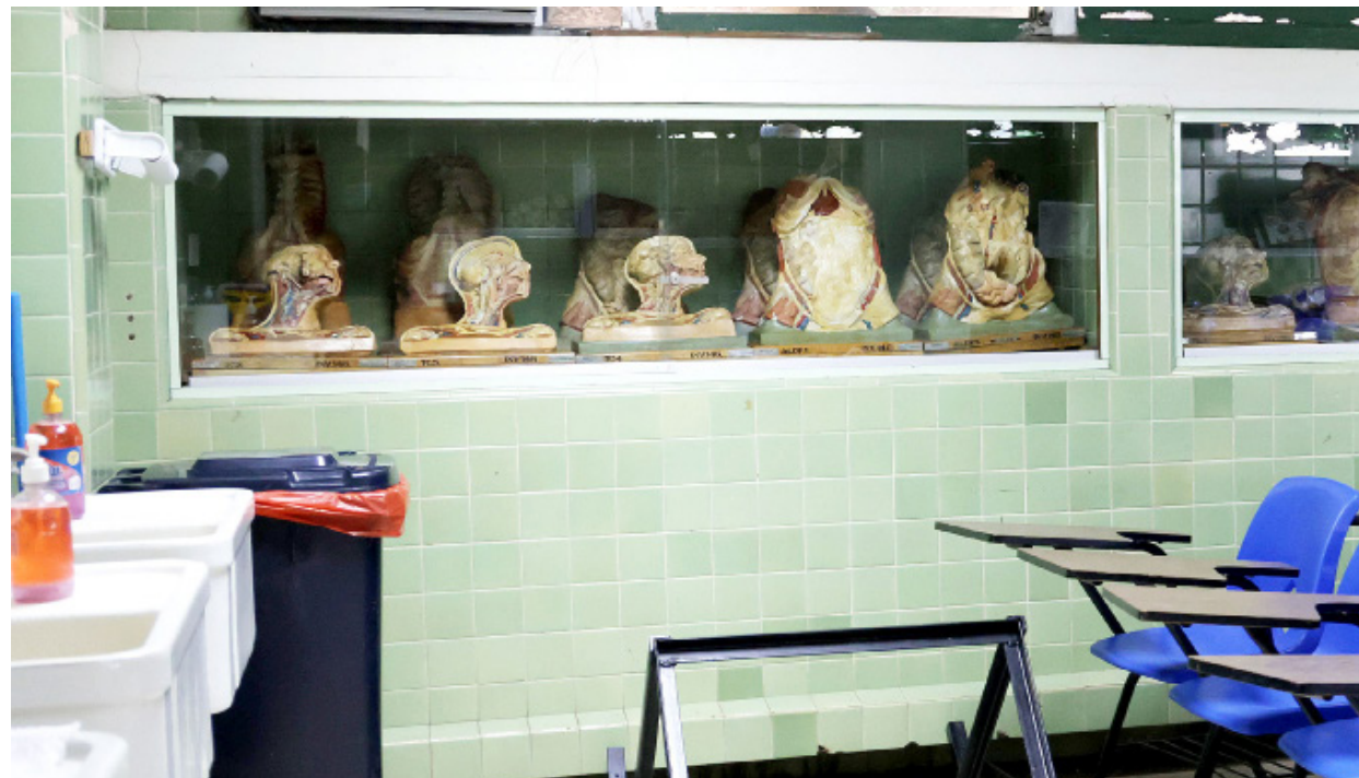
Salón de clases ubicado en la Morgue donde los estudiantes realizan sus prácticas.

Adicional, se tienen 8 cubículos que se emplean para practicar. En torno a tecnología, cuentan con alrededor de 40 computadoras.