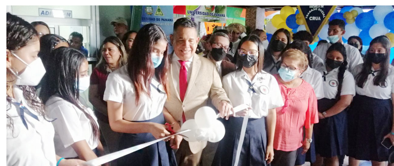
Estudiantes de escuelas secundarias de Azuero en la Promoción de Carreras 2023.