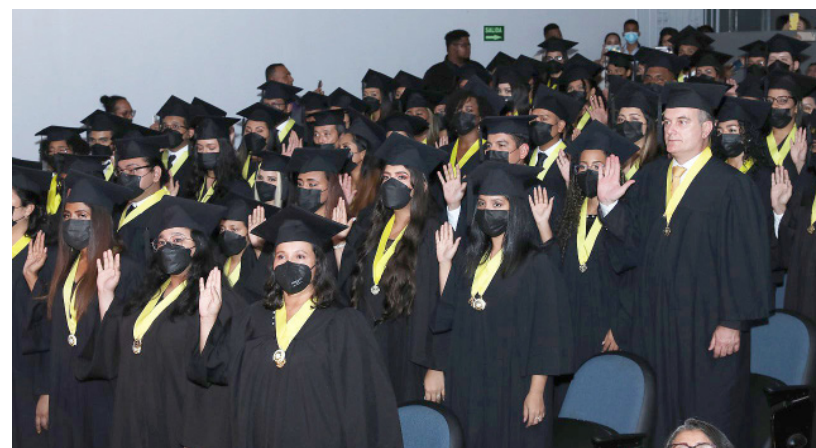
Graduandos realizan su juramentación como profesionales de arquitectura y diseño.

Además, expresó que es la primera graduación que preside como decano, una actividad organizada en un tiempo récord, fue muy bonita después de dos años de ausencia. La universidad está retomando los actos de graduación y la Facultad de Arquitectura y Diseño no se ha quedado atrás, los jóvenes muy motivados, es un éxito para la Primera Casa de Estudios Superiores.