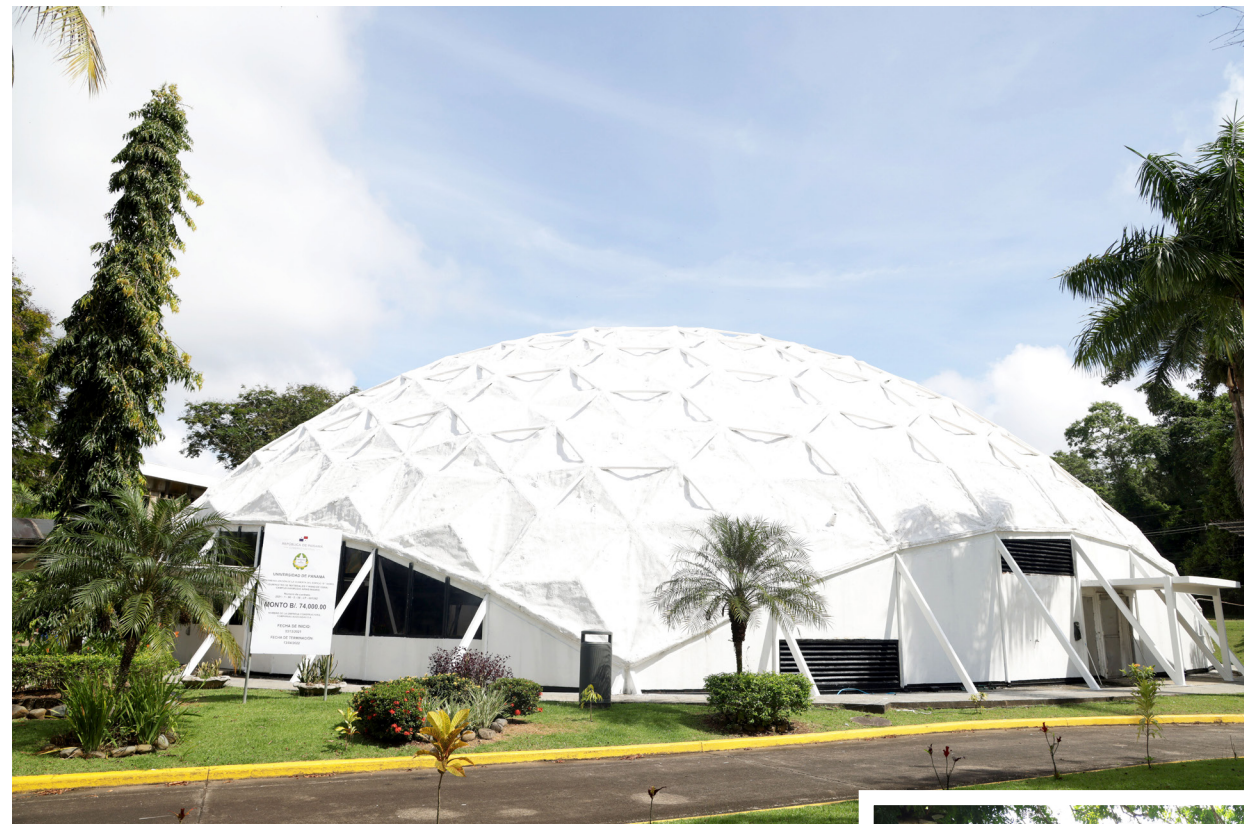
El Domo es una de las instalaciones del Campus de Curundu al que se le han realizado algunas adecuaciones.