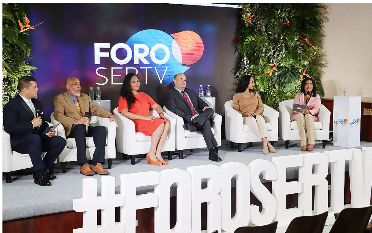
Participantes del foro que se realizó en la Facultad de Comunicación Social para evaluar las fake news (noticias falsas).