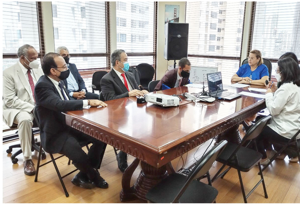
Entrega de documentación ante Coneaupa para el proceso de reacreditación institucional.