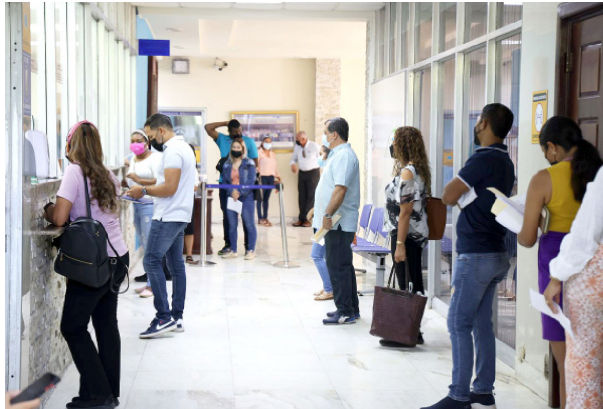
Universitarios tramitan solicitudes de créditos oficiales, pago de diploma y otras certificaciones.

Actualmente, desde la Secretaría General, se proyecta para fines