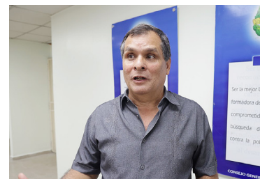
El Dr. Olmedo Beluche expresó que el aspecto negativo que hizo dudar a un sector de la opinión pública antiimperialista es el Tratado o Pacto de Neutralidad.