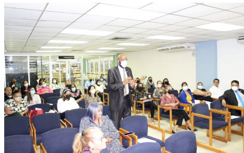
Participantes de la jornada académica.

Todavía no se tiene una cifra del costo del proceso, por ahora solo se han ubicado a 3 empresas con trayectoria. Con 2 de estas compañías se está conversando, confirmó el Secretario General.