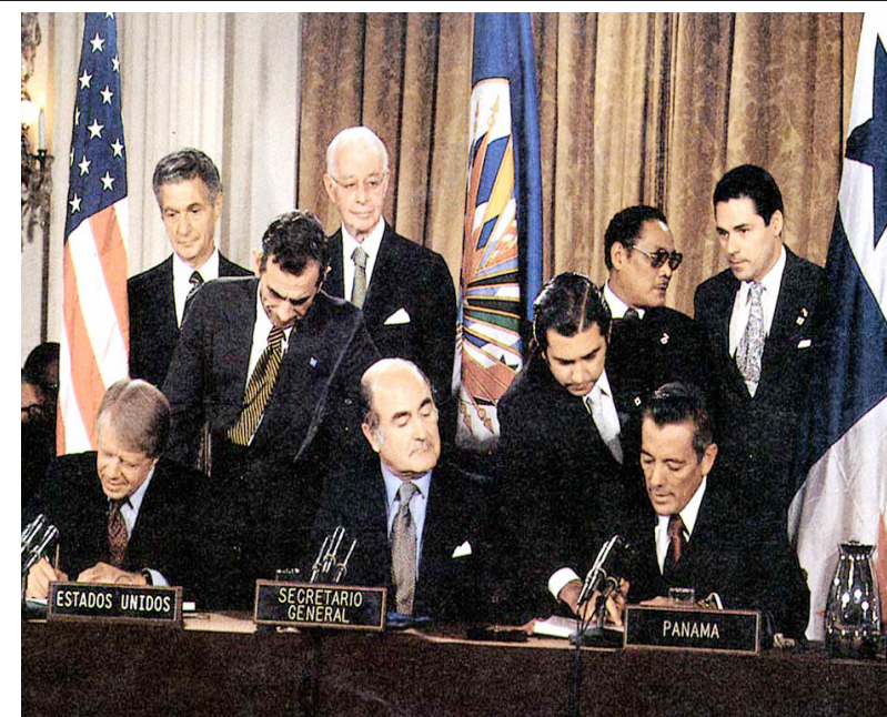
Firma de los tratados el 7 de septiembre 1977 en Washington D. C.

Remozan instalación del Campus Harmodio Arias Madrid