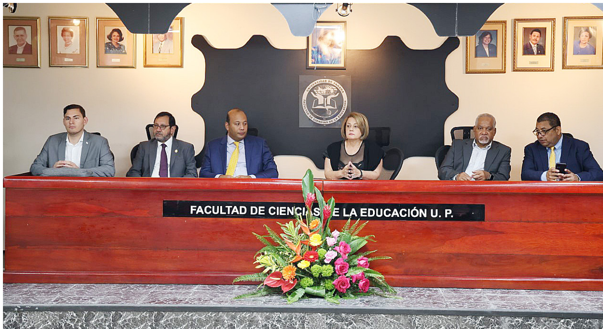
Autoridades e invitados especiales del Encuentro Internacional de Investigaciones Cualitativas en la mesa principal.