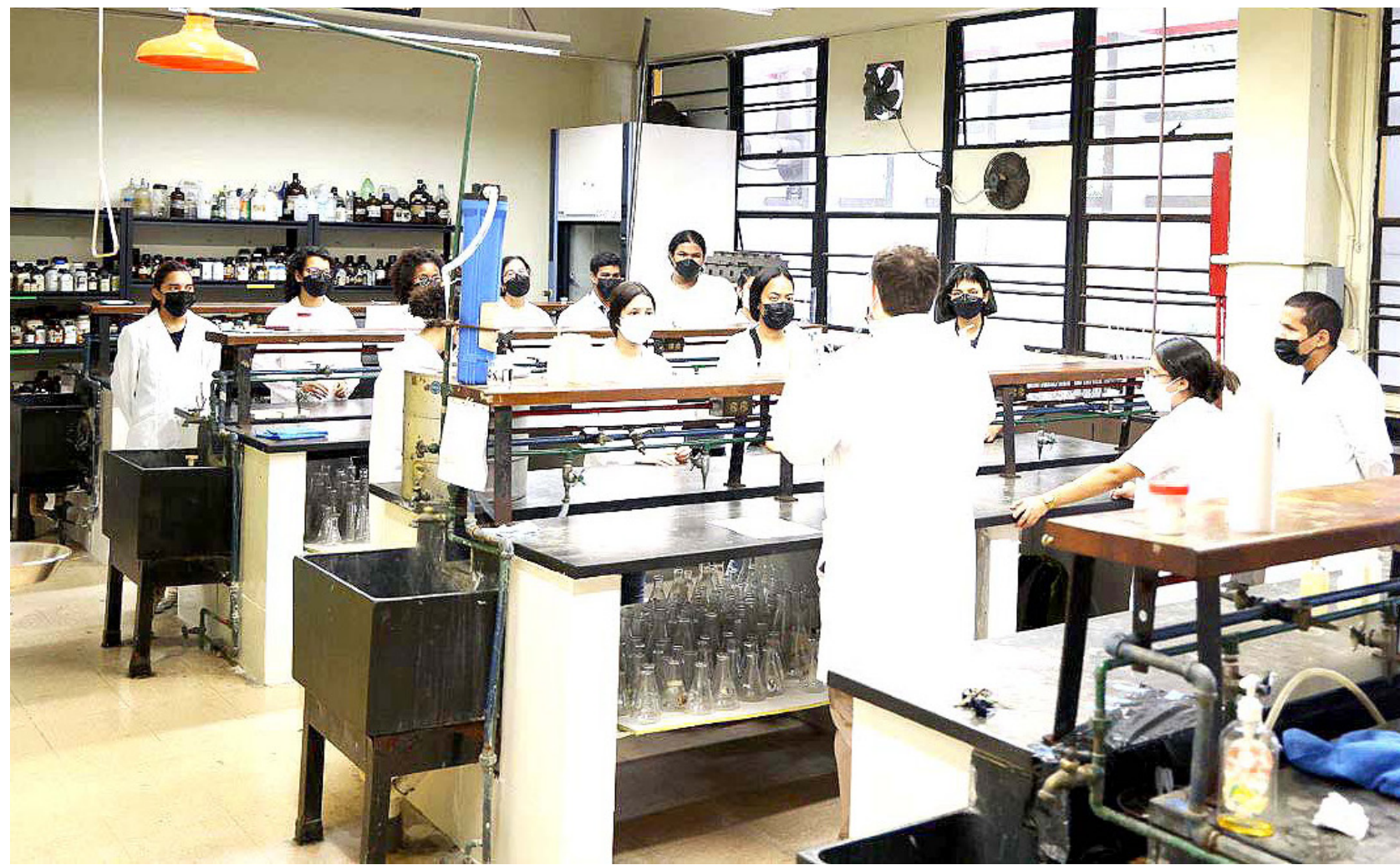
Docente imparte clases en laboratorio de química.