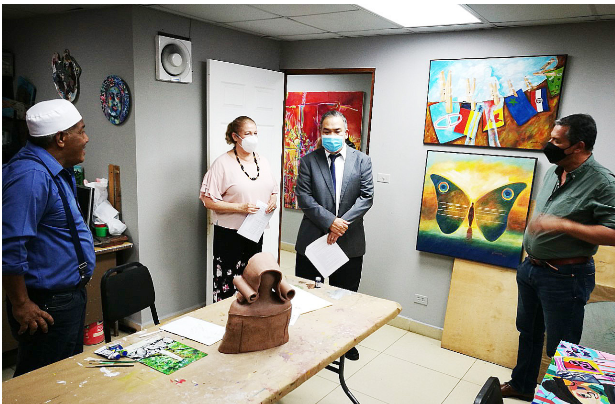
Vicerrector de Extensión en visita a la Dirección de Cultura.