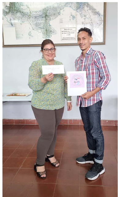
Ganador del concurso recibe premio.