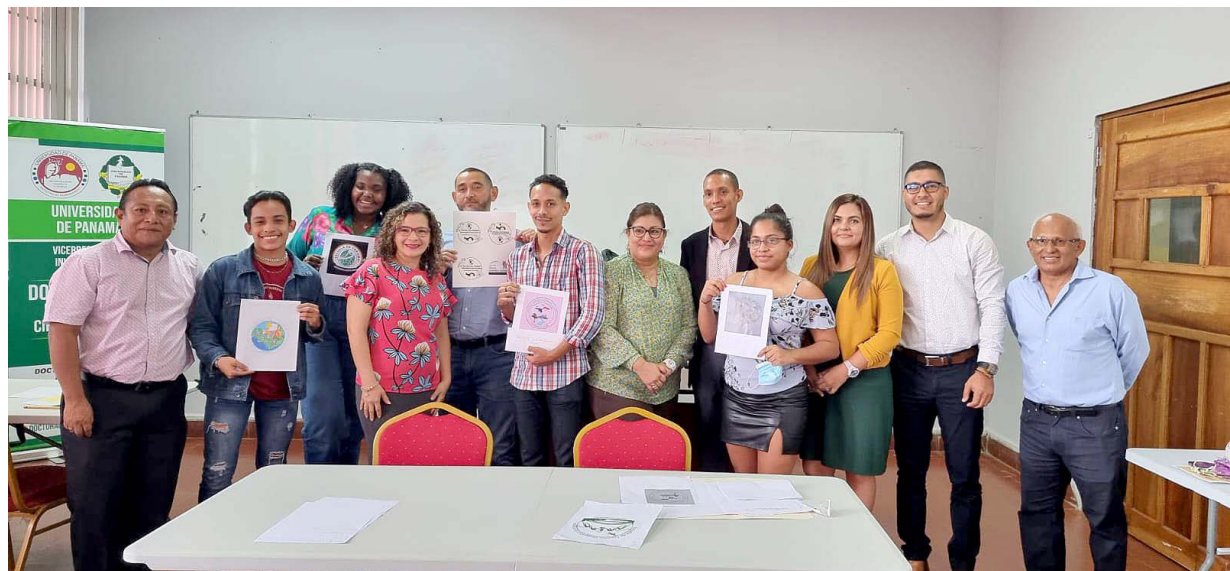
Participantes del concurso de la Escuela de Turismo Geográfico Ecológico.