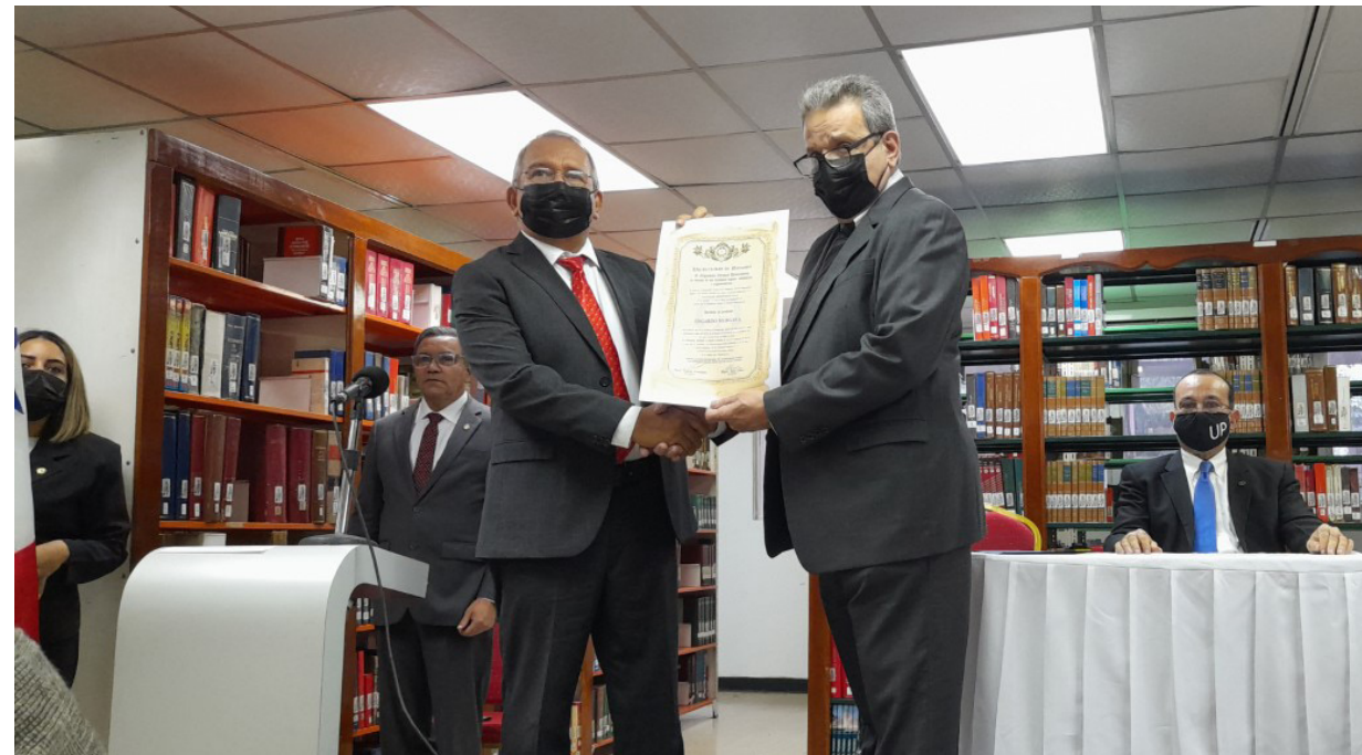
Acto de entrega de credenciales a nuevas autoridades de la Facultad de Comunicación Social.