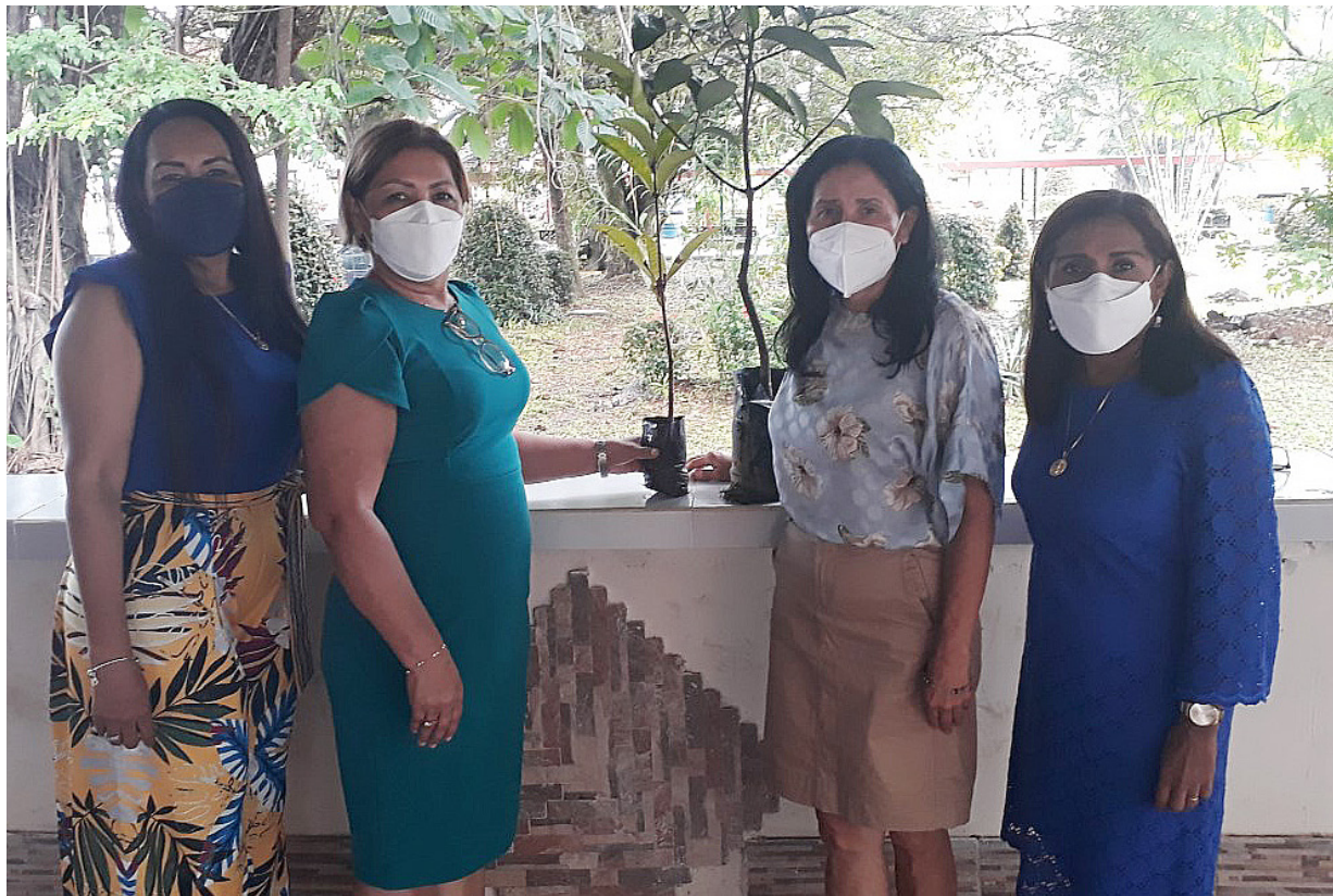
Comisión de Ambiente donó árboles a la administración del Cruv.