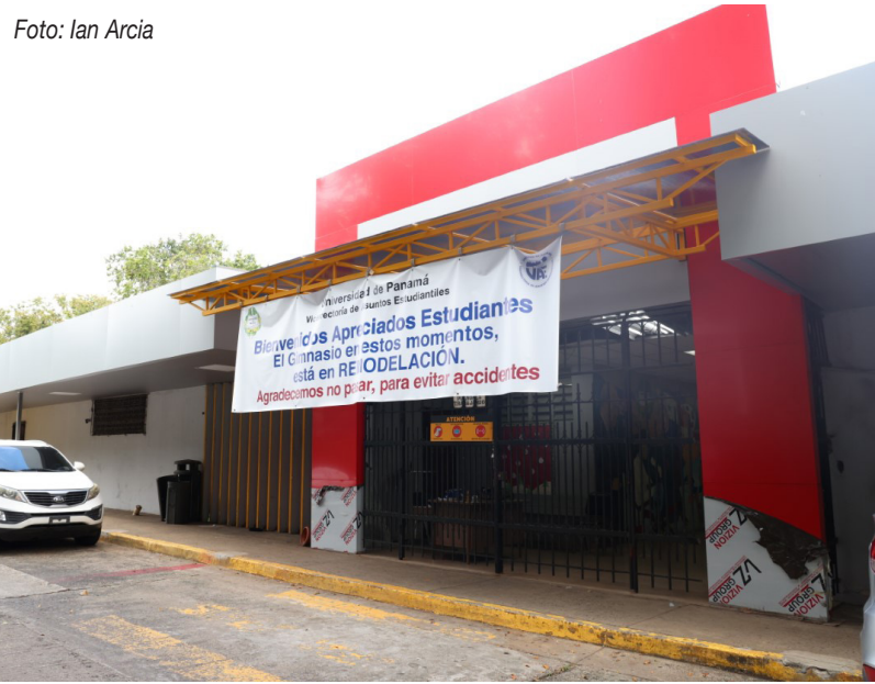
Primera fase del proyecto de renovación del techo y marquesina del gimnasio.