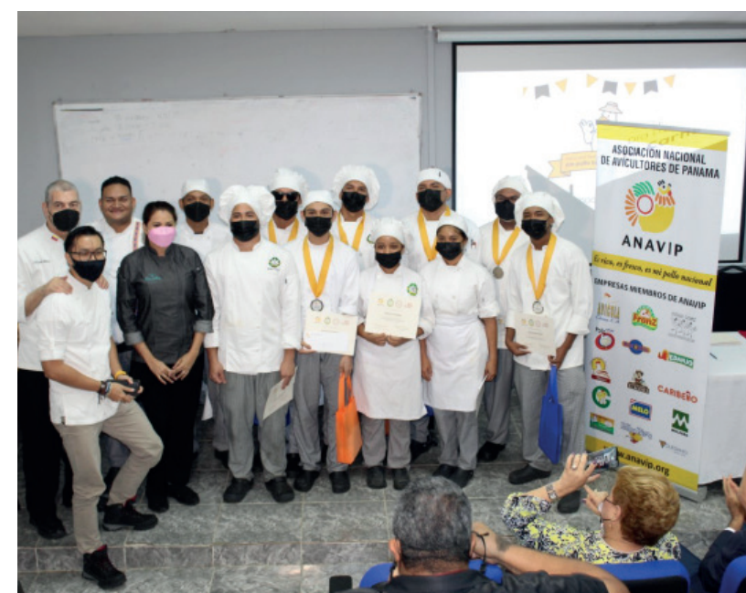
Estudiantes ganadores del concurso junto a los jurados y autoridades.

Los estudiantes trabajaron mediante 5 equipos, cada uno