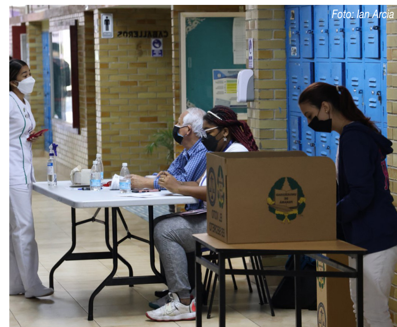
Estudiantes de la Facultad de Psicología emiten su voto.

estudiantes, 663 votaron, mientras que 877 no acudieron a la contienda electoral para ejercer su derecho.