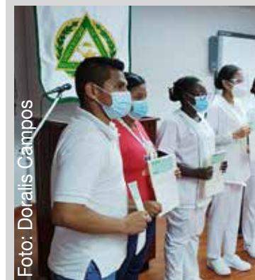
Estudiantes beneficiados del Programa de Conectividad y Transporte.