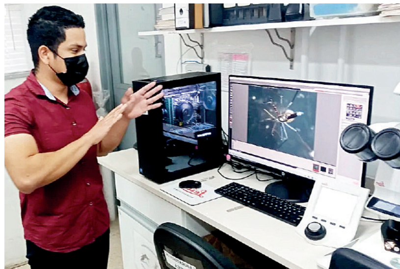
Biólogo especialista en Microbiología y Parasitología.

Publicación de La web de la salud/ 3 de junio, 2022