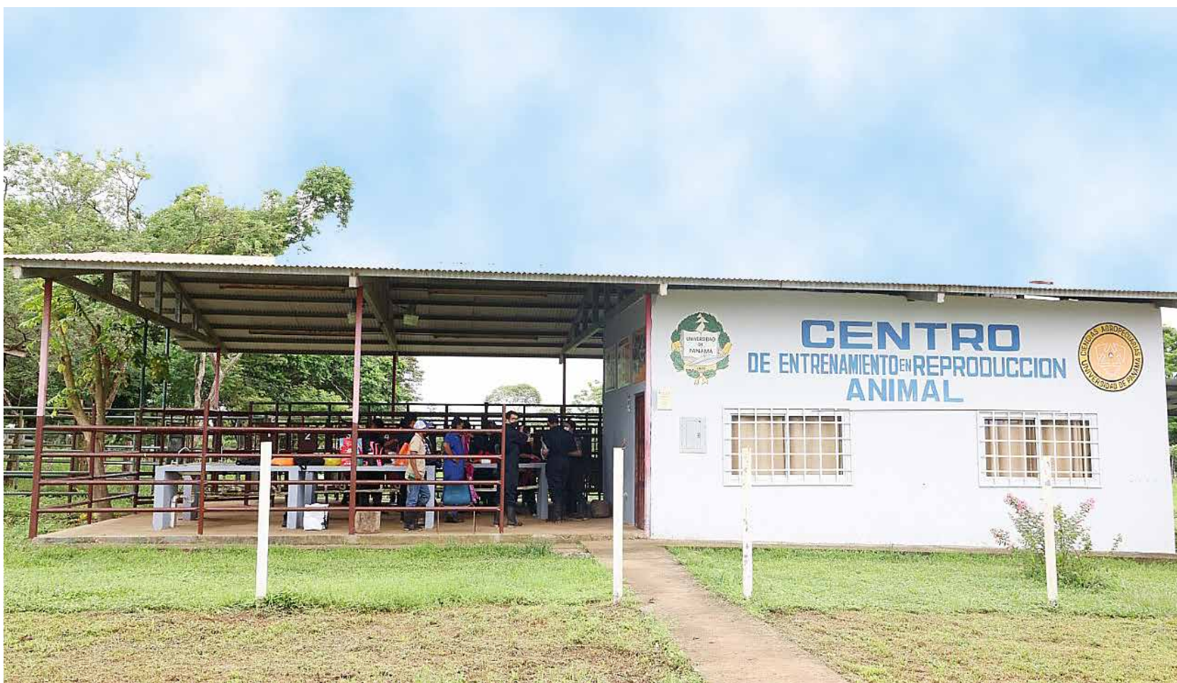
Instalaciones acondicionadas para la temporada lluviosa.

Solís asegura que una parte importante del hacer de la universidad es ser formadora de profesionales y la única academia en el país que prepara ingenieros Agrónomos Zootecnista es la Universidad de Panamá. La idea es trabajar en esa línea. Culmina asegurando que mediante la extensión se puede coadyuvar al trabajo que realizan los productores lecheros.