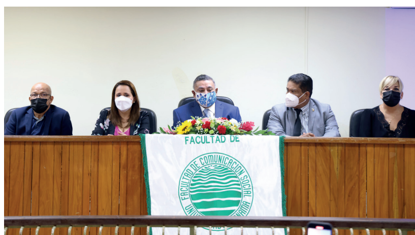
Acto de inauguración de la primera clase del doctorado.

Es importante tomar en cuenta las conquistas logradas, la actualización del plan de estudio en periodismo y la modernización de otras carreras. Además, trabajar en la creación de nuevas maestrías y doctorados para que al pasar de los años la facultad sea más competitiva.