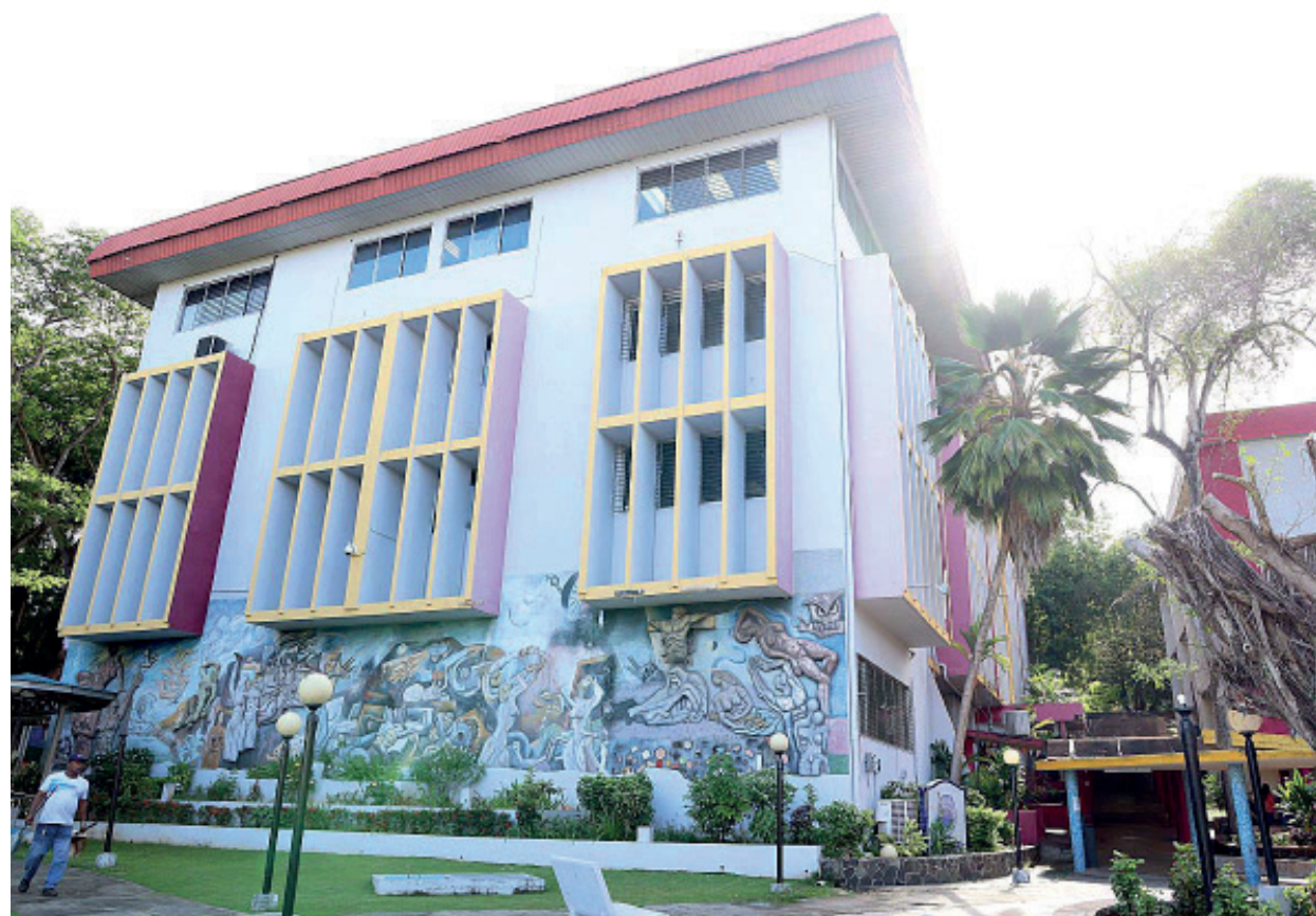
Facultad de Comunicación Social.