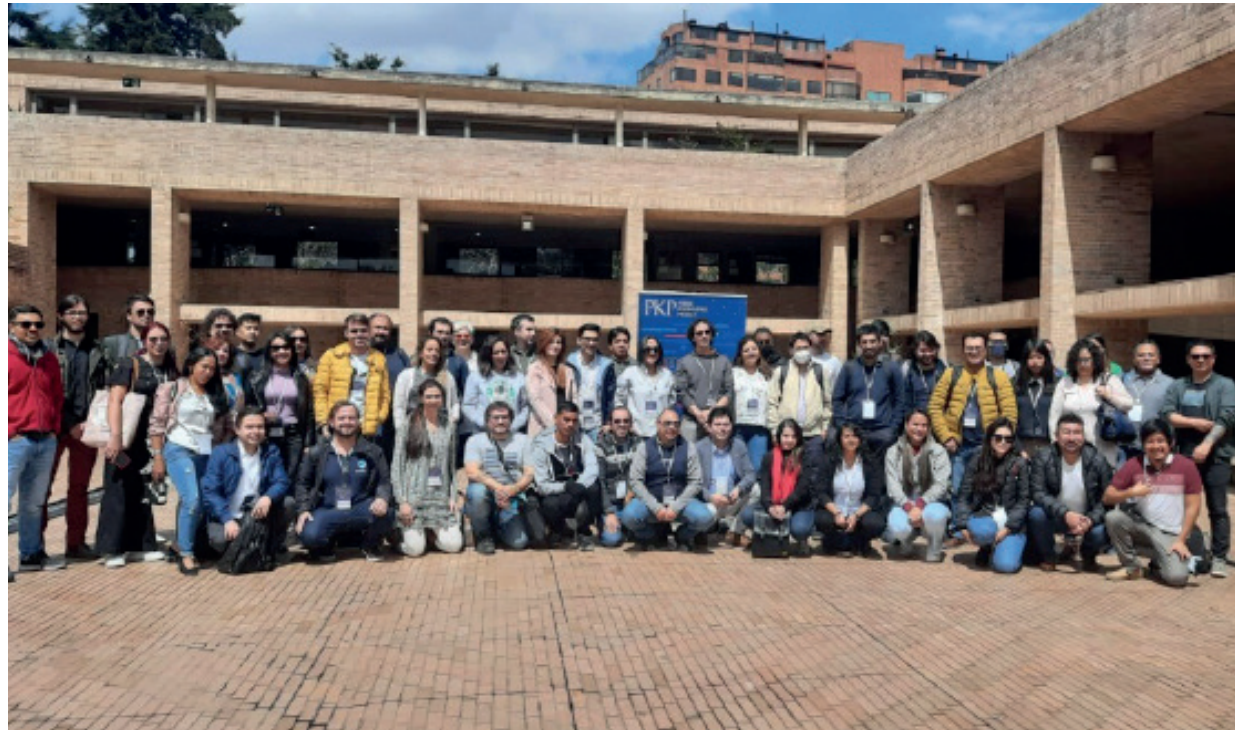
En PKP Sprint Bogotá, programadores, editores y traductores de revistas de Argentina, Colombia, Chile, México, Panamá, Costa Rica y Perú.

El evento se realizó en la Universidad Nacional de Colombia a fines de junio.