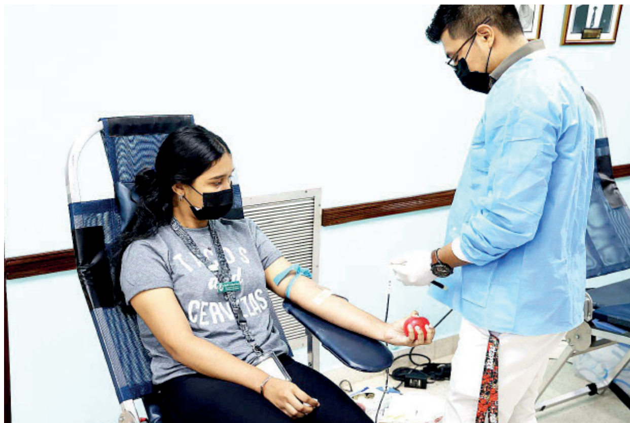
Extracción de sangre de donante.