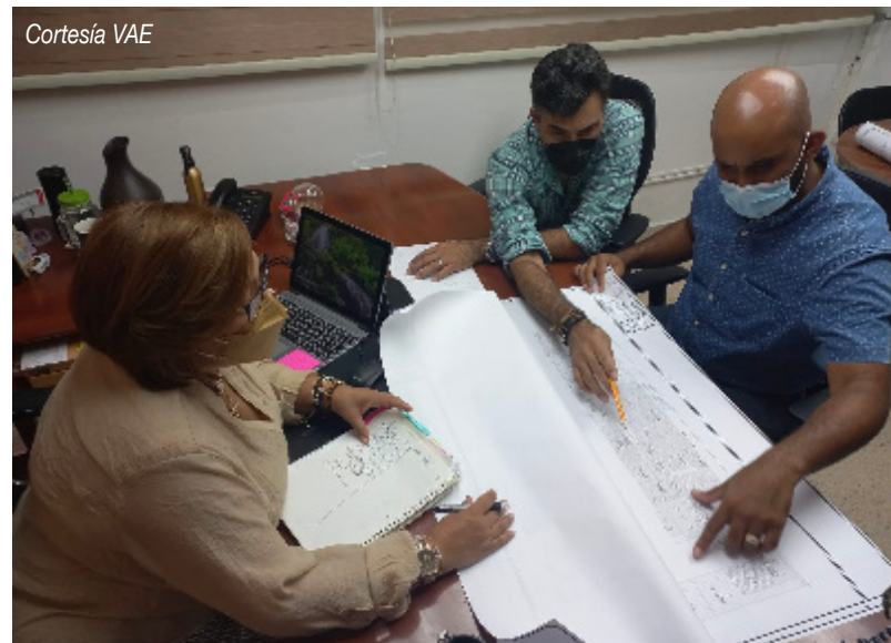
Presentación de planos de la segunda fase por parte de la Oficina de Seguimiento de Proyectos Especiales.