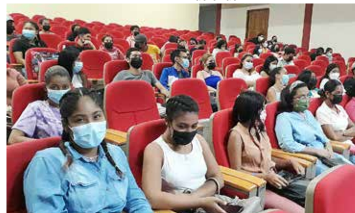
Estudiantes de primer ingreso.

El director del Centro Regional Universitario de Veraguas, magíster Pedro Samaniego, dio la bienvenida: "Nadie puede querer lo que no conoce, por consiguiente, la UP necesita que los estudiantes la conozcan para que la puedan querer y defender".