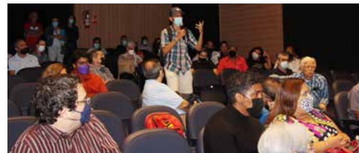
Público presente en la velada cultural intercambia impresiones con los participantes del documental.