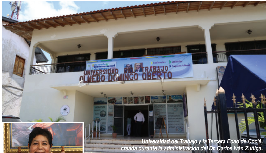
Universidad del Trabajo y la Tercera Edad de Coclé, creada durante la administración del Dr. Carlos Iván Zúñiga.

Destaca que este año se agendó un programa, tomando las debidas medidas de seguridad. Incluye recorridos a lugares históricos, actividades recreativas y deportivas, talleres de nutrición, talleres de teatro, círculo de lectura, talleres de cocina, jornadas de juegos de mesa, actividades culturales, cursos de manualidades y baile terapia.