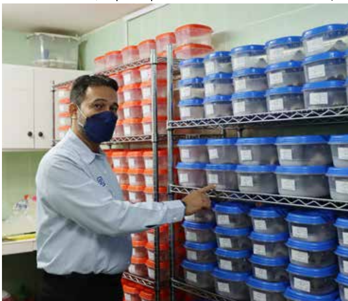
Miguel Ángel Flores, director nacional de verificación ambiental del Ministerio de Ambiente.