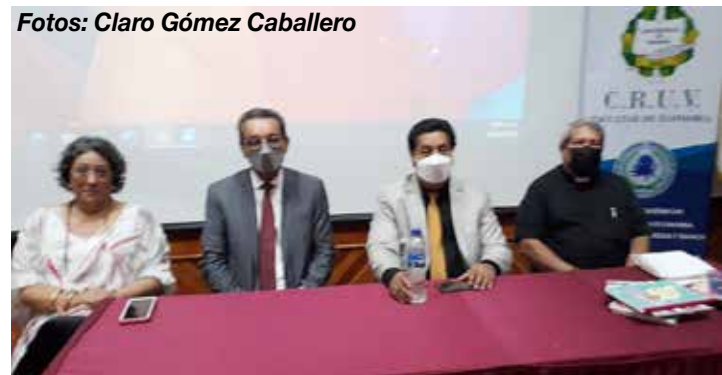
Autoridades y comisión organizadora.