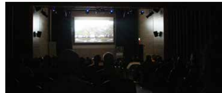
Presentación especial del documental Chuchú y el General en el Teatro Gladys Vidal.