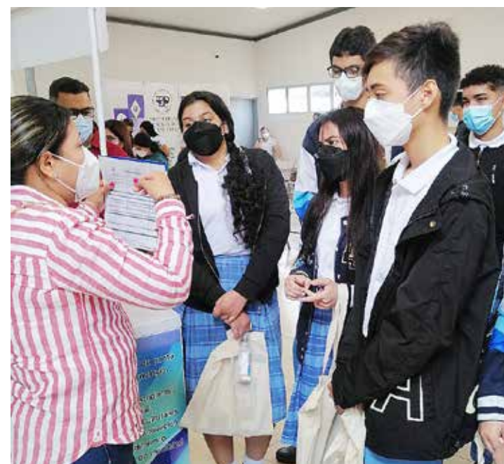
Profesores y administrativos informan de las carreras del Crua.

Expresó que para los coordinadores, docentes y administrativos es importante interactuar, conocer las inquietudes de los futuros estudiantes universitarios y en particular saber cuál es la carrera que les despierta interés.