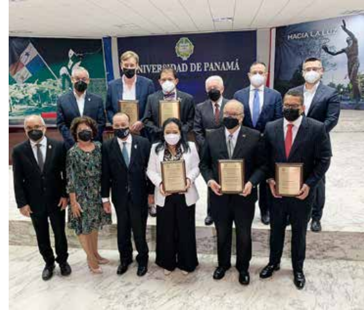
Médicos que recibieron placa por su labor durante la pandemia.