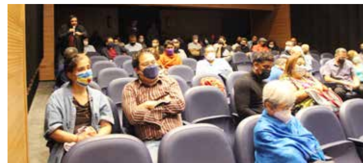
Estudiantes, docentes y administrativos participan en la proyección del documental.