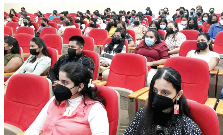
Estudiantes de la carrera de Contabilidad del Cruv.