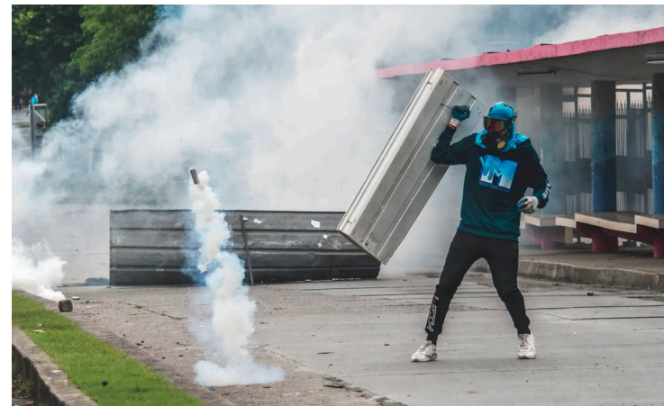
Imagen de un estudiante durante el tercer día de protesta.

de la Fuerza Pública en contra de la Primera Casa de Estudios Superiores debe ser catalogada como un acto violento y mal intencionado.