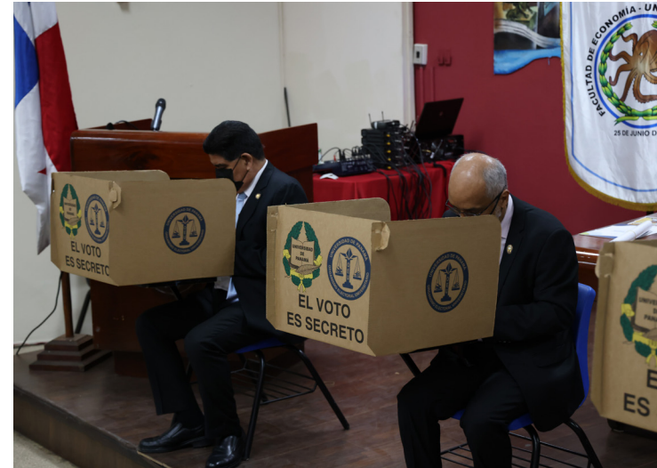
Autoridades universitarias emiten su voto para ambos cargos.