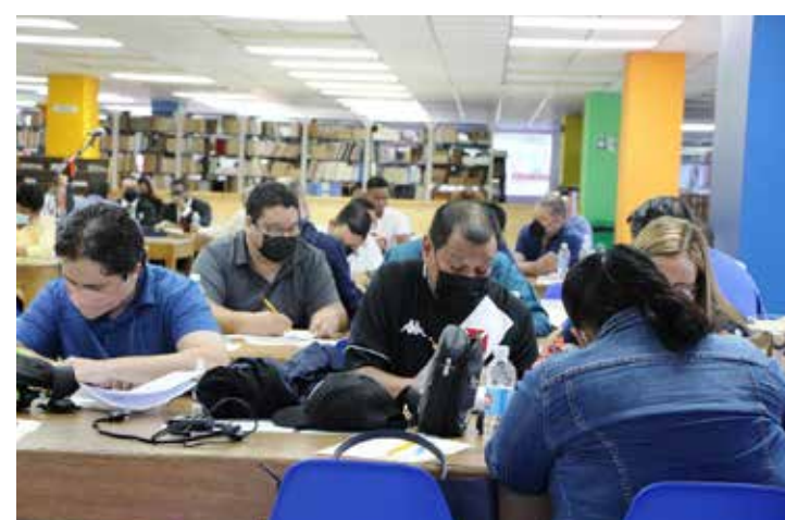
Participante del seminario taller.