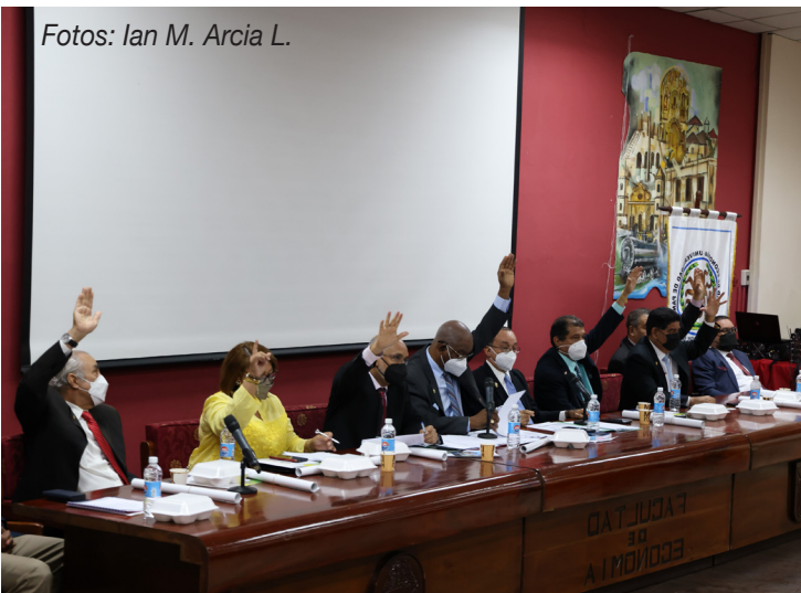
Aprobación del orden del día.