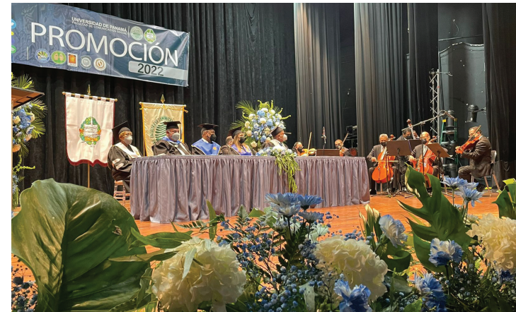
Autoridades universitarias en la ceremonia de graduación.