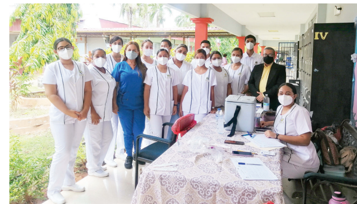
Estudiantes de Enfermería del Crua.