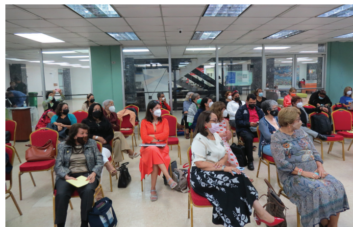
Asistentes iberoamericanas al congreso.