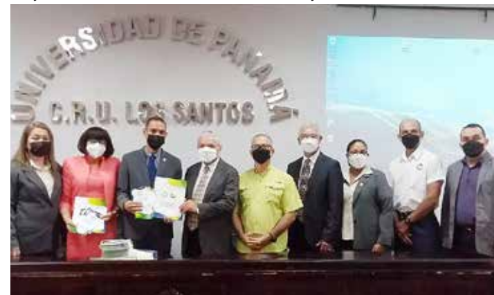
El Cruls participó en la Jornada de Sensibilización realizada por el Comité Técnico de Evaluación.