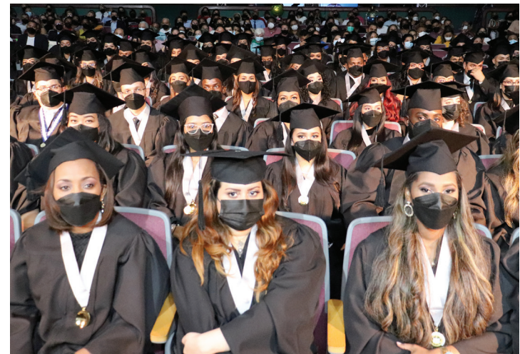
Graduandos de la Facultad de Comunicación en diversas áreas del saber.