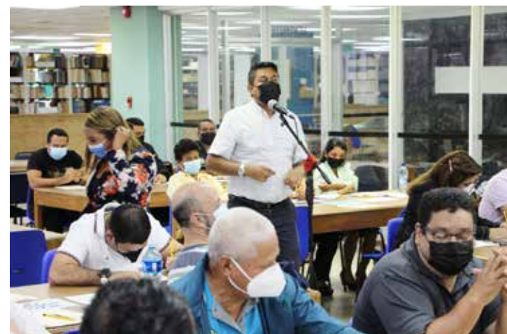
Funcionarios ofrecen sus aportes al Plan de Mejoramiento de la DSA.

El seminario se realizó en el auditorio Carmen Herrera y en la hemeroteca de la Biblioteca Simón Bolívar y contó con la asistencia de más del 90 por ciento de los colaboradores.