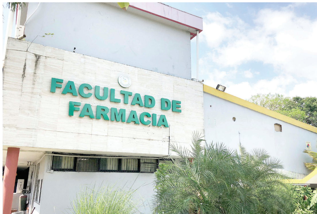
Facultad de Farmacia de la Universidad de Panamá.