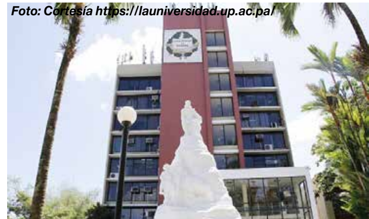
Campus Central de la Universidad de Panamá.