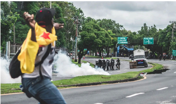
Confrontación de estudiantes y agentes de la UCM.