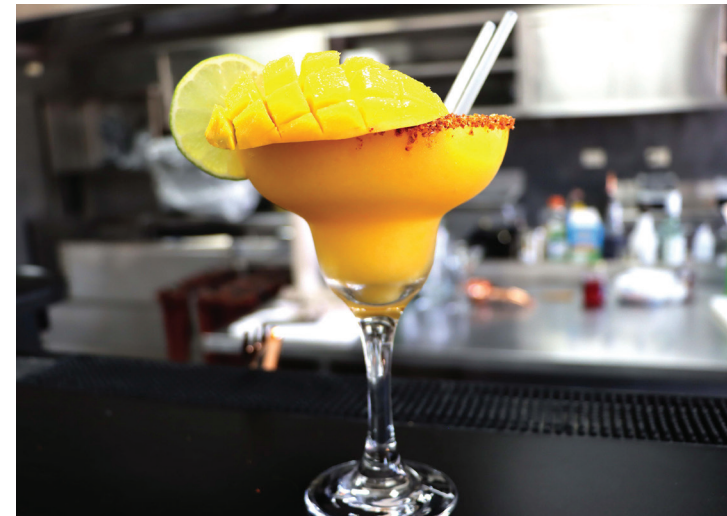
Coctel de Mango. Mangifera indica es el nombre científico de este fruto traído de la India.