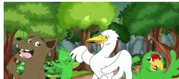
Cheril, la garza Organizada del río San Pablo-Doris Hernández (autora).

agentes de cambio en esa lucha por conservar el agua y demás recursos naturales. No importa la trinchera desde donde nos encontremos, cada uno puede hacer la diferencia, incluso, si