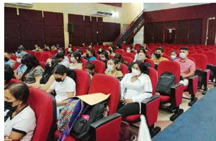
Asistente a la presentación de la obra.