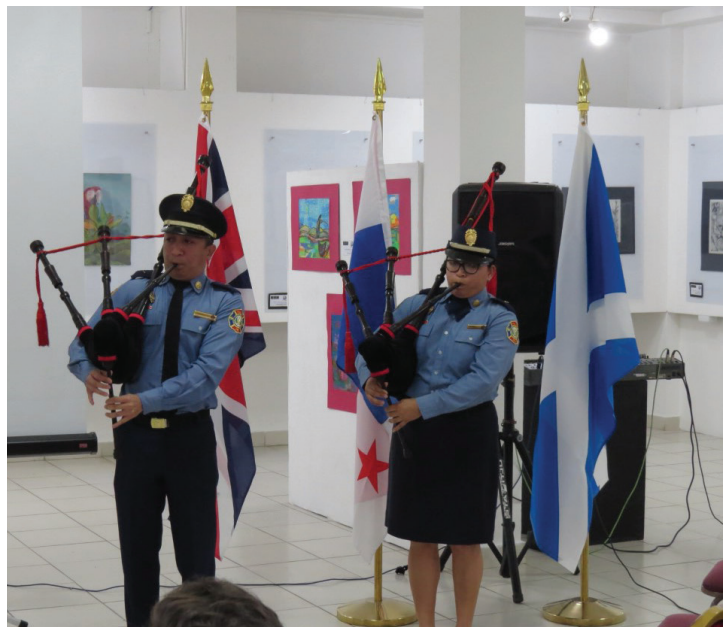
Interpretación de gaita por miembros del Benemérito Cuerpo de Bomberos.

La jornada cultural fue organizada por la Dirección de Cooperación Internacional y Asistencia Técnica (Diciat).