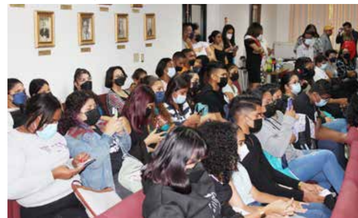
Estudiantes de la Escuela de Español participan del XIX Festival Cervantino y Día del Idioma

Mendieta y la amenización musical de la Orquesta Folclórica Los Juglares, de la Dirección de Cultura de la Vicerrectoría de Extensión.