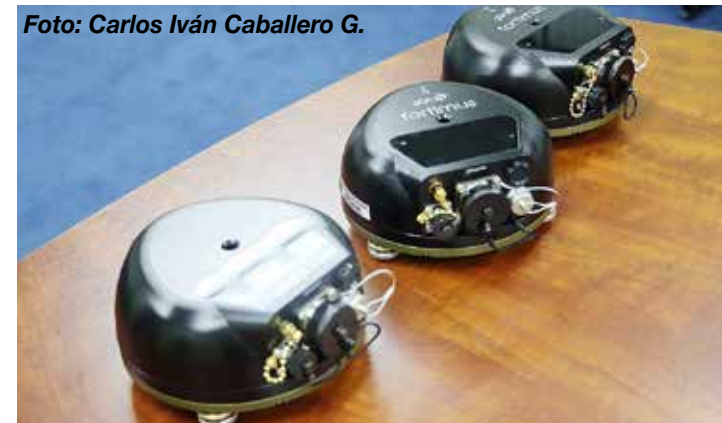
Acelerómetros digitales de alta sensibilidad permiten detectar movimientos telúricos.