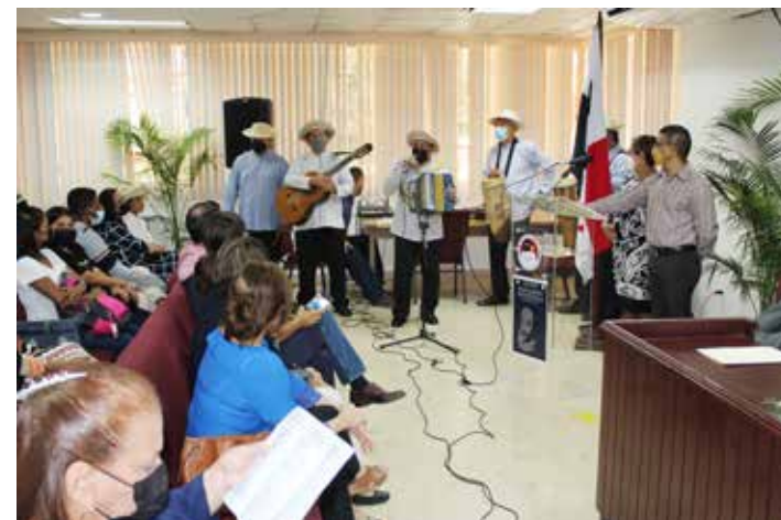
Orquesta Folclórica Los Juglares durante la presentación en la Facultad de Humanidades.