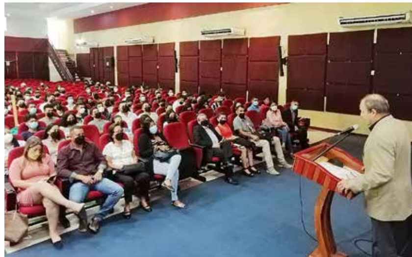
Asistentes a la presentación del libro en el auditorio del Crua.

El docente ofreció su opinión sobre las inundaciones que ocurren en varios sectores de la ciudad de Panamá. Explicó que la ciudad ha ido creciendo y no se han respetado las áreas verdes. Acotó que eso