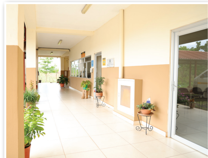
Proyecciones para el 2023: Construcción de depósito y cafetería.

Arjona destaca la participación de la extensión en actividades ejecutadas conjuntamente con la Alcaldía del distrito de Ocú en la jornada de forestación, en la Reserva El Camarón (área de San José). Cuentan con una representación en el Festival Nacional del Manito, feria y festividades religiosas de San Sebastián y Semana Santa. Y, actividades académicas en los colegios Rafael Quintero y José D. Carrizo.