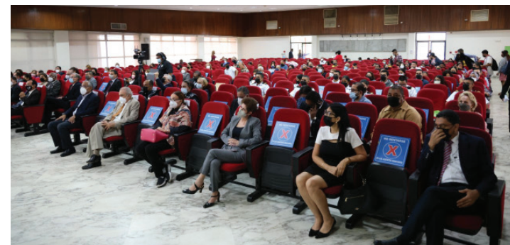
Personalidades e invitados que asistieron al Miércoles Universitario .

universidad, diversas agrupaciones exigen o sugieren temas para debatir. Agregó que las conclusiones y recomendaciones que se obtienen cuando se realizan los foros son tomadas en cuenta.