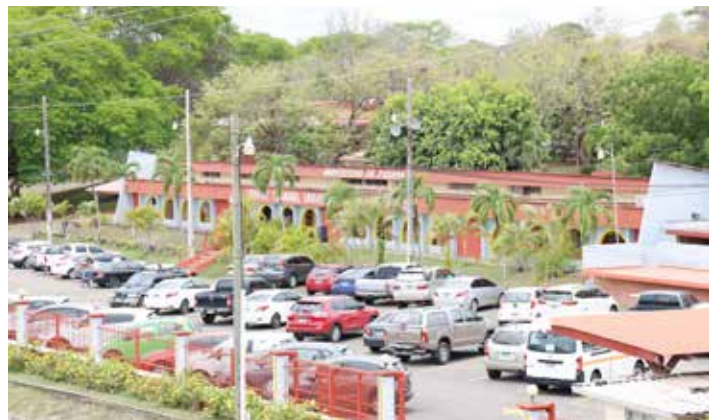
Panorámica del Centro Regional Universitario de Los Santos.