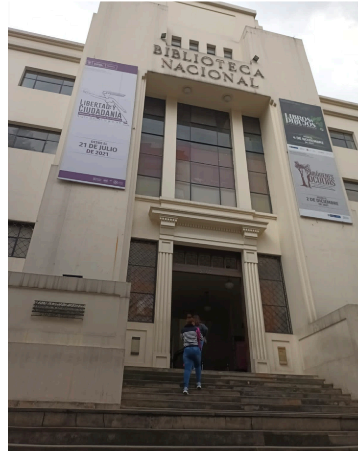
Fachada de la Biblioteca Nacional de Colombia.