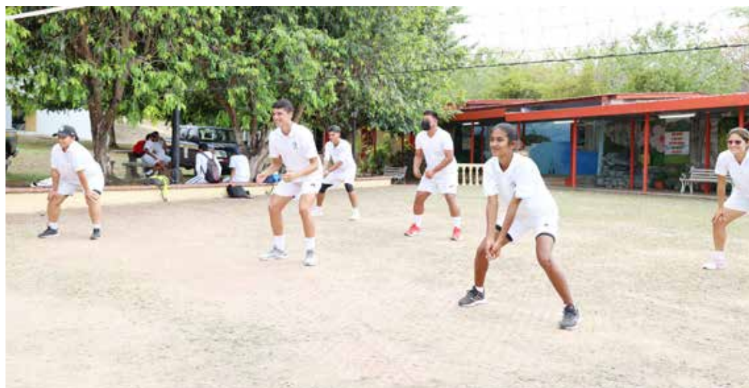
Se planifica la construcción de una cancha deportiva con una inversión estimada en 1 millón 10 mil dólares, para dar respuesta a estudiantes de la carrera de Educación Física.

Díaz mencionó que el Instituto Pro Mejoramiento de la Ganadería (PROMEGA), de la Universidad de Panamá (UP), reactivó un acuerdo de operación para realizar actividades de campo en este centro regional.