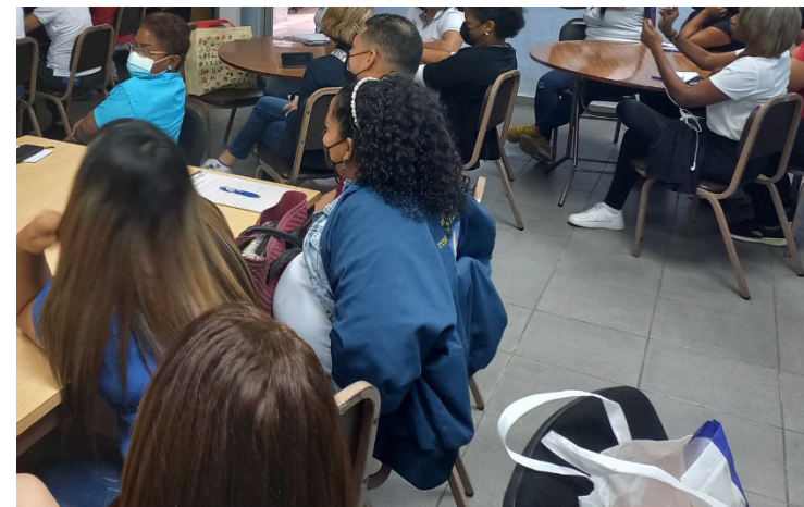
Funcionarios de la Vicerrectoría de Asuntos Estudiantiles reciben actualización en procesos administrativos.