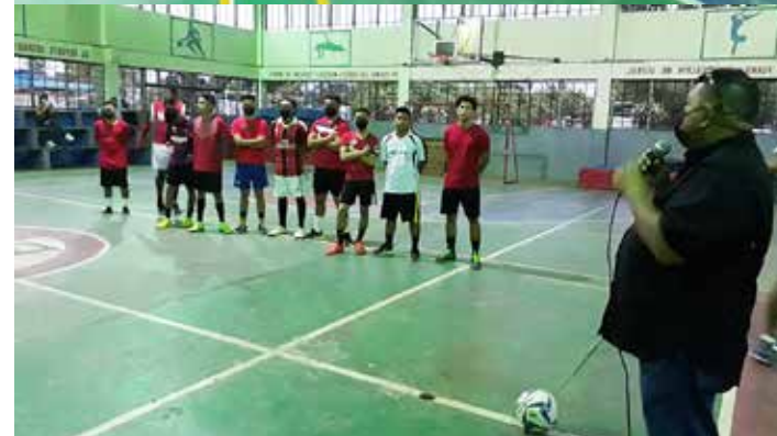
El CRUV inauguró liga interna de Fútbol Sala.