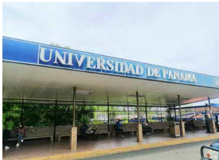
Centro Regional Universitario de Azuero.

Recordó que el proyecto de renovación de la Facultad de Ciencias Naturales, Exactas y Tecnología que se desarrolla en el campus central permeará a los laboratorios que operan en ese centro regional, equipándolos con modernos aparatos tecnológicos .