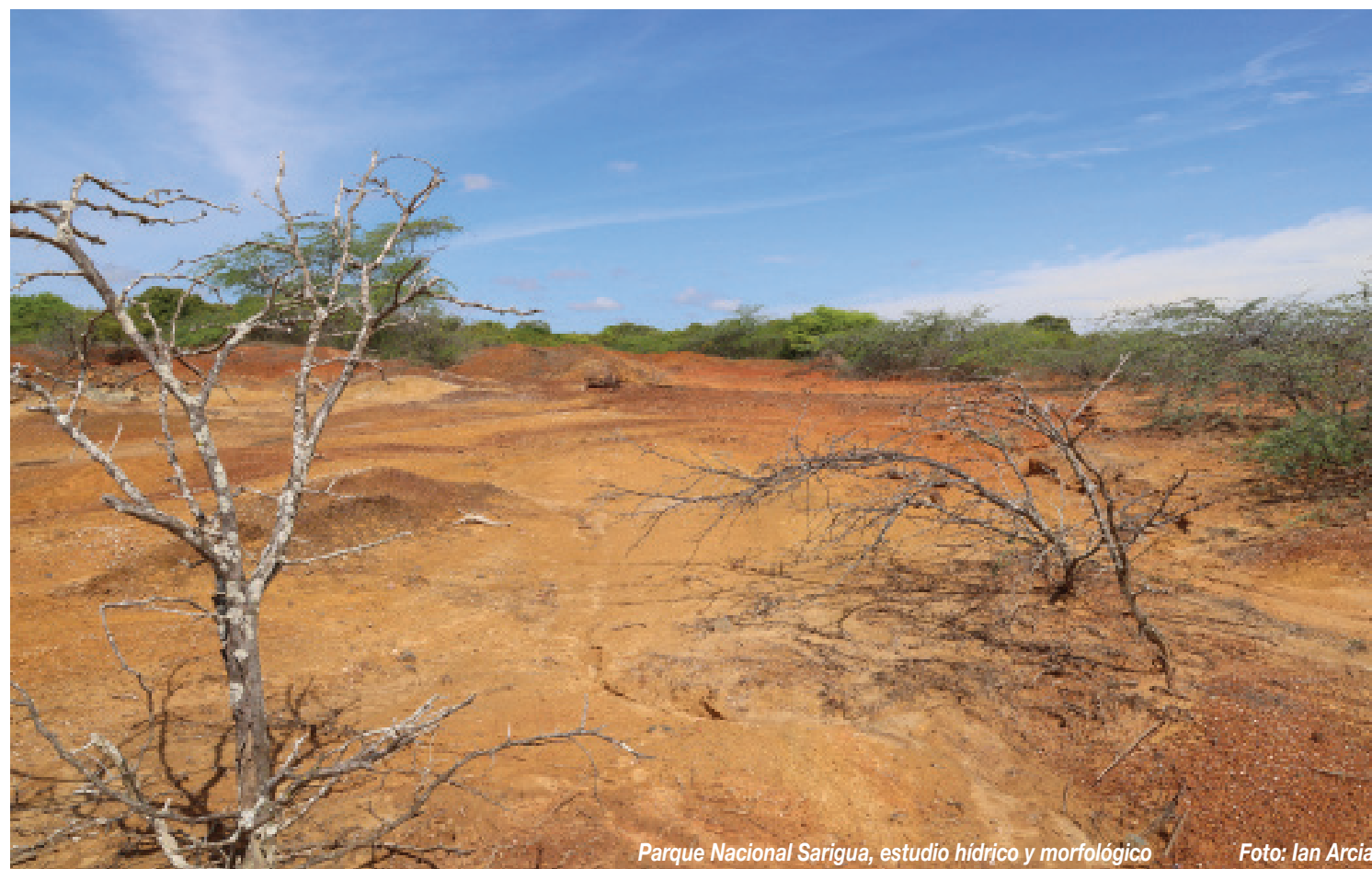
Parque Nacional Sarigua, estudio hídrico y morfológico