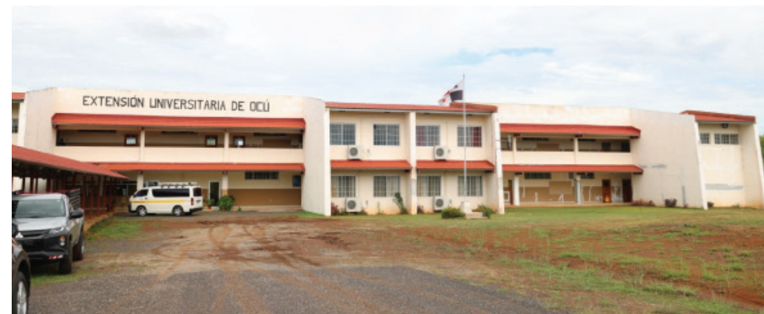
Edificio inaugurado en 2017.