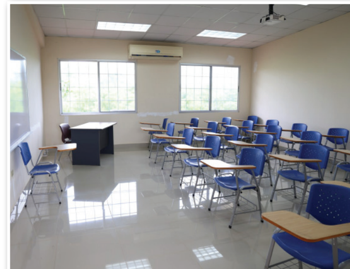
Aulas de clases acondicionadas con equipos tecnológicos.