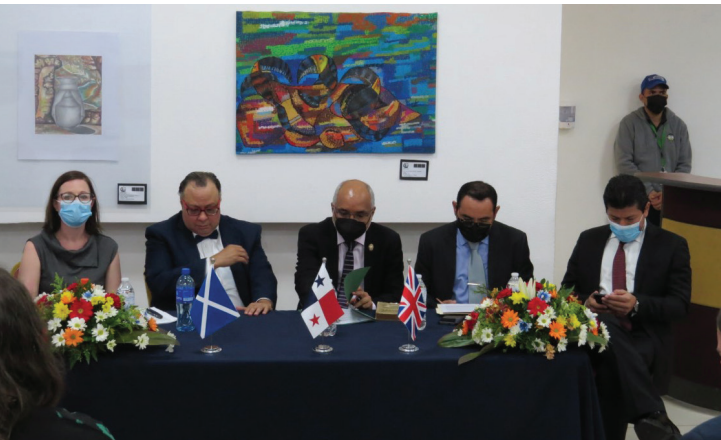
Autoridades y expositores en la mesa principal.