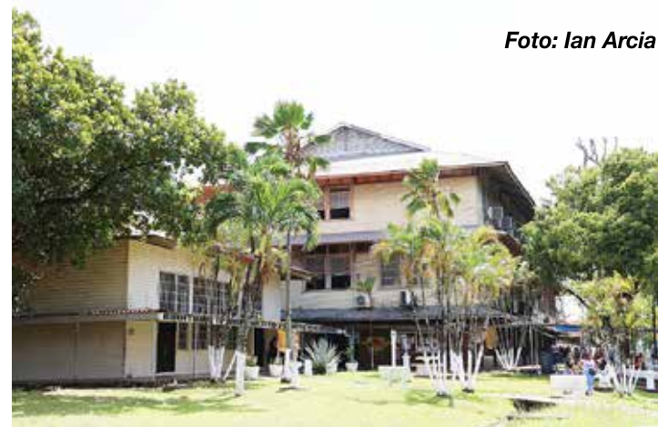
Edificios de la administración, el Arca, Facultades de Humanidades y Derecho, próximos a cumplir 100 años al final de esta década.