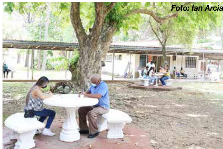
En el nuevo edificio de la administración se instalaría una cafetería más accesible y un pequeño auditorio.