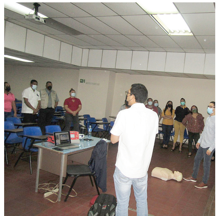
Participantes del seminario taller.

los participantes practicaron la resucitación y la forma cómo deben atender un caso de atragantamiento. Saber cómo aplicar la mecánica de los movimientos es vital para salvar una vida.