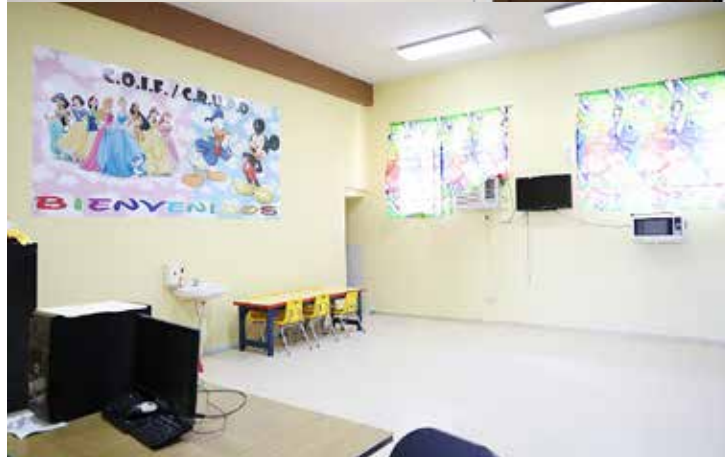
Instalaciones del centro donde se atiende a los niños.