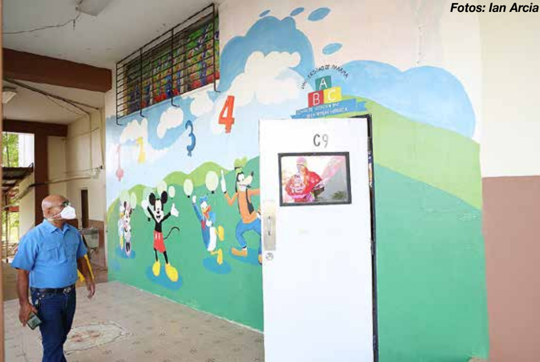
Fachada del Caipi del CRU de Panamá Oeste.