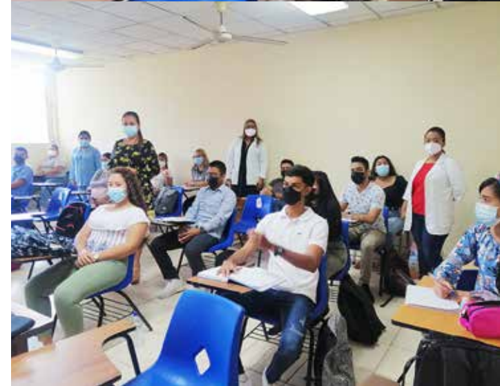
Docentes y estudiantes de la Facultad de Enfermería.