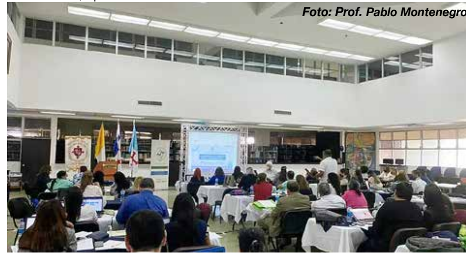
Participantes del Diplomado Autoevaluación, Acreditación y Reacreditación Universitaria.