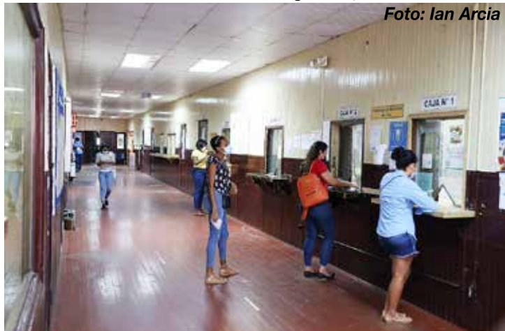
La matrícula supera los 8 mil estudiantes, en el Centro Regional Universitario de Colón.