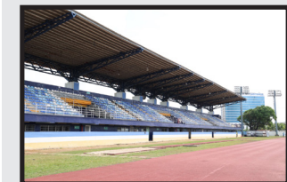
Estadio Armando Dely Valdés

Convenio con Pandeportes a la espera del refrendo de la Contraloría General de la República