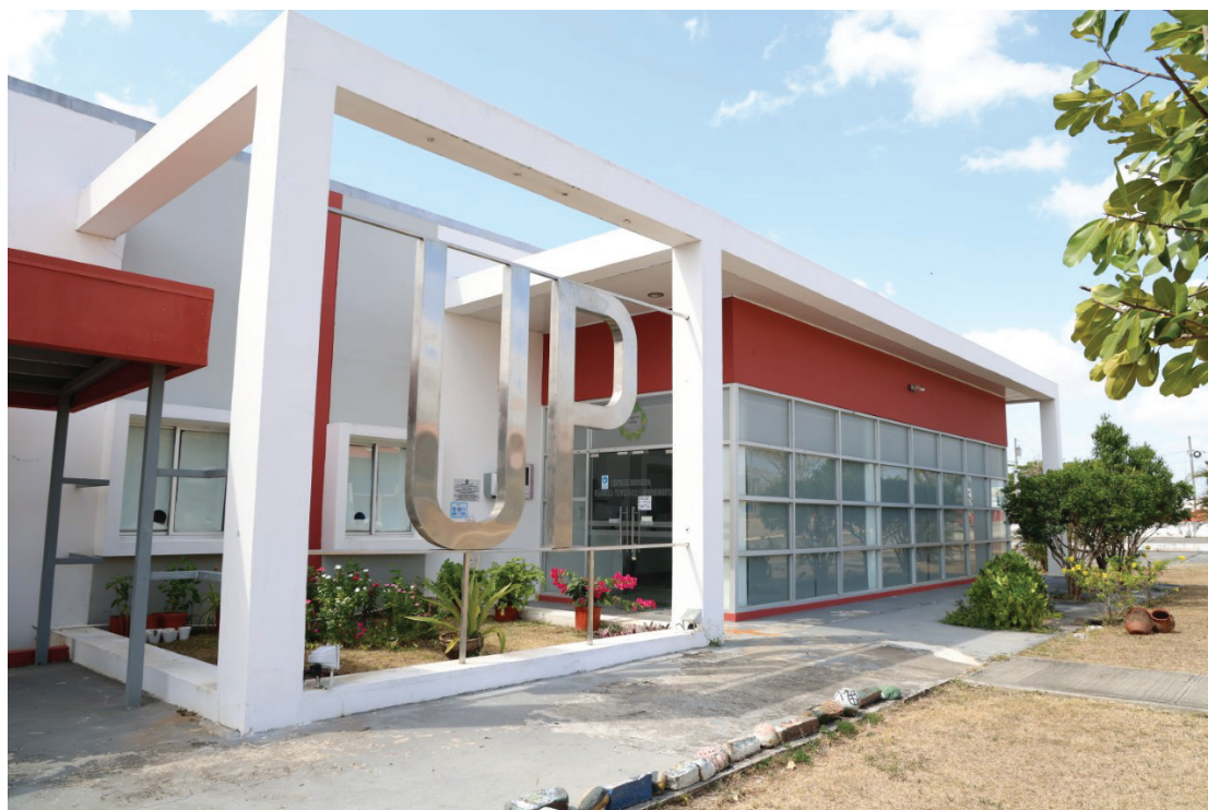
Fachada del Cidete de Penonomé.