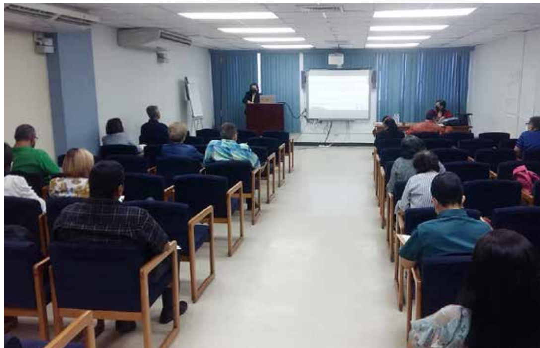
Reunión y talleres de trabajo en la Facultad de Ciencias Naturales, Exactas y Tecnología.