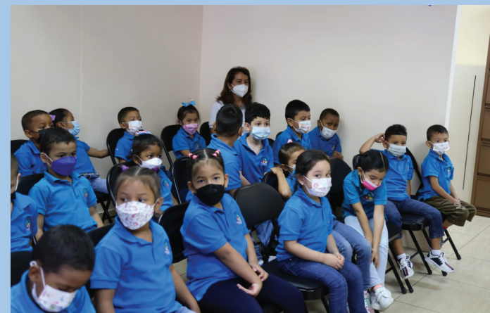
Niños del CAIPI acompañados de su maestra.

La actividad se realizó en la Librería Universitaria.