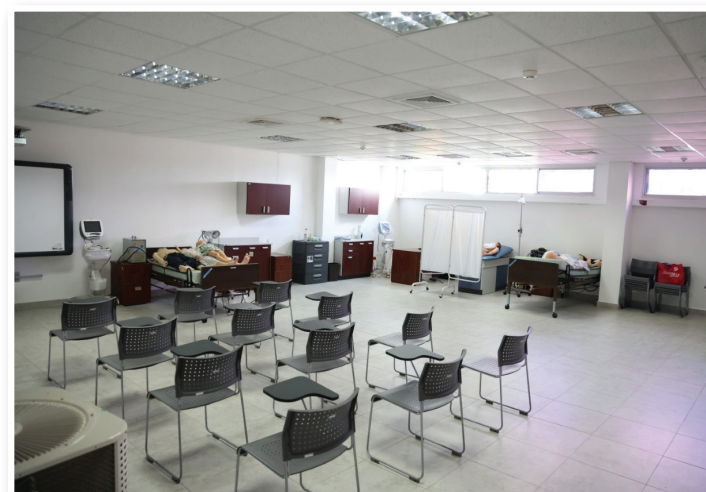
Salón de Simulación.

La idea es aprovechar la disponibilidad de nuestros investigadores para que estudiantes, docentes y personas externas hagan sus investigaciones con el apoyo de nuestros profesores y los especialistas en investigación.