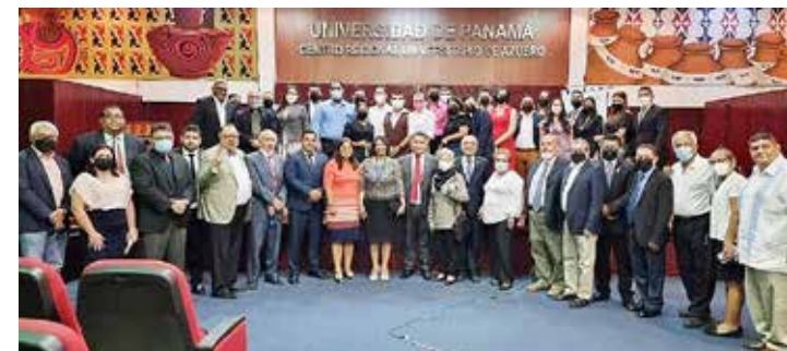
Autoridades universitarias, profesores y administrativos del CRU de Azuero.