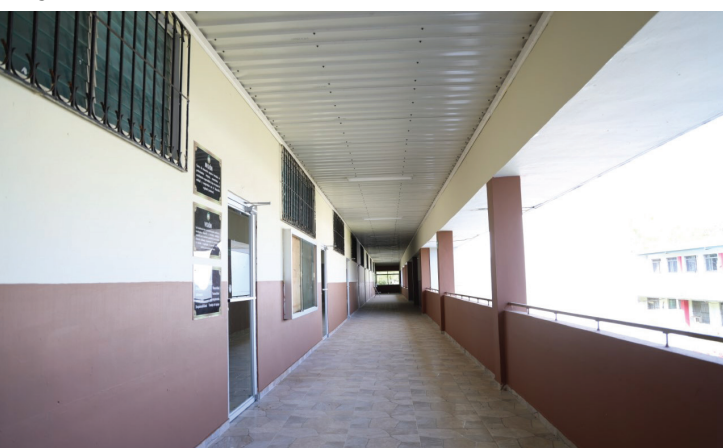
Salones acondicionados para recibir a los estudiantes.

El director del CRUPO aseguró que respetarán las condiciones sobre la infraestructura debido a que los salones son