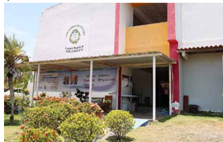
Extensión Universitaria de Aguadulce.