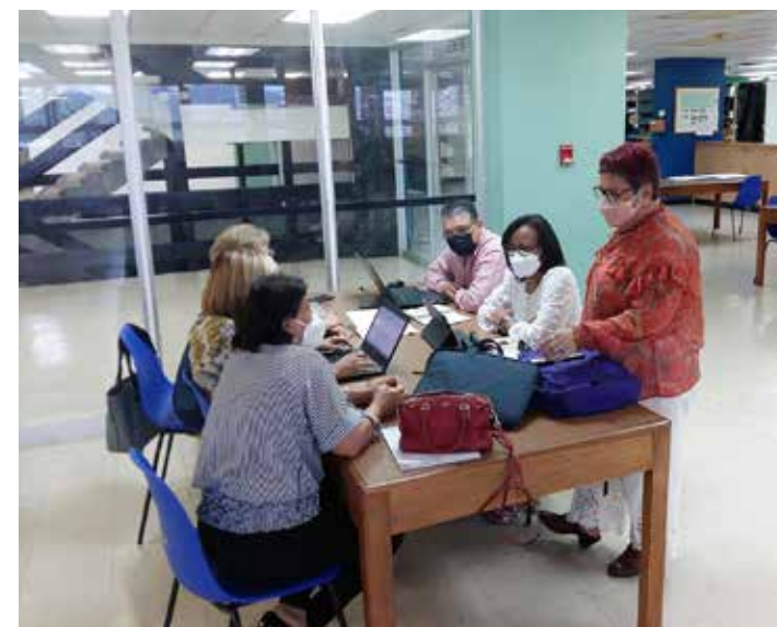
Sensibilización con docentes, administrativos y estudiantes de la Facultad de Ciencias de la Educación.

El logro de este gran objetivo lo obtendremos con esfuerzo, entusiasmo e identidad institucional, tal como lo dice nuestro lema: "Reacreditación Institucional: Una meta de todos", indicó la CGAI mediante un comunicado al que tuvo acceso el Semanario La Universidad.