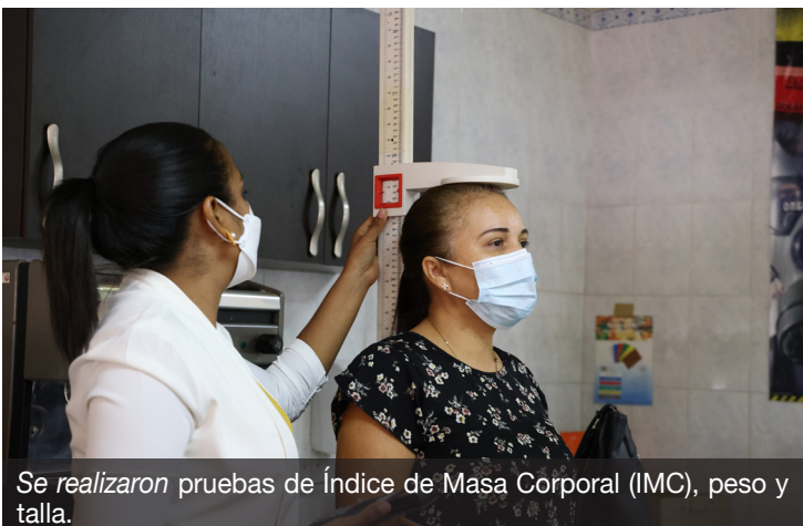
Se realizaron pruebas de Índice de Masa Corporal (IMC), peso y talla.

Alimentación y Nutrición IANUT, magíster Damaris Espino.