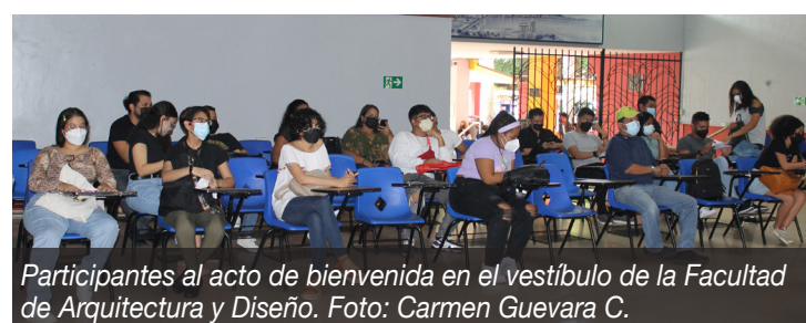
Participantes al acto de bienvenida en el vestíbulo de la Facultad de Arquitectura y Diseño.