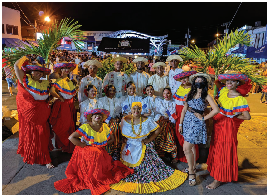
Grupo de Danzas Folklóricas Andrés Valiente.