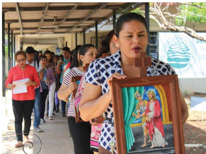
Personal administrativo en Vía Crucis.