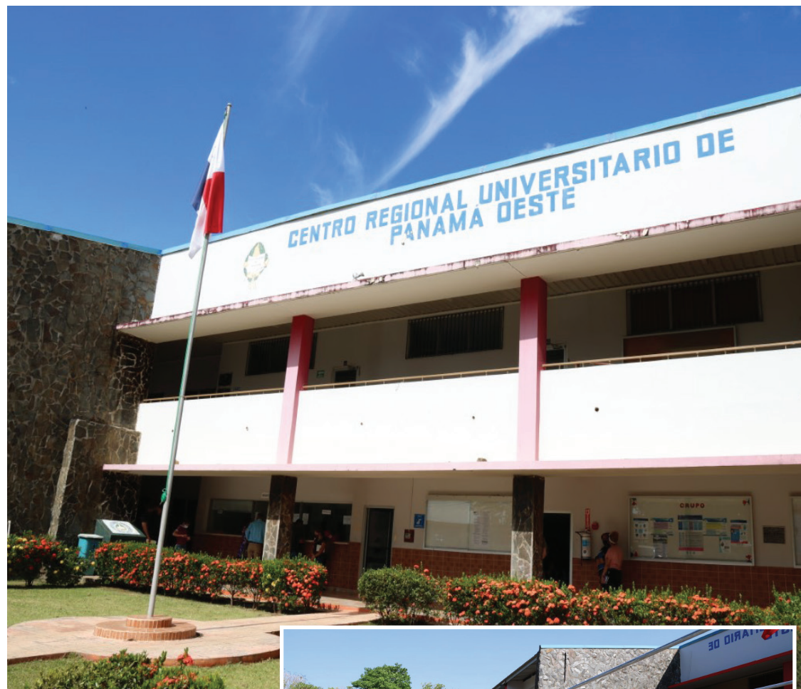
Sede del Centro Regional Universitario de Panamá Oeste.

Comentó que se está aprovechando la ventanita que dejó el Consejo Académico sobre las adecuaciones que puede realizar cada unidad académica de acuerdo con las