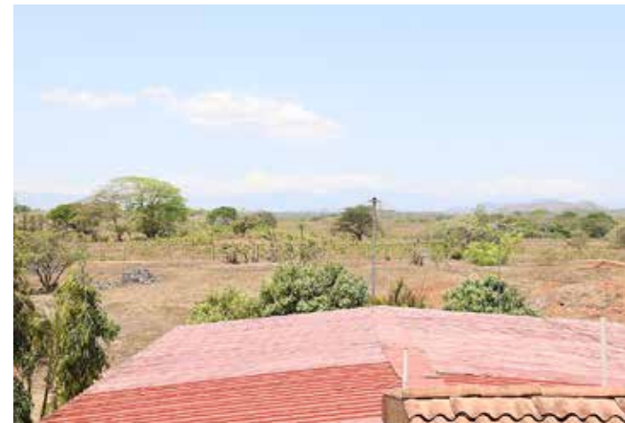
Globo de terreno de 6 hectáreas.

El área donde se ubica la estructura, es crítica puesto que se registran muchos fenómenos atmosféricos por lo cual el edificio presenta daños por rajaduras y por el tiempo que tiene.