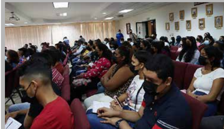
Estudiantes de la Facultad de Humanidades.