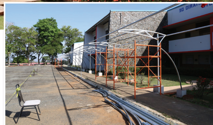
Adecuaciones de marquesina.

cuadro de horarios con el fin de evitar que surjan choques entre la presencialidad y los cursos a distancia. O sea, los días que tienen que venir de forma presencial son únicos y los días a distancia serán exclusivamente