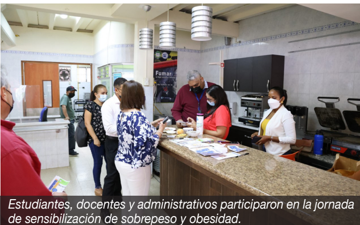
Estudiantes, docentes y administrativos participaron en la jornada de sensibilización de sobrepeso y obesidad.

provocando enfermedades cardiovasculares y la muerte de miles de personas, indicó la directora del Instituto de