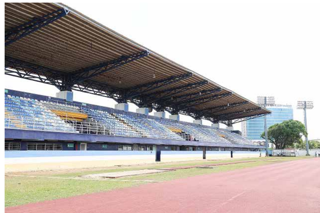
Gradas del Estadio Armando Javier "Pelé" Dely Valdés.

El Estadio Armando Javier "Pelé" Dely Valdés, ubicado en la finca N°8872 inscrita en el Tomo 1621, Folio 472, parcela AIDI-10 (Globo III), del Registro Público de la República de Panamá, forma parte de las 14.9 hectáreas, propiedad de la Universidad de Panamá.