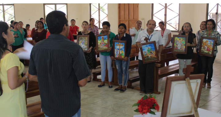
Última estación, dentro de la Capilla San Pancracio.

La Semana Mayor se extiende desde el domingo 10 al domingo 17 de abril.