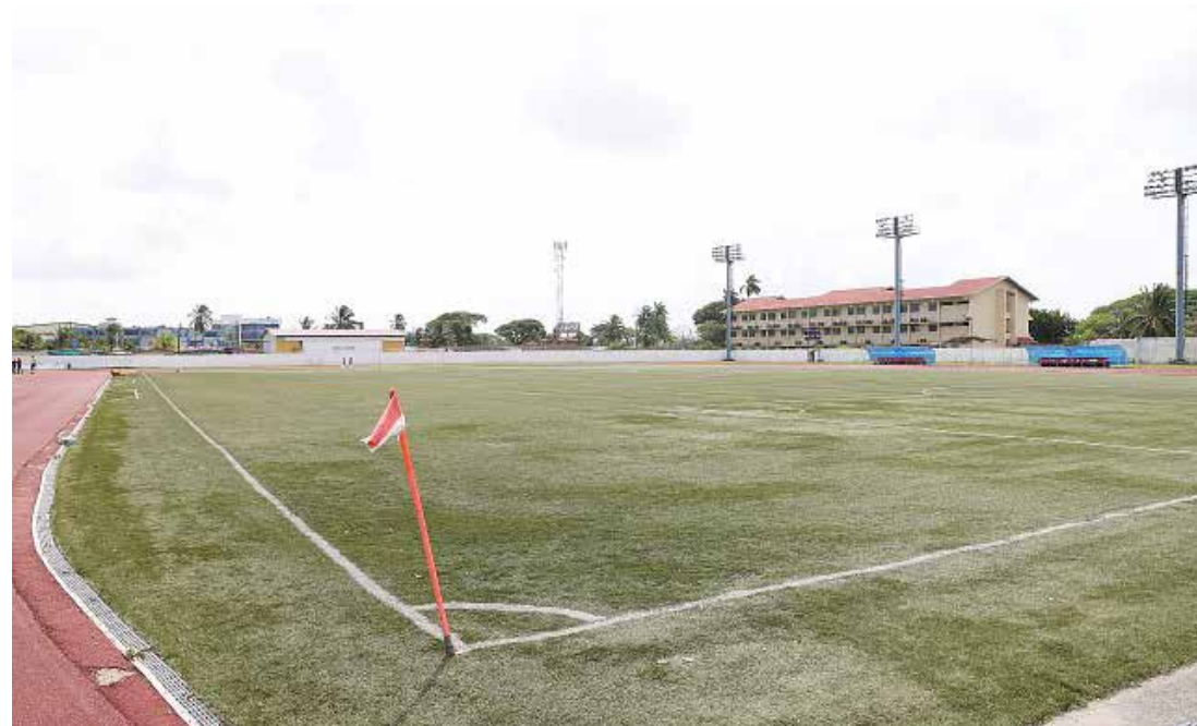
Grama del Estadio Armando Javier "Pelé" Dely Valdés.

acuerdo establece la habilitación de aulas dentro del estadio, que serán usadas por la Escuela de Educación Física,