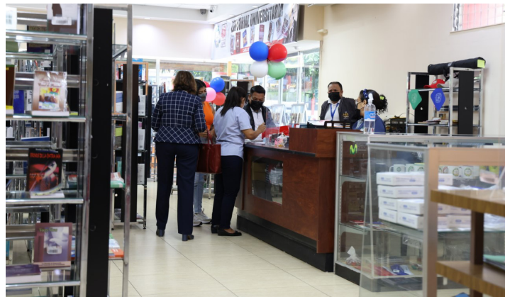
La librería otorgará un descuento del 5% a los estudiantes para que puedan adquirir su obras literarias y artículos promocionales.

“Queremos promover la venta de los libros a nivel nacional y esperamos realizar un servicio permanente en las facultades y centros regionales , de forma tal que