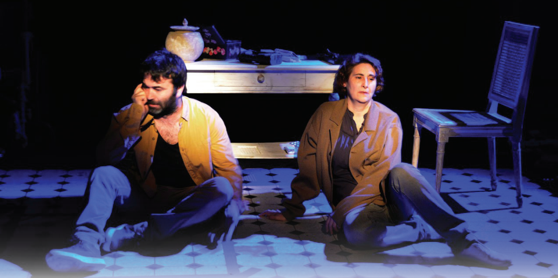
Festival de Artes Escénicas (FAE22), en el Teatro Nacional.