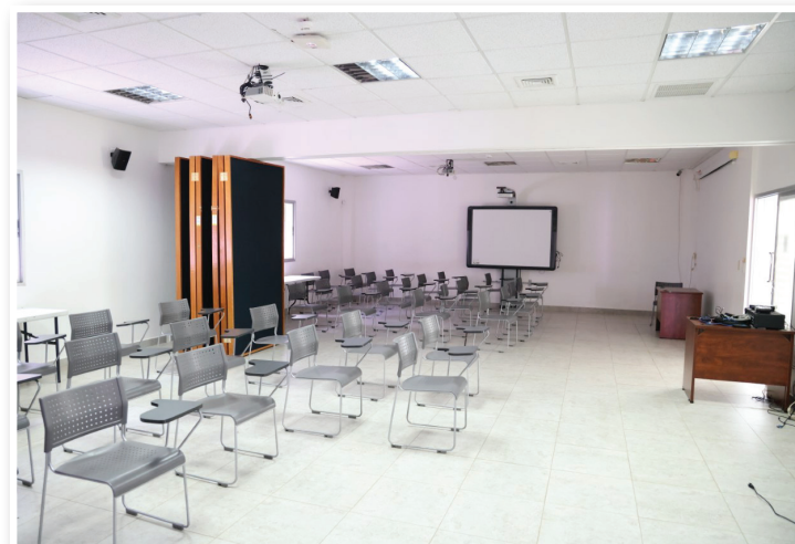
Sala de Conferencias.

En la sala de inteligencia diversos grupos de estudiantes reciben capacitaciones en emprendimiento y tecnología. Y en ocasiones los alumnos también pueden realizar sus asignaciones académicas.