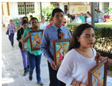
Estudiantes en Vía Crucis, realizado en los pasillos CRUV.

El Vía Crucis es un antiguo acto de devoción que realizan los cristianos (católicos) para recordar y representar la pasión, muerte y