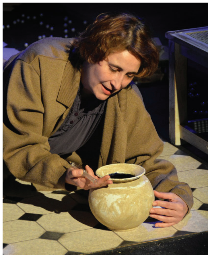
Bendita Gloria - España.

Con la dirección, adaptación y actuación de Abdiel Tapia, la obra está basada en un cuento gótico de Edgar Allan Poe, que presenta a un narrador anónimo obsesionado con el ojo enfermo de un anciano con el cual convive y finalmente decide asesinarlo, y da pie para que el actor protagonista despliegue ampliamente sus dotes actorales.