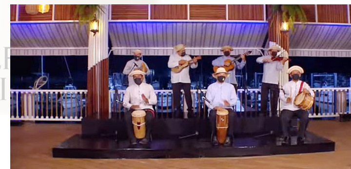
Orquesta Folclórica Los Juglares.