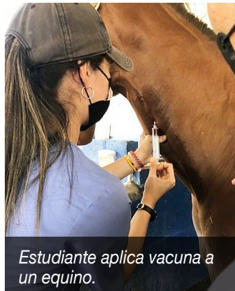
Estudiante aplica vacuna a un equino.