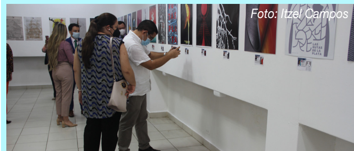
Participantes en la exposición en la galería Manuel E. Amador.