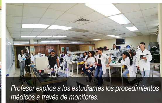
Profesor explica a los estudiantes los procedimientos médicos a través de monitores.