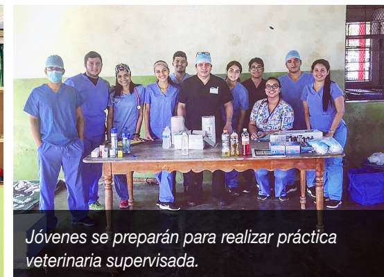
Jóvenes se preparan para realizar práctica veterinaria supervisada.