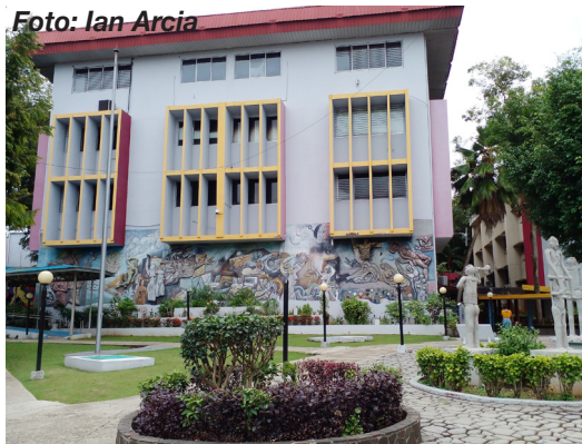
Facultad de Comunicación Social.