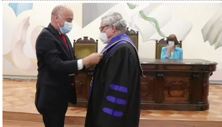
Se le impone la esclavina y medalla de la Universidad de Panamá.