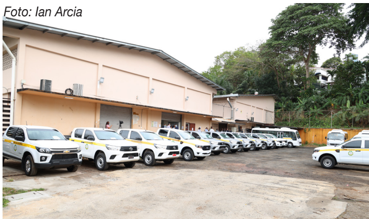
Entrega de 22 vehículos a diferentes unidades de la Universidad de Panamá.