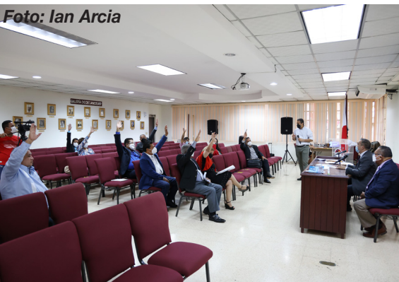
Votación en el Consejo de Ciencias Sociales y Humanísticas.

Geneteau comentó que tiene conocimiento de que se estará dando prioridad a los egresados de las universidades nacionales y, posteriormente, a los estudiantes que procedan de países aledaños.