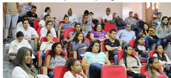
Estudiantes de la universidad de Panamá.

del uso de laboratorios y la presencialidad de los estudiantes.