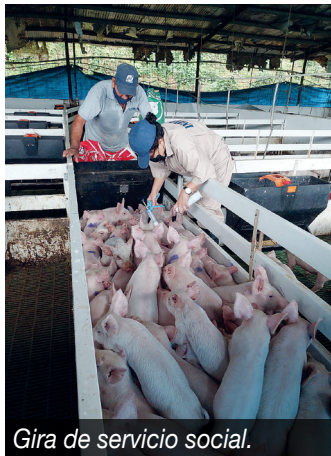
Gira de servicio social.