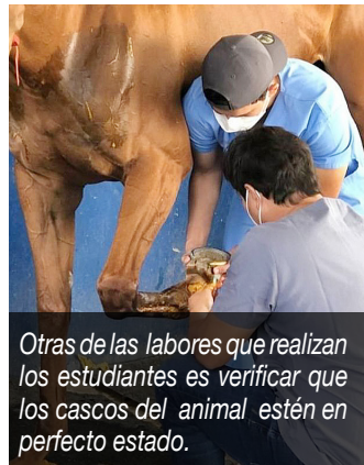
Otras de las labores que realizan los estudiantes es verificar que los cascos del animal estén en perfecto estado.

Finalmente, estamos trabajando para firmar convenios con entidades nacionales y asociaciones de productores con el objeto de llevar a los estudiantes a estas áreas para que desarrollen sus habilidades y destrezas.