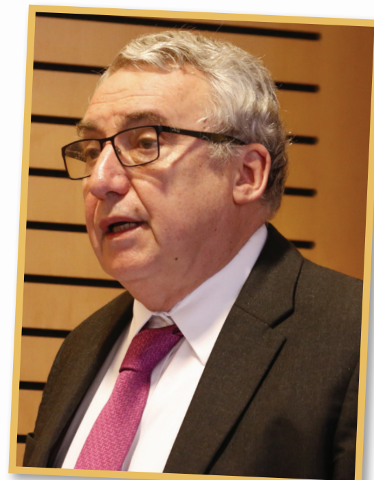
Rector Ennio Vivaldi Vèjar

Actualmente, cuenta con 6.133 las y los nuevos estudiantes que se encuentran matriculados en alguna de las más de 70 carreras de la Casa de Bello.